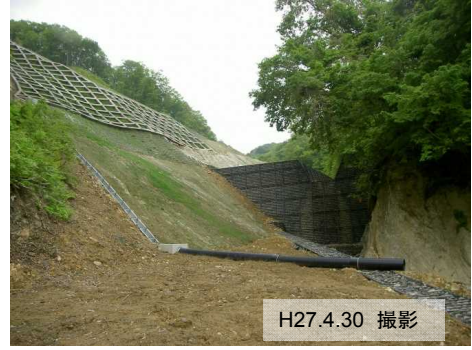
ニゴリ沢第二工区 [地すべり防止工事]