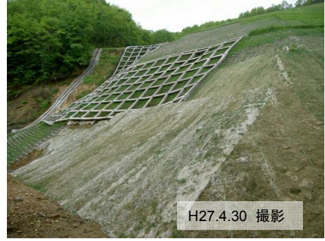
ニゴリ沢第二工区 [地すべり防止工事]

民有林直轄地すべり防止事業では平成25年度からの継続として2件の工事を実施しました。また、当該地すべり防止区域では平成27年度も、山腹工を中心とした対策工と既設排水トンネル工の補修工事を実施しているところです。