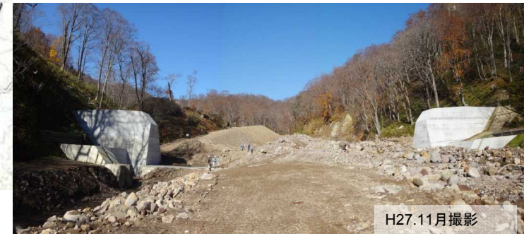
右岸袖部のコンクリート打設完了

地震により発生した土石流の影響から当該溪流に大量の土石等が堆積している状況にあることから、下流域への流出を防止することを目的に平成26年度から透過型ダム建設を進めており、平成27年度も継続して実施しました。 なお、28年度はスリット部本体に着手する予定です。