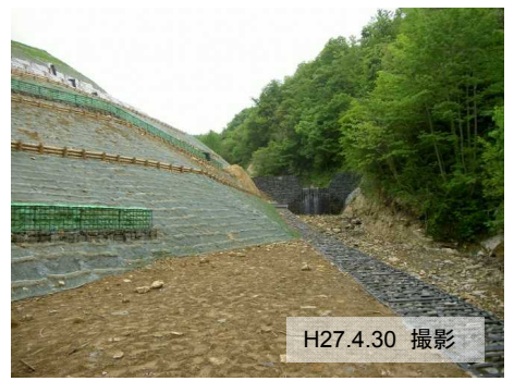
ニゴリ沢第一工区 [地すべり防止工事]