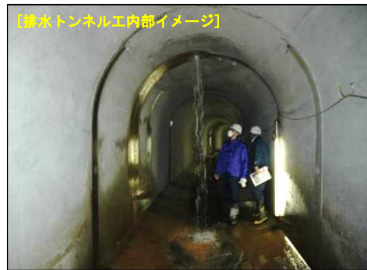
【排水トンネル工内部イメージ】