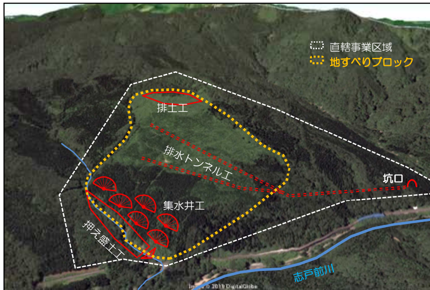
対策する地すべり