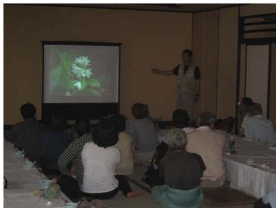
スライドショーの様子