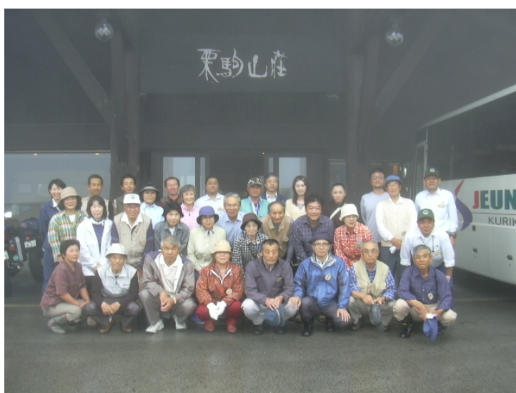
栗駒山荘前での記念撮影