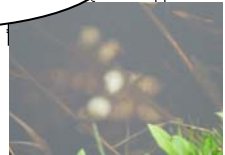
クロサンショウウオの卵