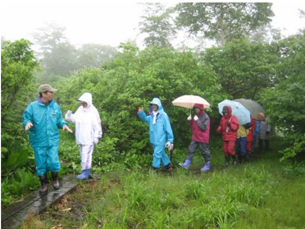
↑ボランティアの方によるガイドで湿原の木道を歩く参加者→