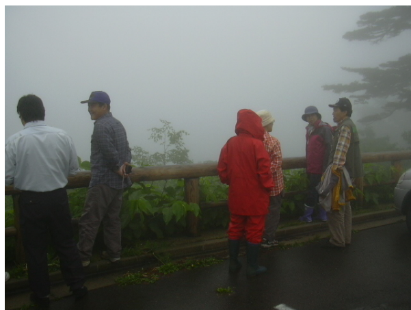
霧に煙る須川湖畔

午前中の雨が上がった後に発生した濃い霧のため、残念ながら須川湖の湖面を見ることはできませんでしたが、とても幻想的な湖畔散策となりました。