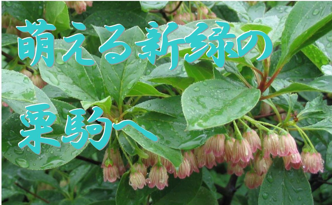
サラサドウダン（野鳥の森）

開催日 : 平成 19 年 6 月 22 日（金） 開催場所 : 栗駒国定公園（野鳥の森→栗駒山荘→須川湖） 参加人数 : 22 名