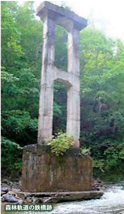
森林軌道の鉄橋跡