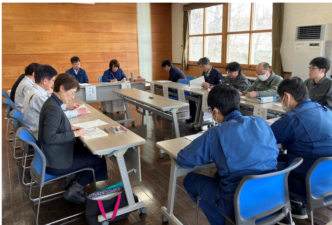
森林整備推進協定運営会議を開催し協定延長を決議しました