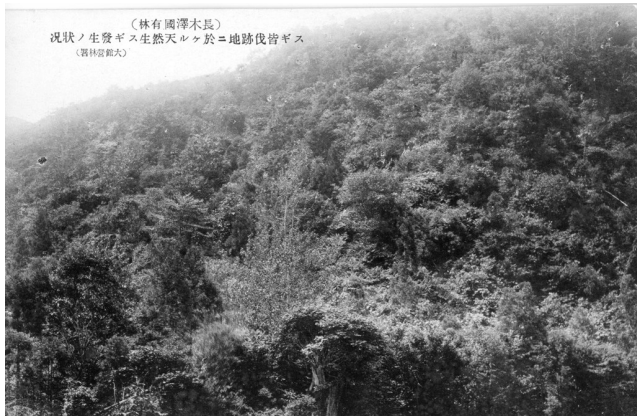
9. スギ皆伐跡地における天然生スギ発生の状況