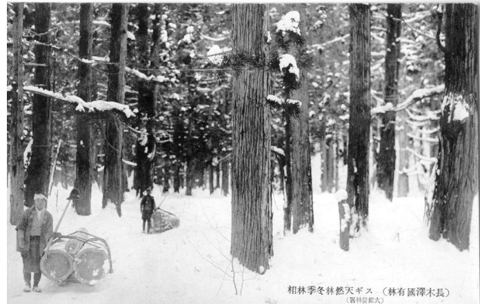
6. スギ天然林冬季林相