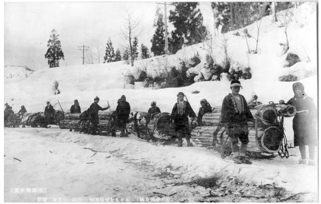
8. スギ丸太雪橇運材 1台約1m 3 に積載 ※長木青年団新沢支部員の法被