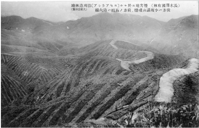
1. 煙害地におけるニセアカシア筋刈造林地 後方は小坂鉦山噴煙、前方の長蛇は防火線

※封筒10枚入り、大館営林署 長木沢国有林と書かれ、説明書きがある。 作成年代は昭和初期とみられる。