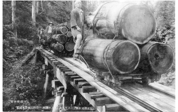
4. スギ丸太トロリー運材 1台約3m 3 積載