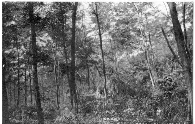
10. ニセアカシア造林地(12年生)