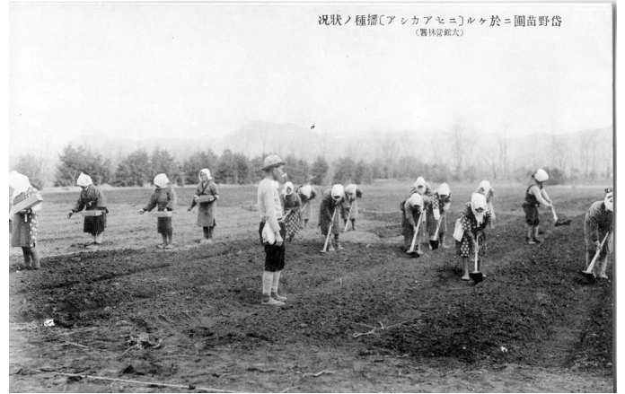
2. 岱野苗圃におけるニセアカシア播種の状況