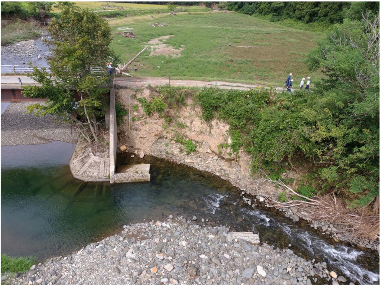
写真2.被災状況（全景横より）