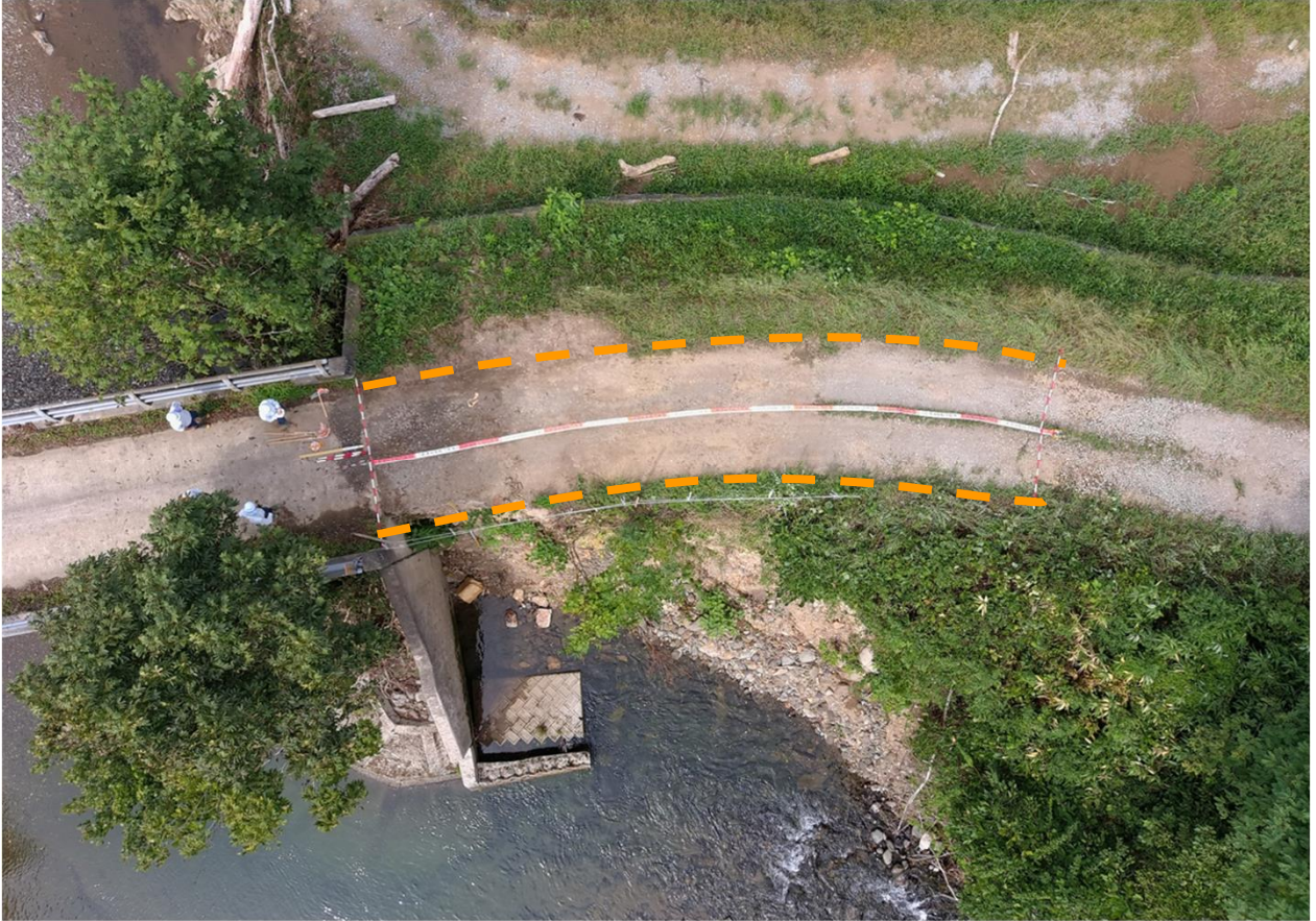
写真1.被災状況（全景真上より）