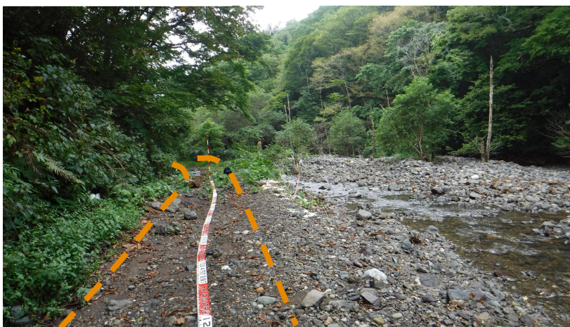
写真3.被災状況 (終点側→起点側)