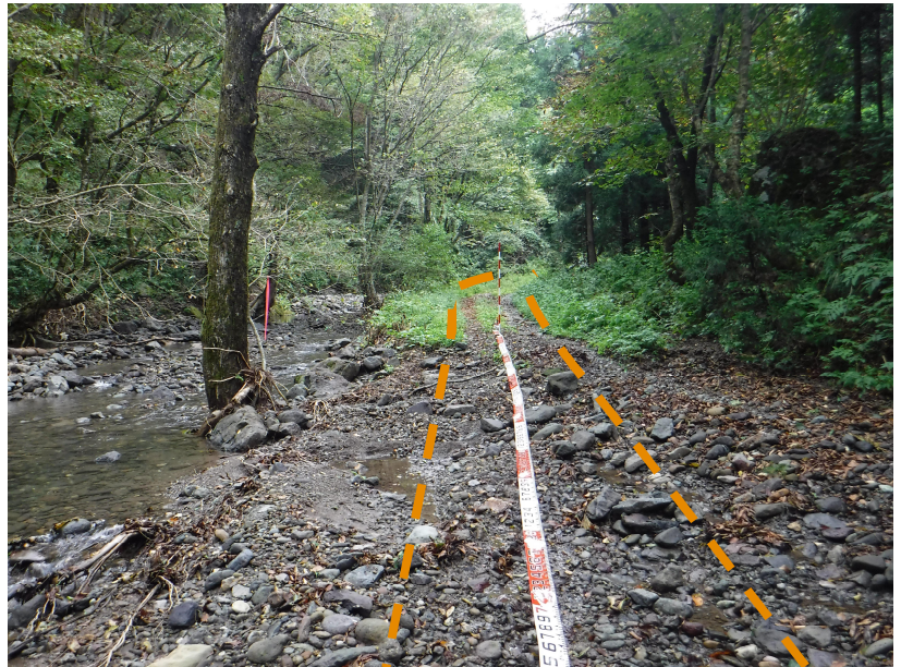
写真2.被災状況 (起点側→終点側)