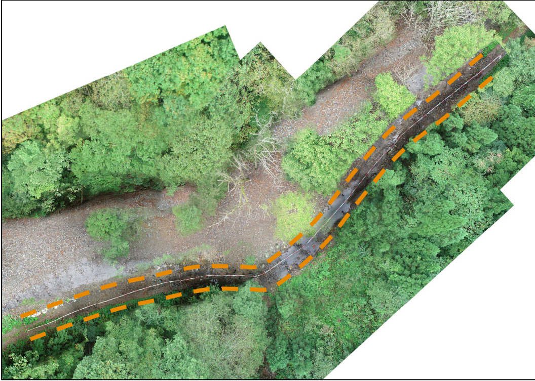
写真1.被災状況 (上空から全景)