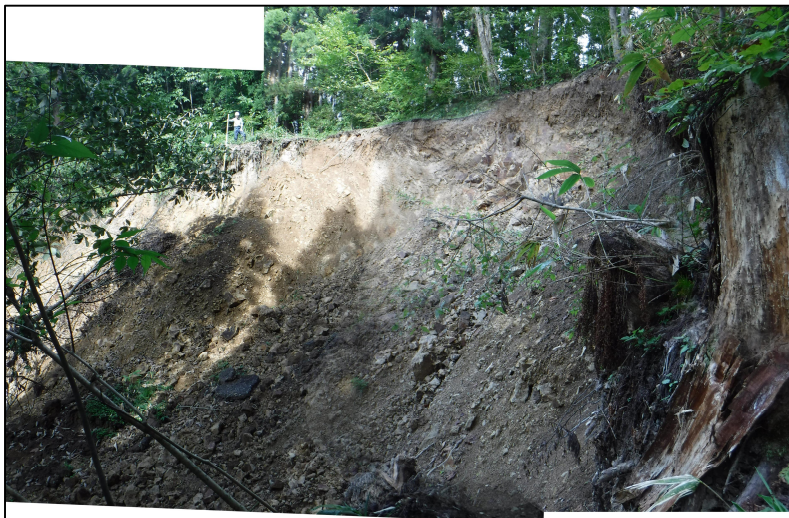
写真9.被災状況 （路面崩落状況：箇所④）