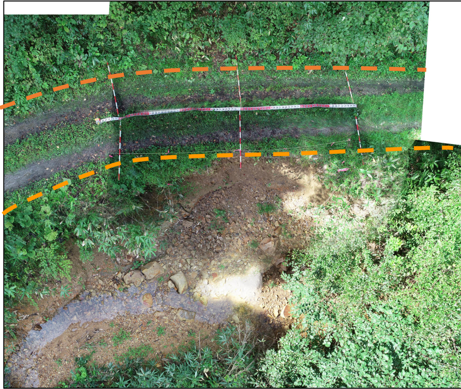
写真3.被災状況（上空から全景：箇所②）