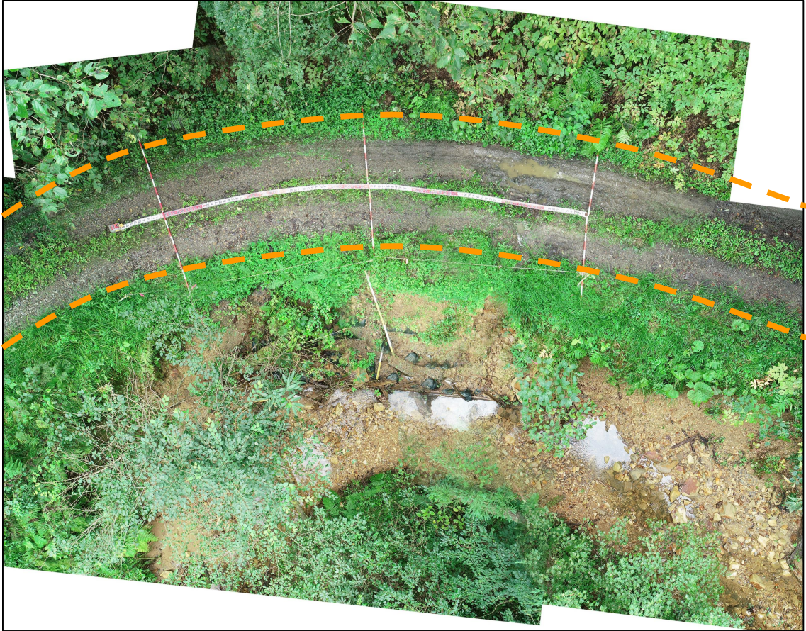
写真 5.被災状況（上空から全景：箇所③）