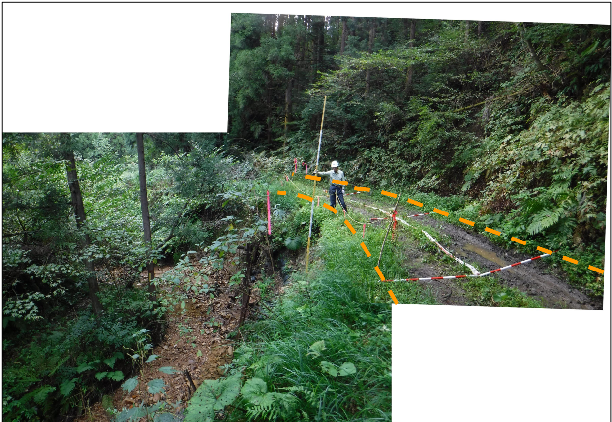
写真 6.被災状況（起点側→終点側：箇所③）