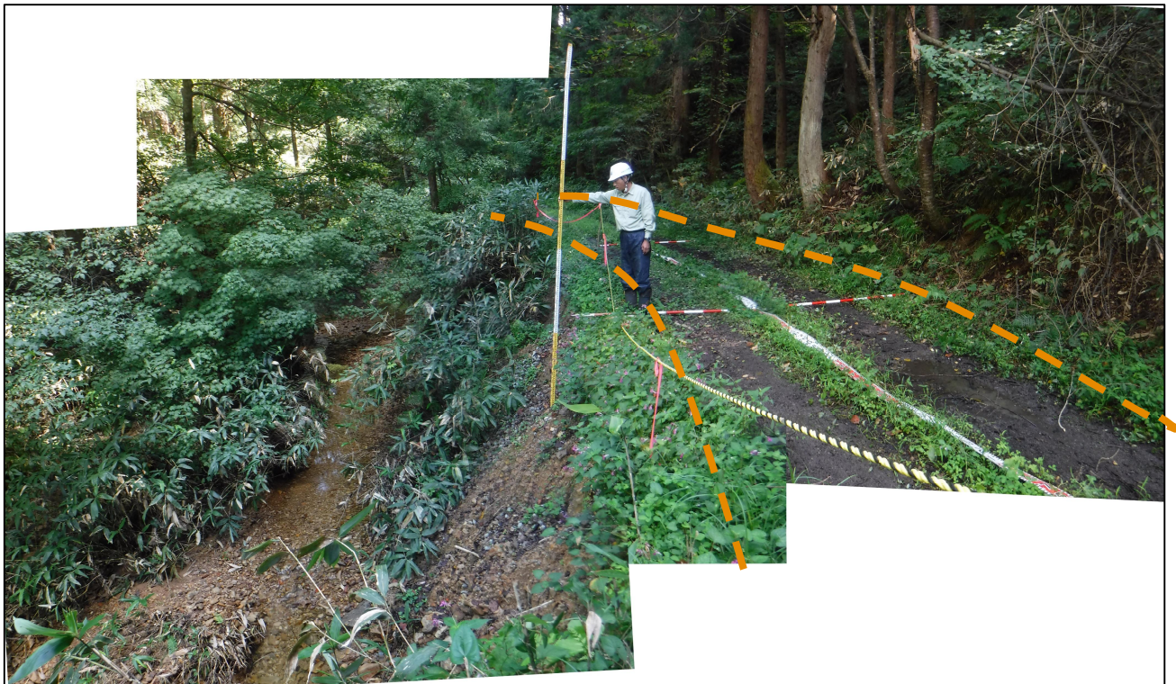
写真2.被災状況（起点側→終点側：箇所①）