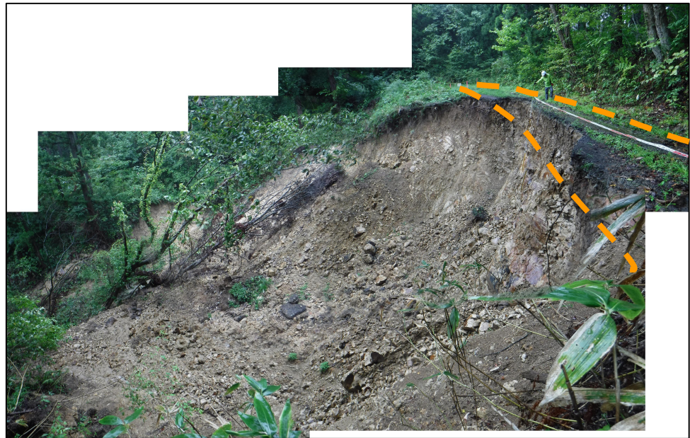
写真8.被災状況 （起点側→終点側：箇所④）