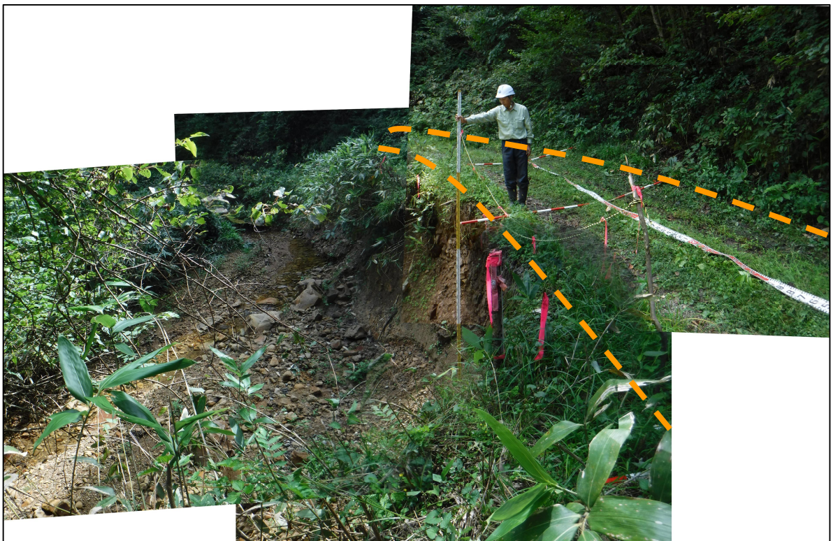
写真4.被災状況（起点側→終点側：箇所②）