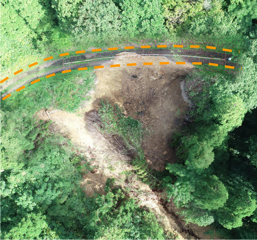
写真7.被災状況 （上空から全景：箇所④）