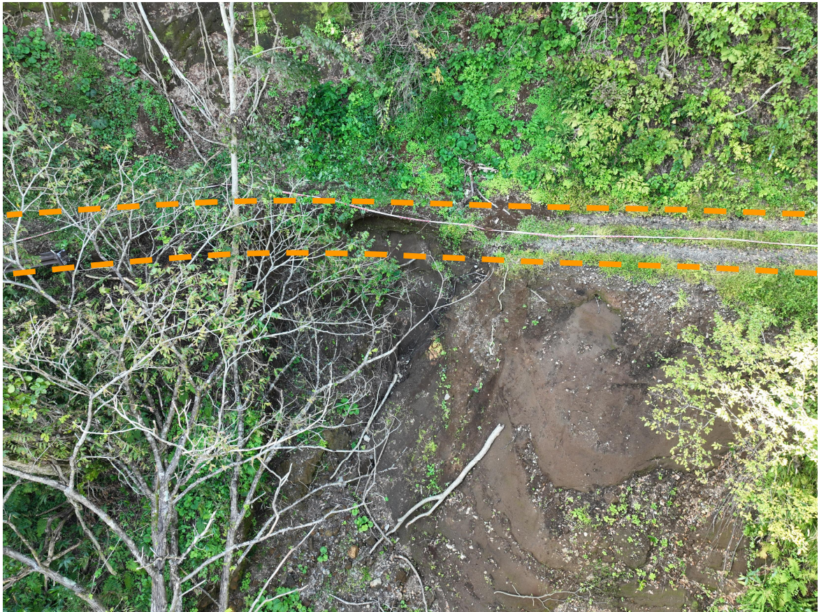
写真1.被災状況（全景：箇所①）