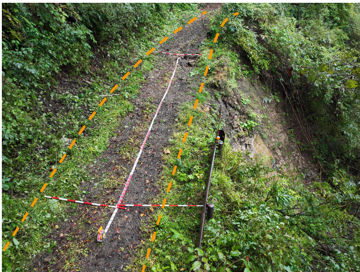
写真4.被災状況（終点側→起点側：箇所②）