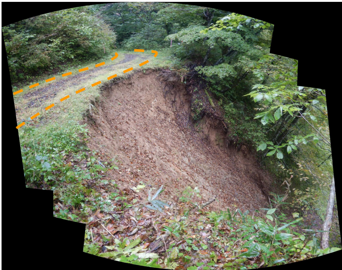
写真 6.被災状況（終点側→起点側：箇所③）