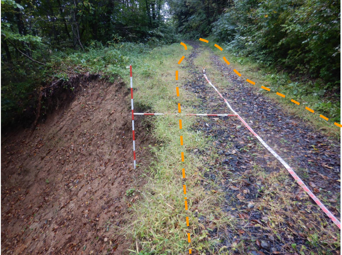
写真 5.被災状況（起点側→終点側：箇所③）