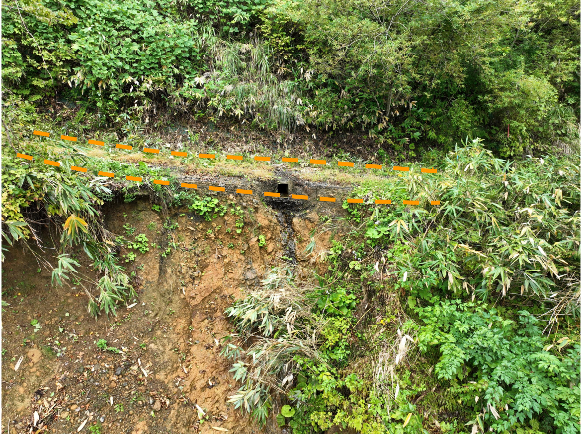
写真 9.被災状況（全景：箇所⑤）