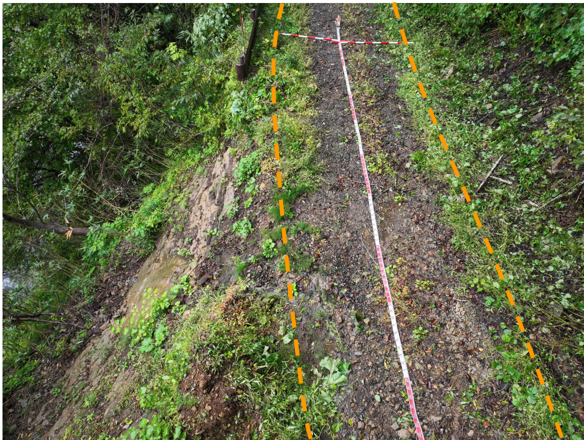
写真3.被災状況（起点側→終点側：箇所②）