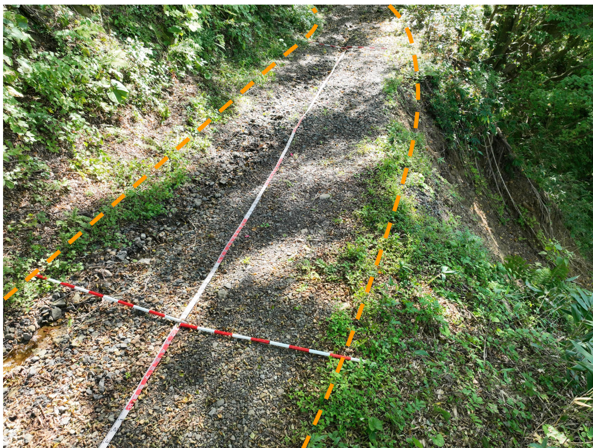
写真8.被災状況（終点側→起点側：箇所④）