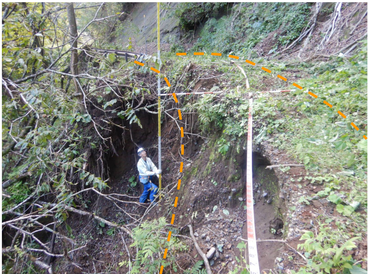
写真2.被災状況（起点側→終点側：箇所①）