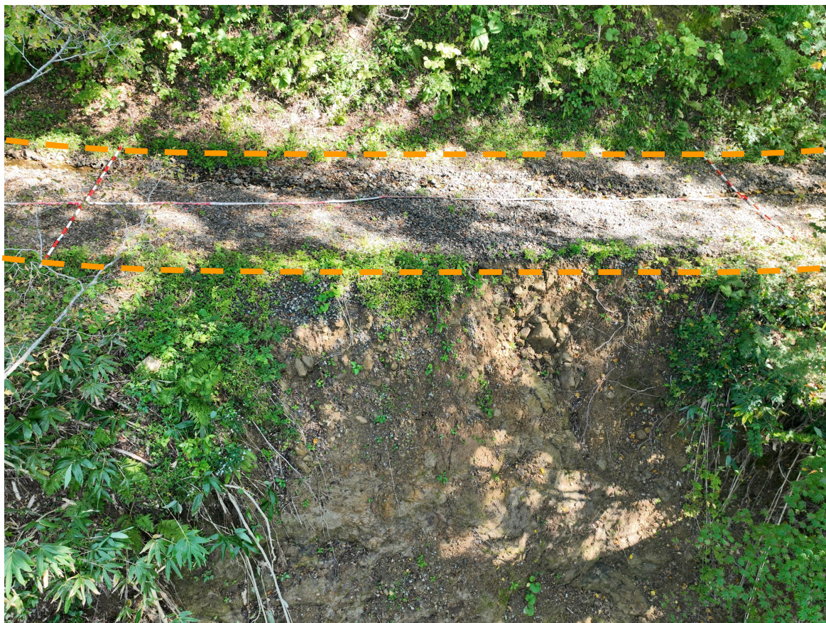
写真7.被災状況（起点側→終点側：箇所④）