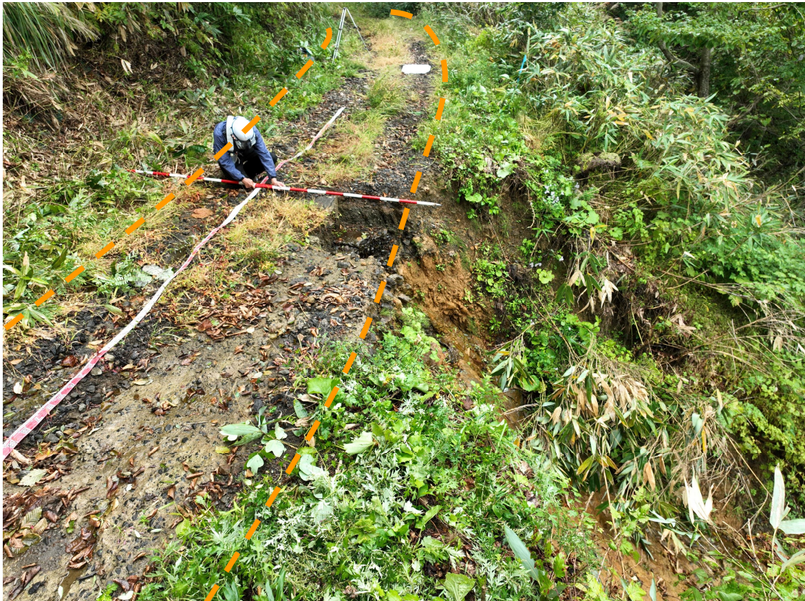
写真 10.被災状況（終点側→起点側：箇所⑤）