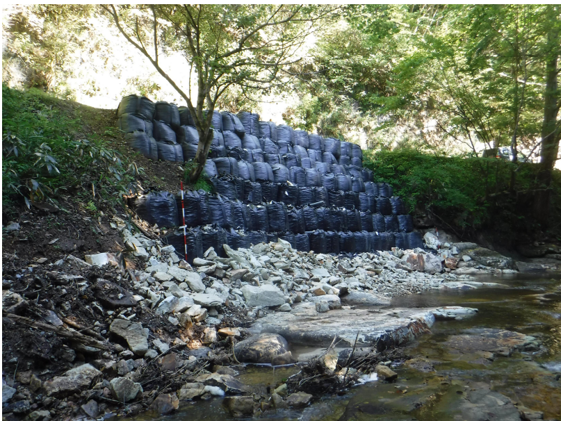
写真3.被災状況 (大型土のう設置)