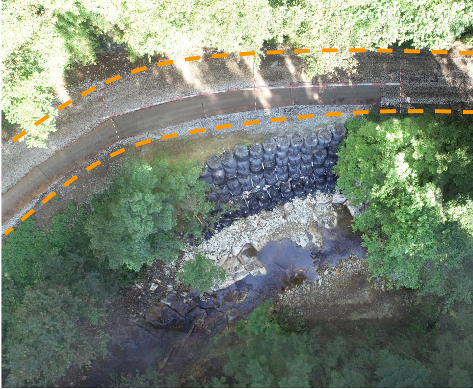
写真1.被災状況 (上空から全景) ※応急復旧実施箇所