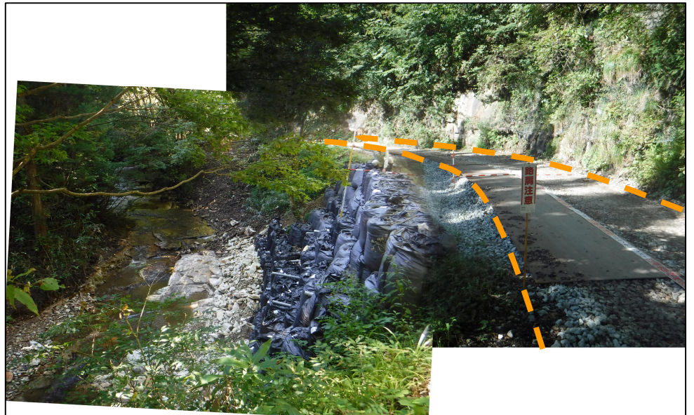
写真3.被災状況 (起点側→終点側)