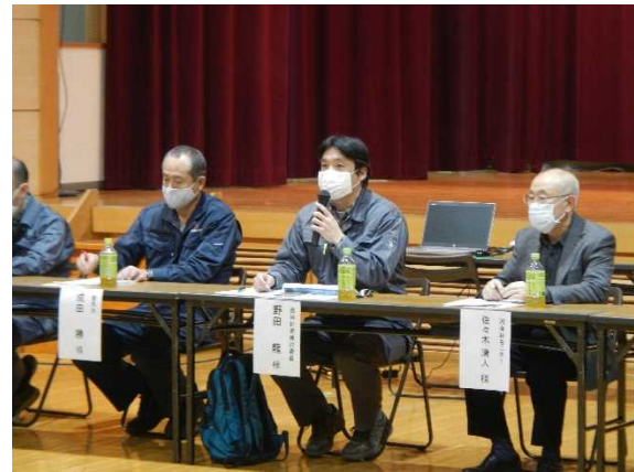
森林計画検討委員・国有林モニターの意見を把握