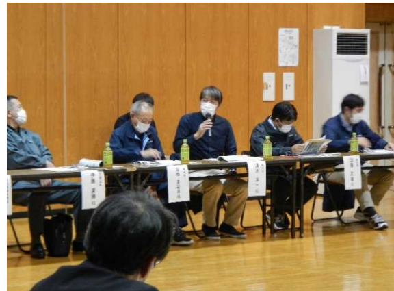
一般参加者の意見を把握