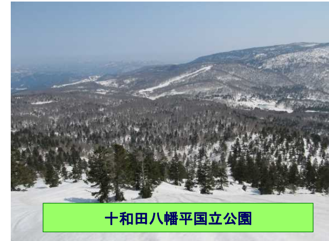
十和田八幡平国立公園