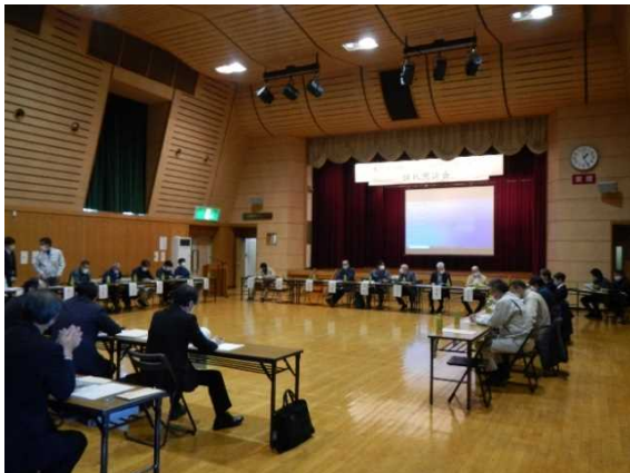
住民懇談会 会場の様子