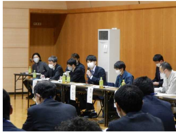
市町村の意見を把握