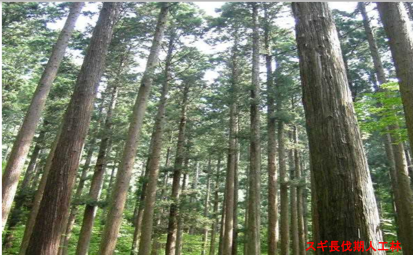
スギ長伐期人工林