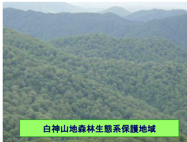
白神山地森林生態系保護地域