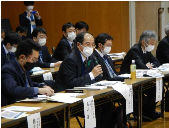
対話型の意見交換