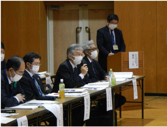
対話型の意見交換