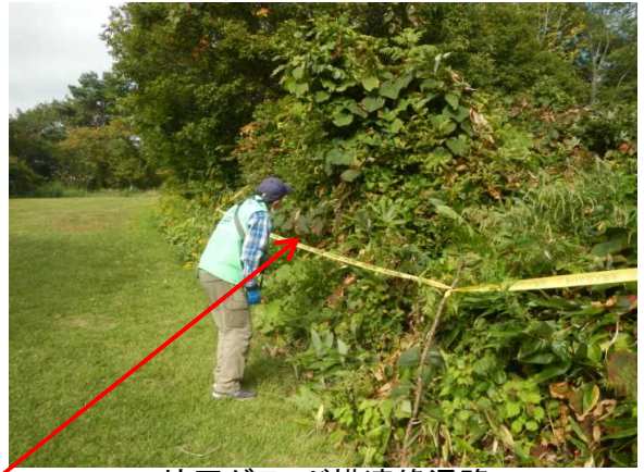
坊平グランド横連絡通路 黄色スズメバチの巣

9月24日 雨 気温10℃ 強風 非常に寒かった。 地蔵尊秋の例大祭(10:30~)登山者も数名いましたが、悪天候の注意喚起 ユートピアゲレンデにて森林管理署のアオモリドマツの種採取見学 午後からは蔵王林道の巡視