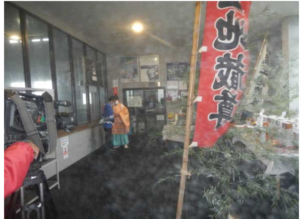
地蔵尊秋の例大祭