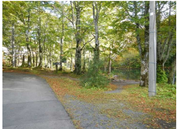
ドッコ沼 百名山の撮影隊