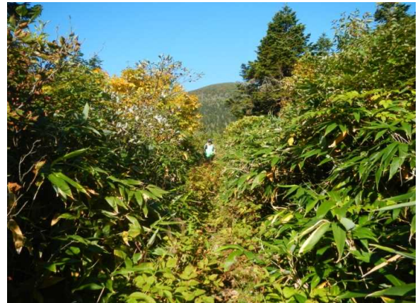
祓川コース 一部藪漕ぎ