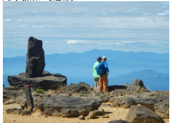
熊野岳山頂で西方向の山塊説明