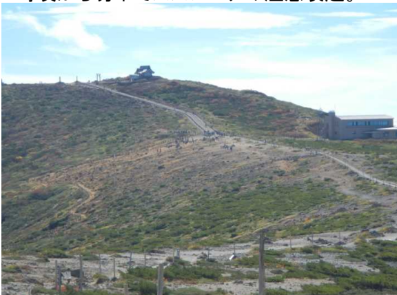
御釜付近は登山者、観光客が多かった