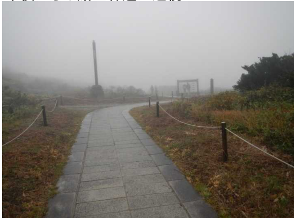
雨で強風 気温10℃ 非常に寒かった

9月24日 雨 気温10℃ 強風 非常に寒かった。 地蔵尊秋の例大祭(10:30~)登山者も数名いましたが、悪天候の注意喚起 ユートピアゲレンデにて森林管理署のアオモリドマツの種採取見学 午後からは蔵王林道の巡視