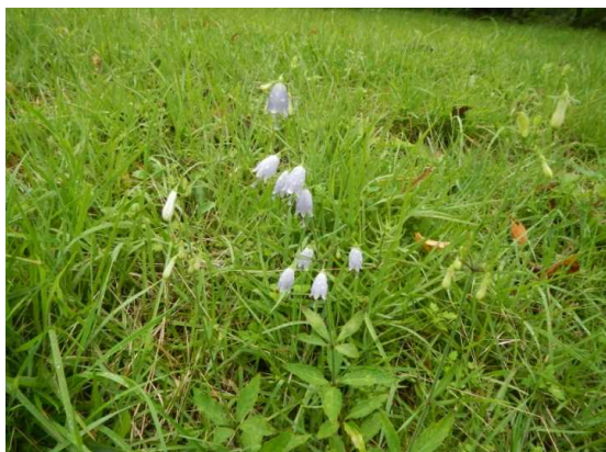
坊平のツリガネニンジン