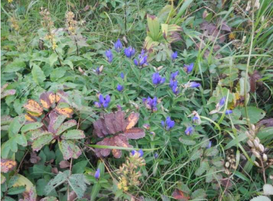
8月中旬を過ぎてリンドウが咲き始めました。

蔵王RWIにて地藏山頂駅へ。観光客、登山者は少ない。 しばらく待ったが天候は回復せず、ザンゲ坂から樹氷減コースを巡視下山。 昼食後、蔵王林道、中央散策路を巡視。 蔵王林道中頃に、大きな落石があった模様(先週の大雨か?)