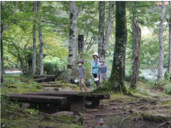
ドッコ沼付近、親子ずれの散策者(スタンプラリー中)