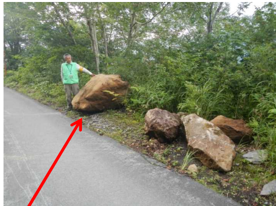
蔵王林道の落石箇所、金網を破って大きな落石があった模様