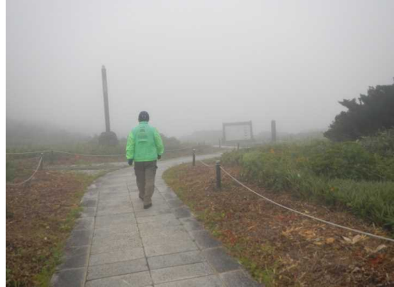
地藏山頂付近、天候は回復しない