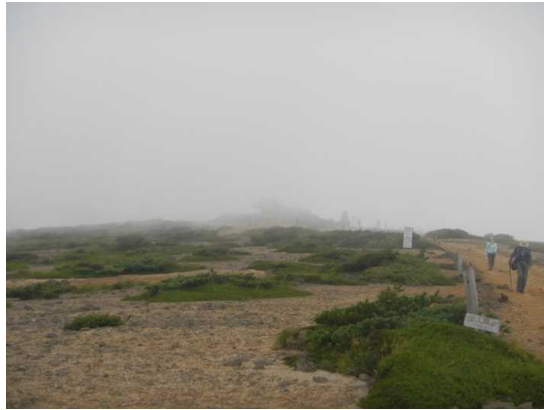
昼前の熊野岳山頂