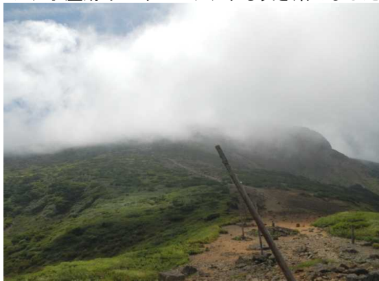
地藏山より熊野岳方面

地藏山頂駅より熊野岳へ向かう。昼前後は登山者20~25名(群馬、福島、新潟など) 13時頃まで曇っていたが、14時すぎには回復。祓川コースを巡視下山。 ワサ小屋跡下にウメバチソウも咲き始めました。