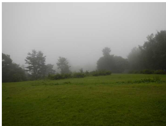
坊平でも天候回復せず