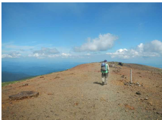
14時頃は天候回復(熊野十字路)