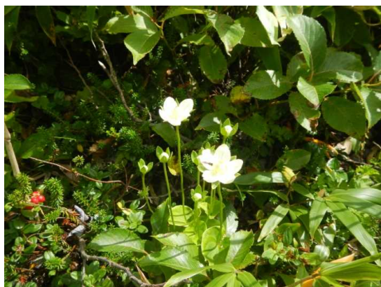
祓川コースのウメバチソウ