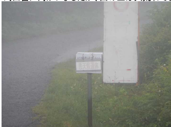
悪天候のため刈田リフトは運休

刈田岳に向かいましたが、山の上は大荒れでした。30分ほど待機、坊平に下山しました