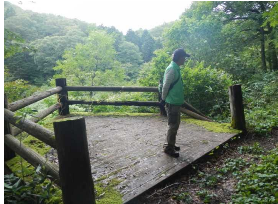
中央散策路メダマ沼展望台、壊れています。