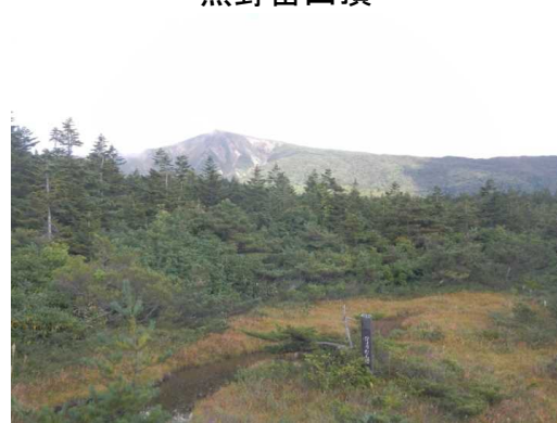
観松平のひょうたん沼