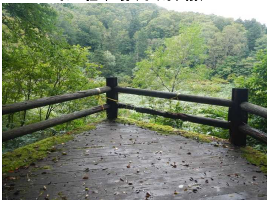
中央散策路メダマ沼