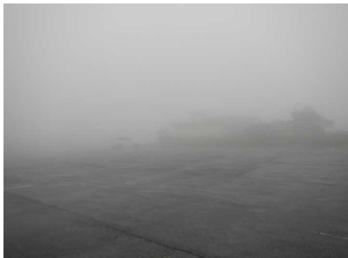
刈田駐車場(小雨、霧)

★9月19日 刈田駐車場、御田神湿原巡視。午後から蔵王林道、中央散策路 天気:小雨 気温10℃