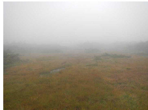
御田神湿原も視界不良