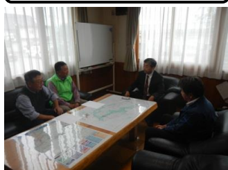
森林パトロールの状況