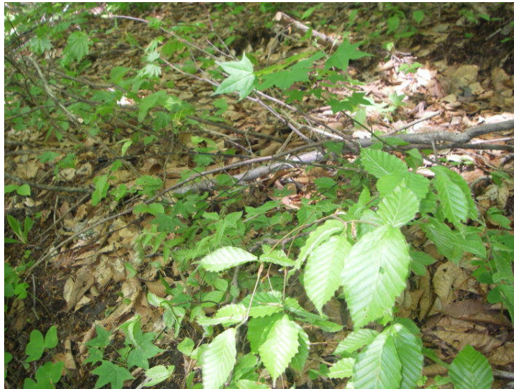
仮植した現地写真（22. 5. 21撮影）