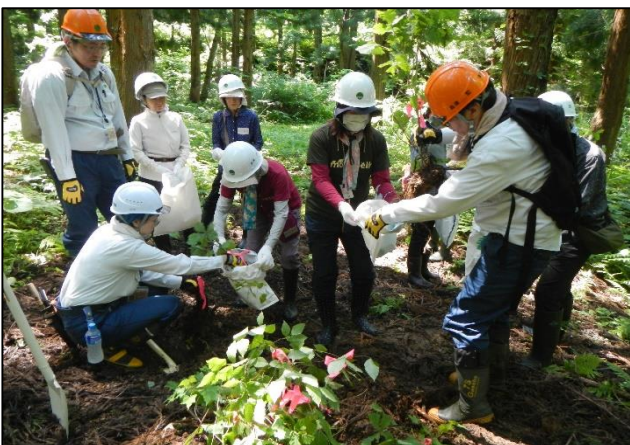
令和7年度第1回自然再生活動の様子

なお、 6月16日（火）午前中までに 、折り返しのご連絡がない場合は、 キャンセル扱い とさせていただきますので、ご了承ください。