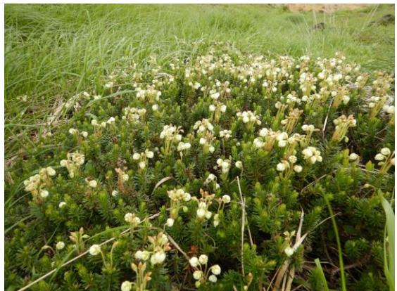
アオノツガザクラの群生 大きい！