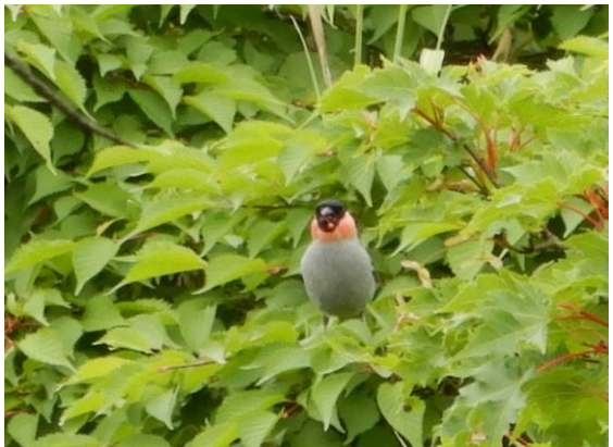
ウソ 木の実をくわえているのが見えますか？