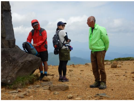
登山ルートのガイド中