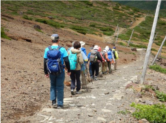
登山ガイド付きのツアー客も訪れていました。