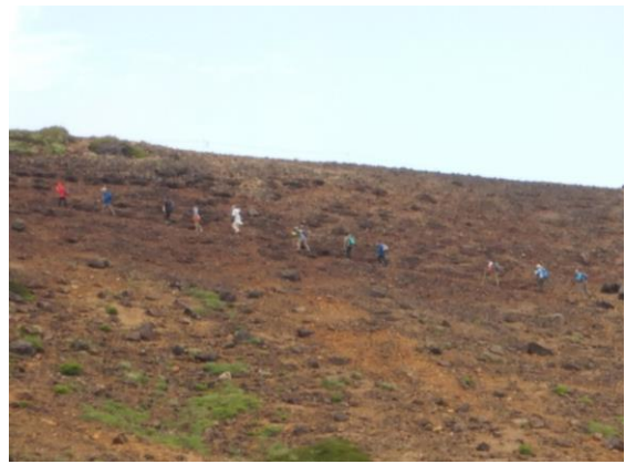
登山ルートを順序よく進む登山客 植生保護のため、登山ルートを外れずに歩きましょう。