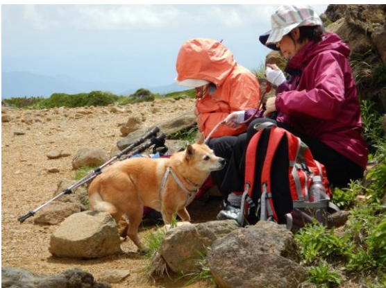
神奈川県からワンちゃんを連れて