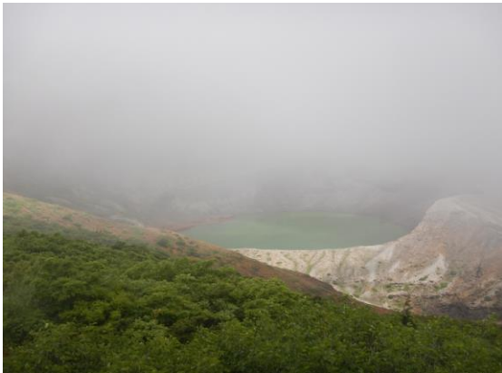
今日のお釜は霧の中