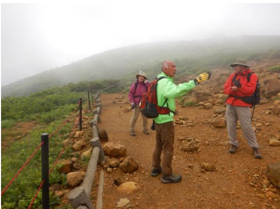
つくば市から訪れたお二人にガイド中