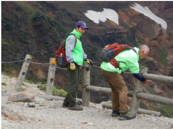
ロープの張り直し作業中