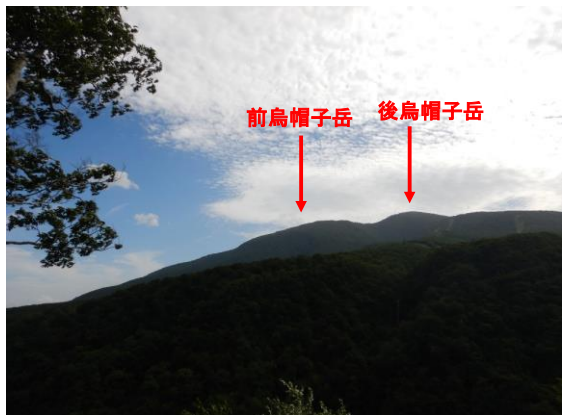
烏帽子岳が見えました。