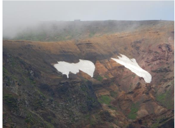
残雪も残り僅かになりました。