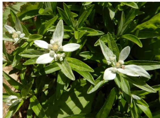
涼しげなウスユキソウ