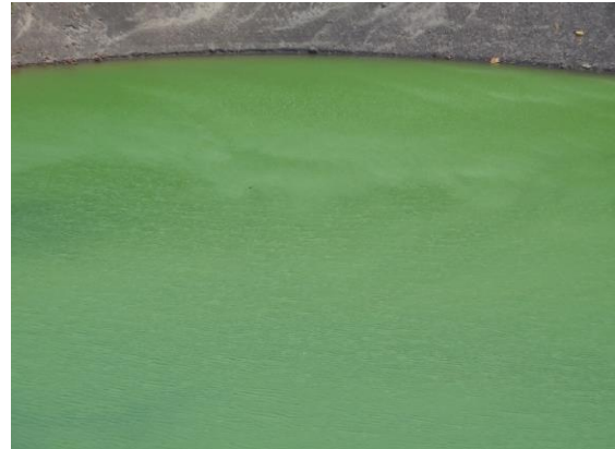
お釜の色は少しくすんでいます。