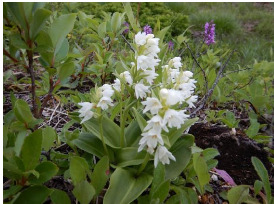
花盛りのオノエラン