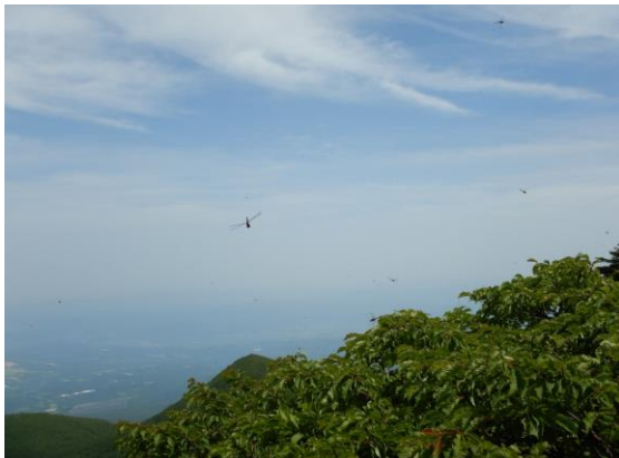
屏風岳にて トンボがもう沢山飛んでいます。