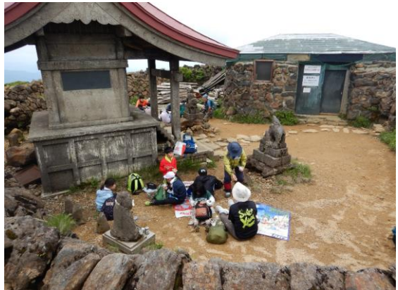
白石市から訪れた小学生