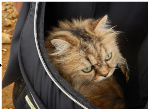
チンチラの9歳の男子 カワイイ！