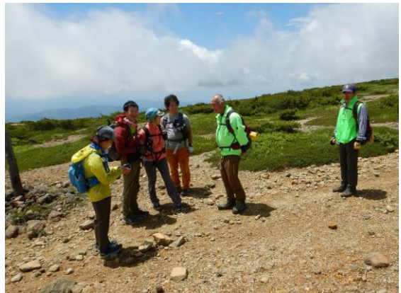
つくば市から訪れた4人グループにもガイドしました。