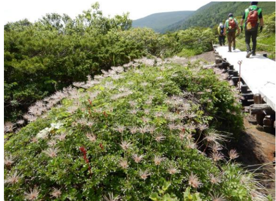
チングルマは綿毛です。