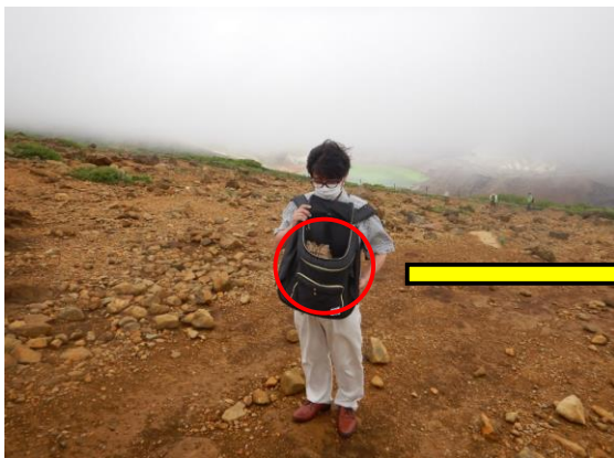
名古屋市からネコを連れて登山中