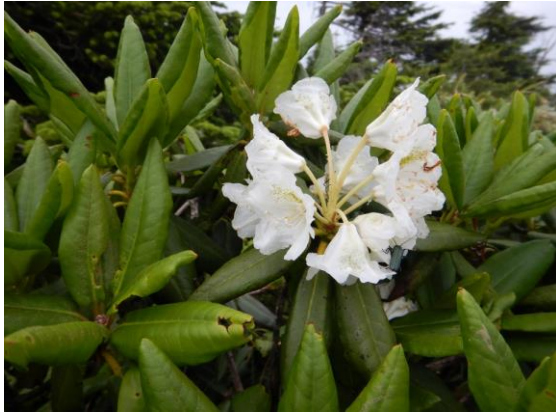
ハクサンシャクナゲ 今年は花が少なめです。