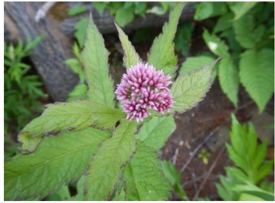
ヨツバヒヨドリはもうすぐ咲きそうです。