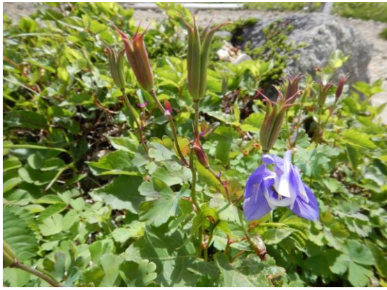
ミヤマオダマキの花は終わりかけです。