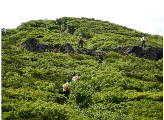
今日は登山日和でした。