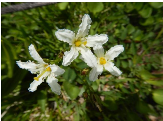
フリルが可愛いイワイチョウ