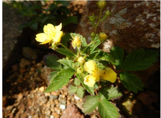
イワキンパイの可憐な黄花