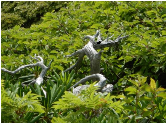
白龍に見えませんか？