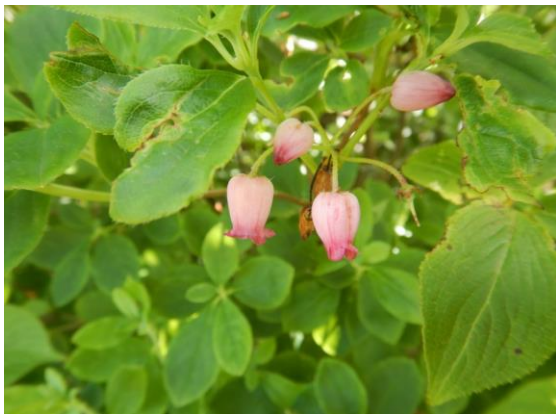
ウラジロヨウラクの可愛い花