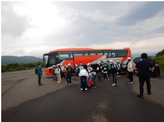
角田市から小学生が野外活動に訪れていました。