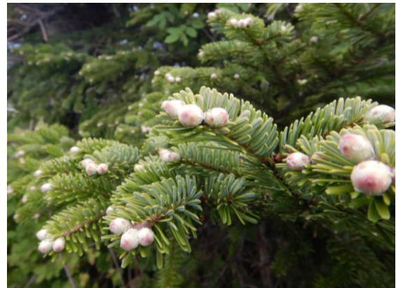
オオシラビソの葉芽