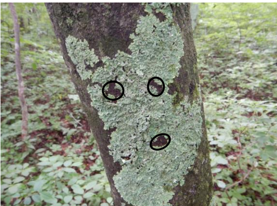
顔に見えませんか？