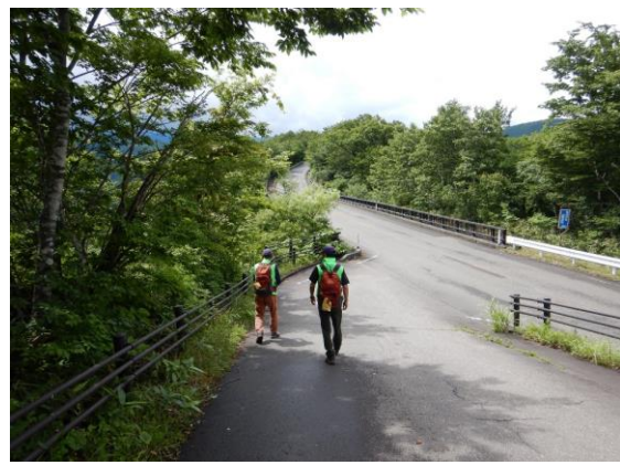
今日は滝見台から巡視スタートです。