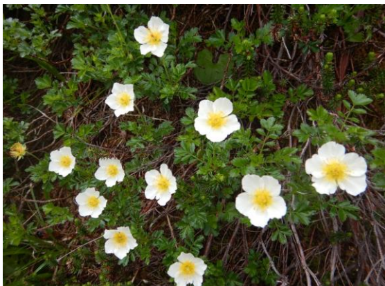
チンゲルマ 今年は花が少なめです。