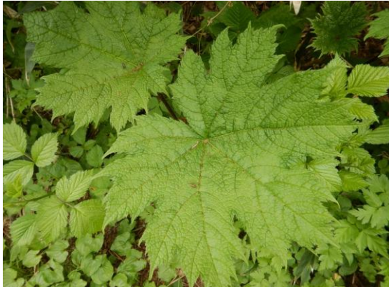
ハリブキの大きな葉