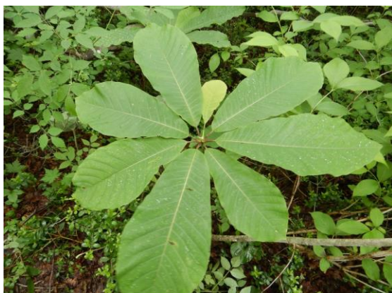
ホオノキの大きな葉