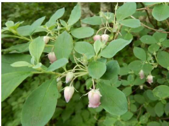
可愛いウラジロヨウラク