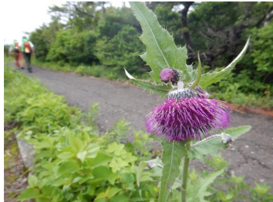
大きなオニアザミ