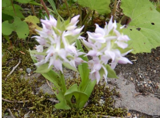
白いハクサンチドリ