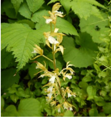
可憐なコケイラン