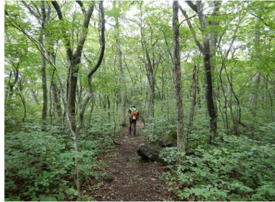
蔵王古道は清々しい道です。