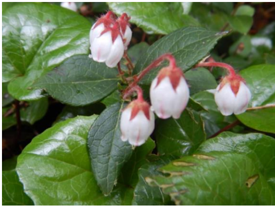
アカモノが綺麗に咲いています。