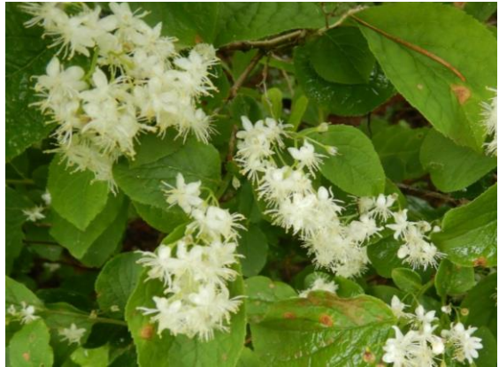
サワフタギの花が咲いています。