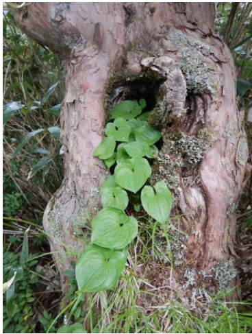
木の洞からマイヅルソウの葉が