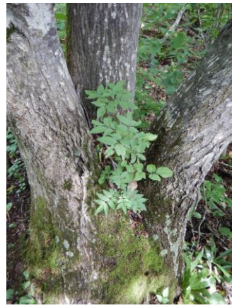
三つ股のアート木 生えているのはニフトコやナナカマドでしょうか？