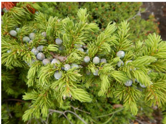
ミヤマネズも実を付けています。