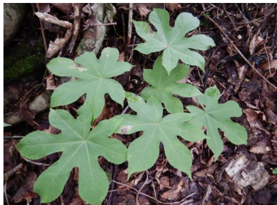
ハリギリ(センノキ)の幼木