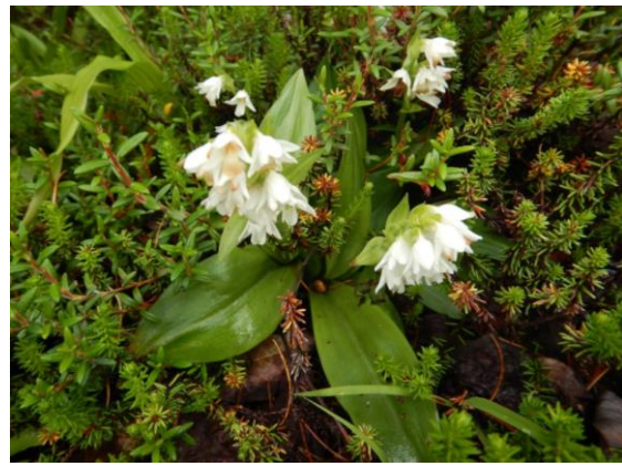
オノエラン 蔵王古道では初めてみかけました。