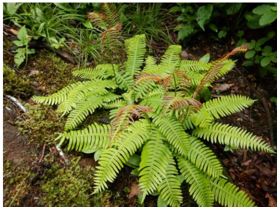
シシガシラも美しく広がっています。