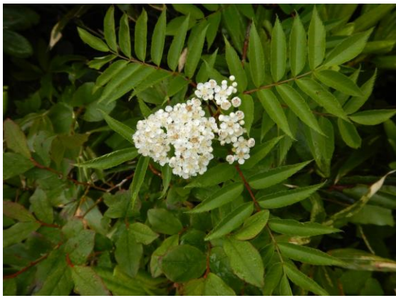
ナナカマドも咲いています。