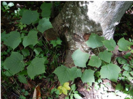
ウリハダカエデの若葉