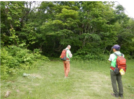
今日は蔵王古道を巡視しました。