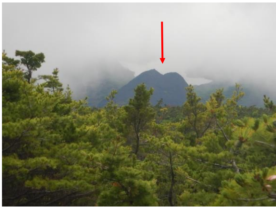
賽の嶺から見たロバの耳岩