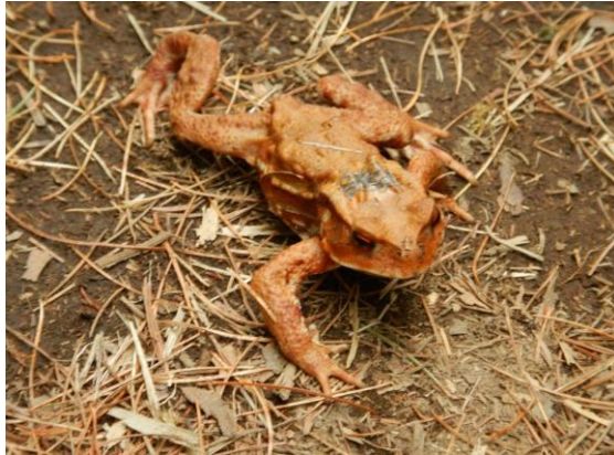
ヒキガエルのお出迎え！