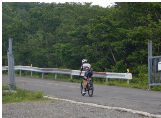
ヒルクライムする青年