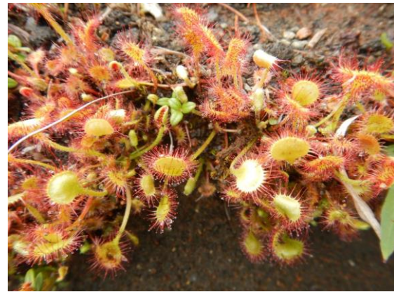
モウセンゴケの花もこれからです。