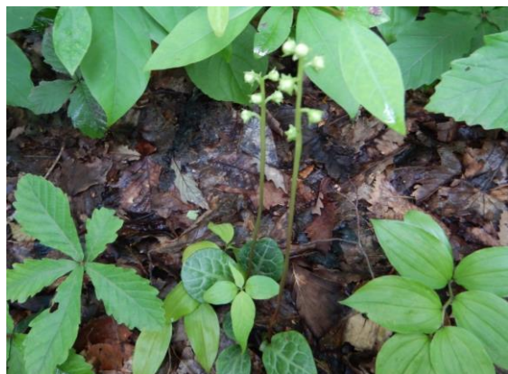
可憐なイチヤクソウ