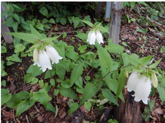
ホタルブクロの見事な袋