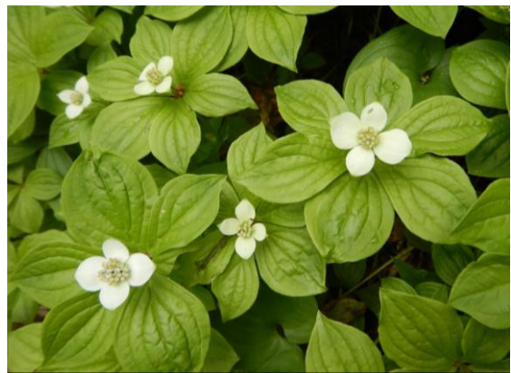
ゴゼンタチバナも咲いています。