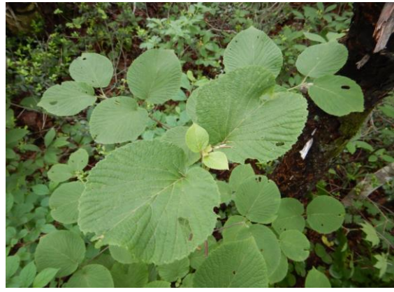
オオカメノキの若葉も綺麗