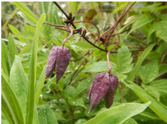
ミヤマハンショウウツル 半鐘に見えますか？