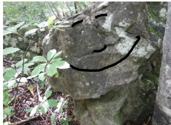
笑顔のニコニコストーンです。