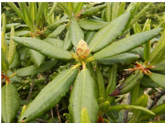
シャクナゲの花芽