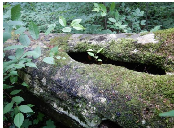
倒木はナースログ(看護の木)と呼ばれます。