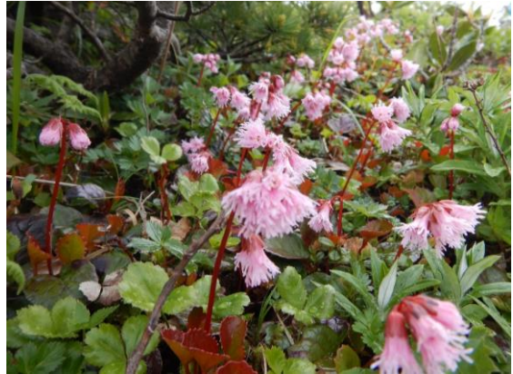
イワカガミの群生