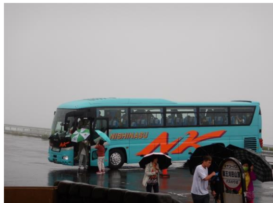
雨でも観光客は訪れています。