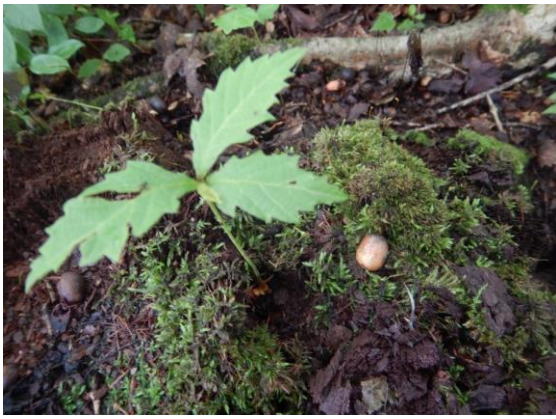
古木から新芽が出ていました。 ミズナラでしょうか？