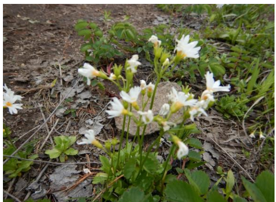
ヒナザクラ 小さな花です。