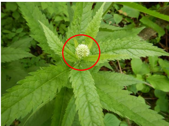
ヨツバヒヨドリの花芽