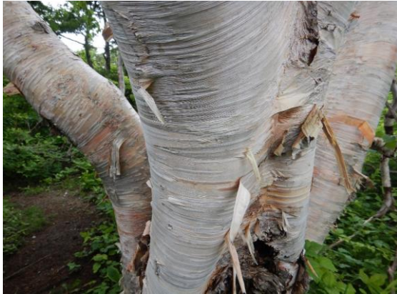
ダケカンパの木肌 剥がれやすい樹皮は着火剤に利用できます。