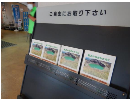
レストハウスにパンフレットを補充しました。