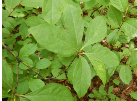
オオバクロモジは高級爪楊枝になります。