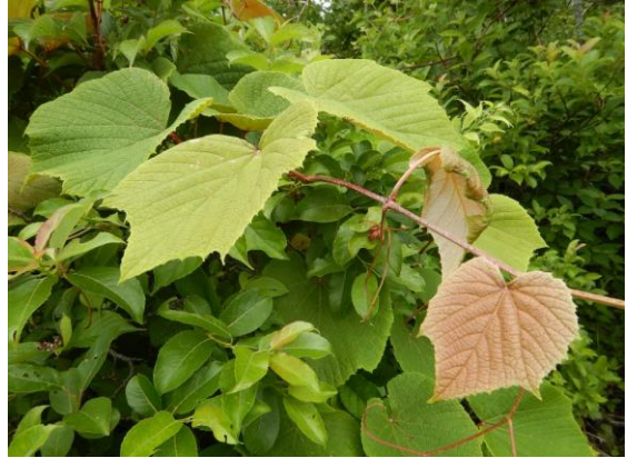
ヤマブドウのツルも伸びてきました。