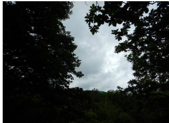
古道からのぞく空