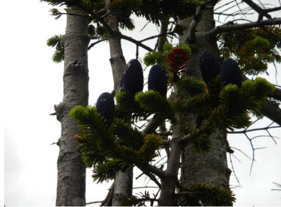
オオシラビソの実