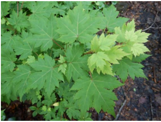
ミネカエデ 若葉が芽吹いています。