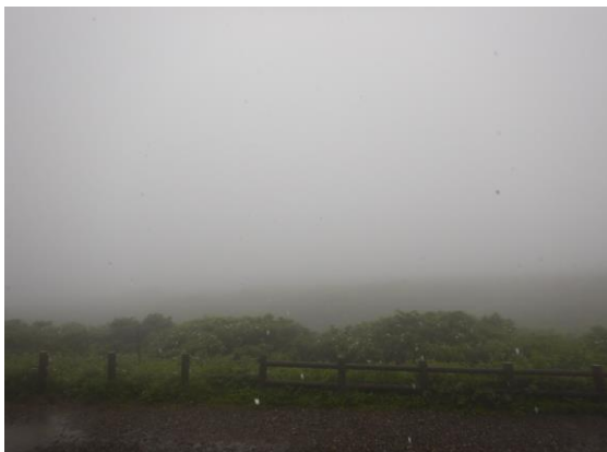
刈田岳山頂は雨でした。