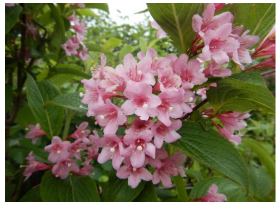
タニウツギは綺麗に咲いています。