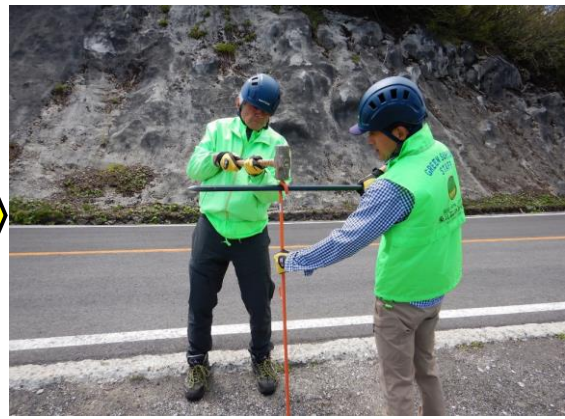
まず杭を打ちます。