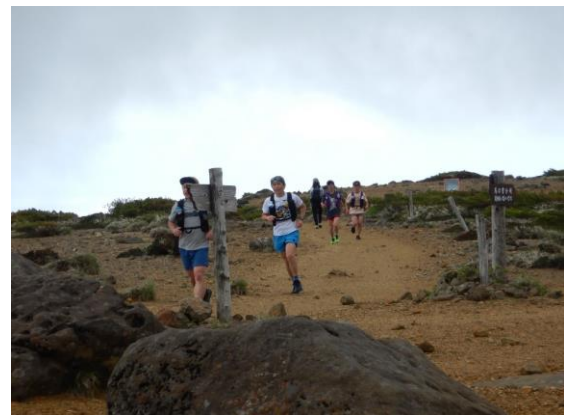
トレイルランニングの練習中の方も見かけました。