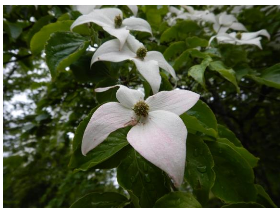
ヤマボウシ 花の終りかけには赤みがかってきます。