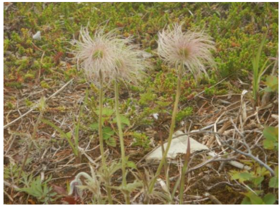
ふわふわ綿毛のオキナグサ