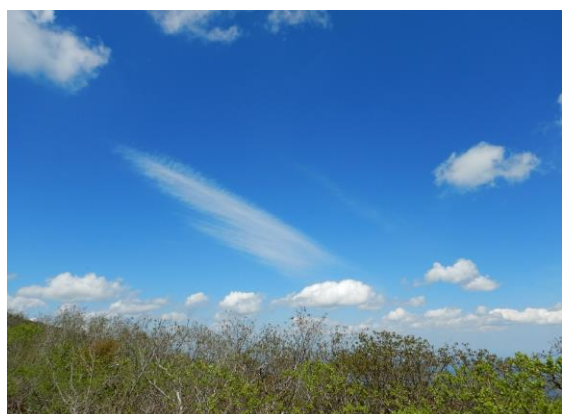
刈田峠を下ると快晴ですが、風強し！