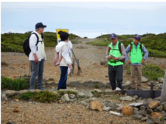
京都から訪れたお二人に、お釜について説明しました。