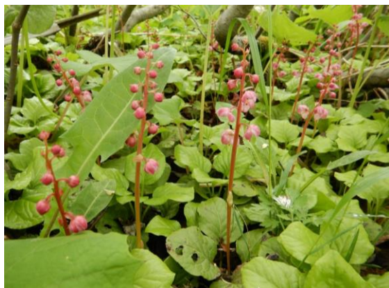
ベニバナイチヤクソウ 強心、降圧、抗菌などの作用があるとか