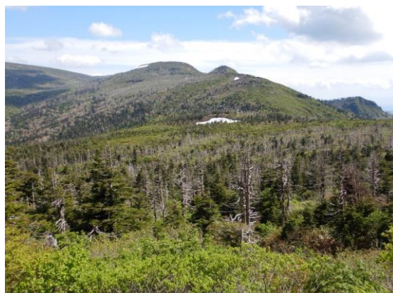
オオシラビソの立枯れです。