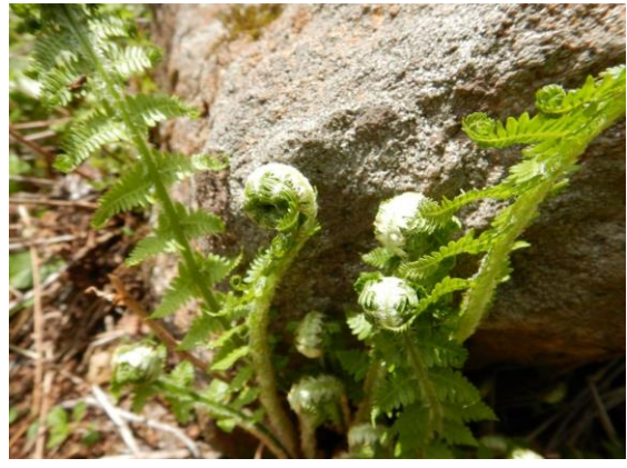
ヤマドリゼンマイの新芽でしょうか？