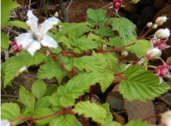
種子に苦みのあるニガイチゴ