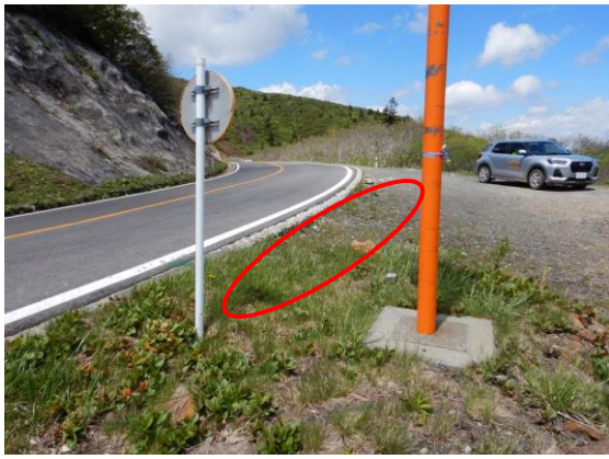
駐車禁止箇所にロープを張ります。