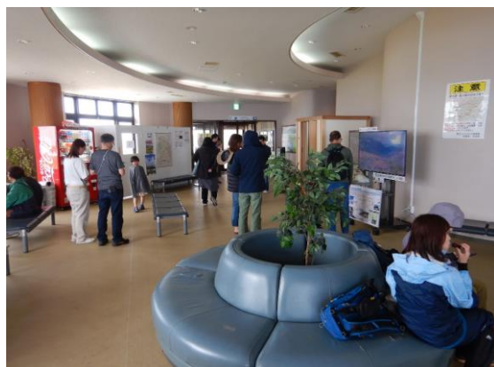
観光客の皆様もレストハウスから出られず。