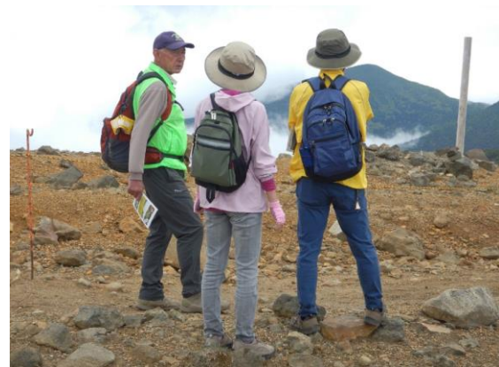
仙台から訪れたお二人にガイド中！