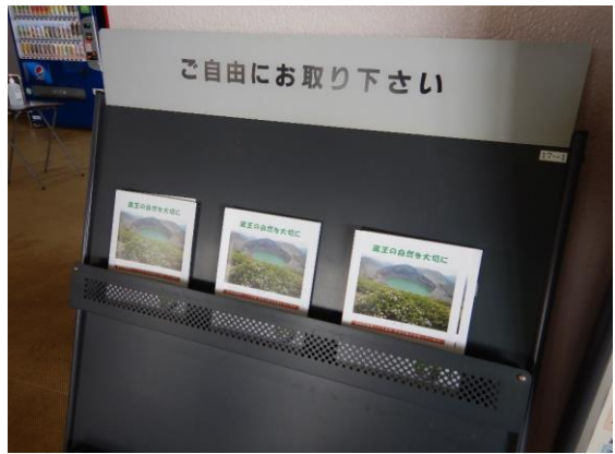
レストハウスにパンフレットを置きました。