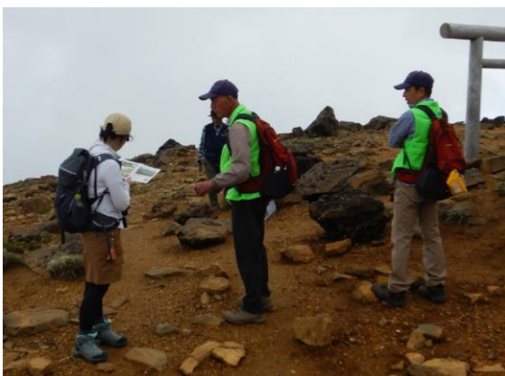
盛岡から訪れた女性 コマクサ等について質問を受けました。