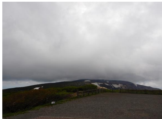
刈田岳山頂付近は強風でした。