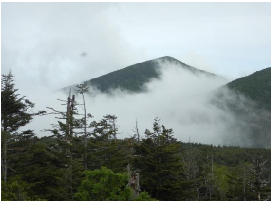
烏帽子岳が雲からひょっこり！