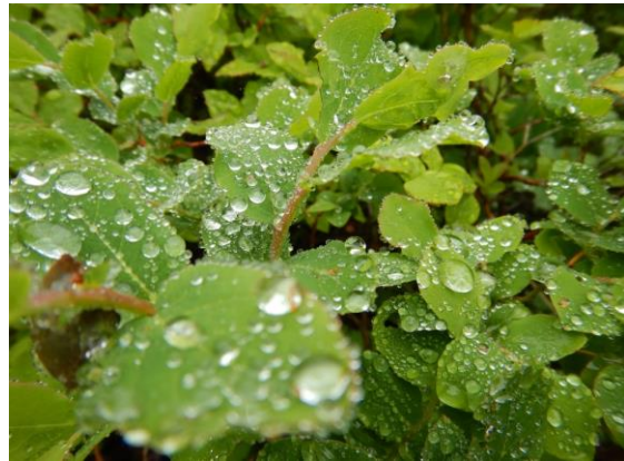
若葉の上の水滴もいい！