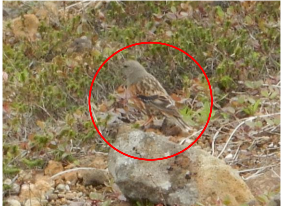
イワヒバリを見つけました。