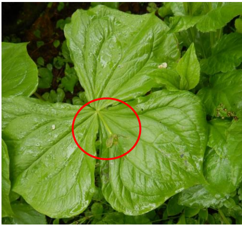
エンレイソウは花が終わりました。