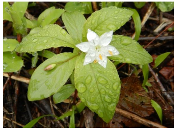
ツマトリソウの白い花