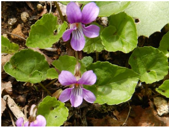
可愛いミヤマスマレ