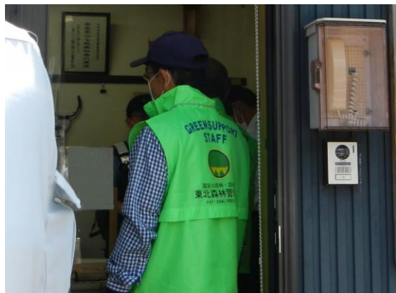
今年度もお世話になる方々にご挨拶しました。

◆6月5日 今年度も活動を開始します！ 蔵王レストハウス、大黒天及び駒草平周辺を巡視しました。