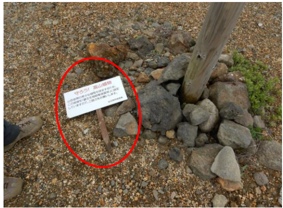
冬期に倒れた看板を立て直しました。