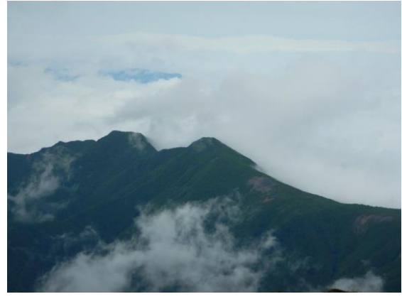
雁戸山も雲間から