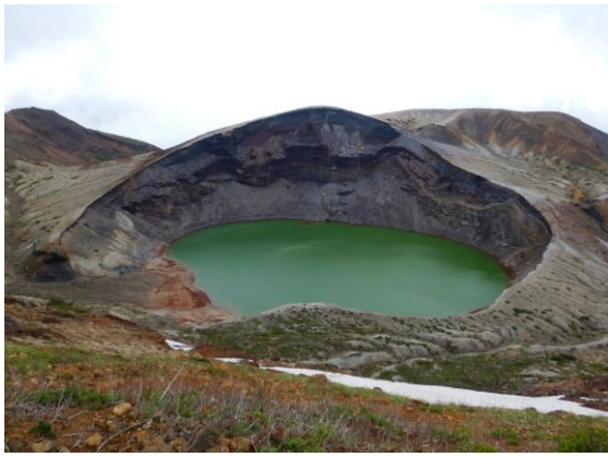
今日のお釜 水量少なめです。