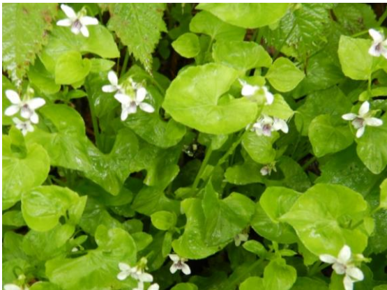
ニョイスミレ(ツボスミレ) 小さな花です。