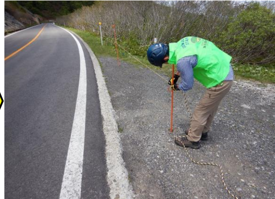
ロープを張ります。