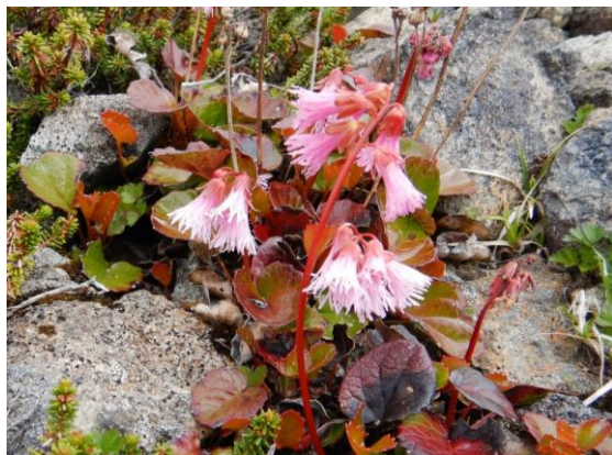
イワカガミも咲きました。