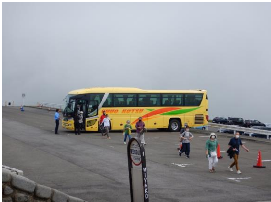
バスツアーの観光客も増えてきました。