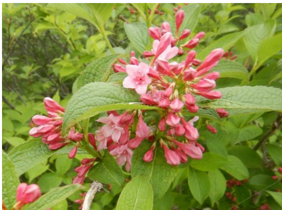
タニウツギが咲いています。