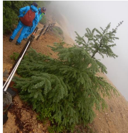
登山道沿いのカラマツが大きくなりました。