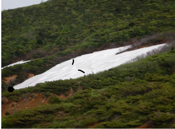
毎年見られる“残雪キツネ”