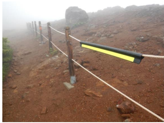
登山ルートガイドロープも設置され、反射材付！