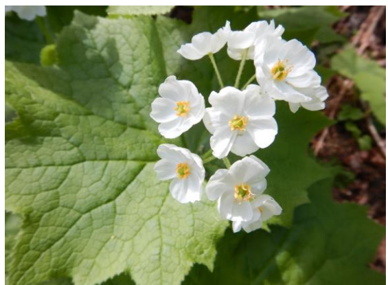
サンカヨウの白く可憐な花