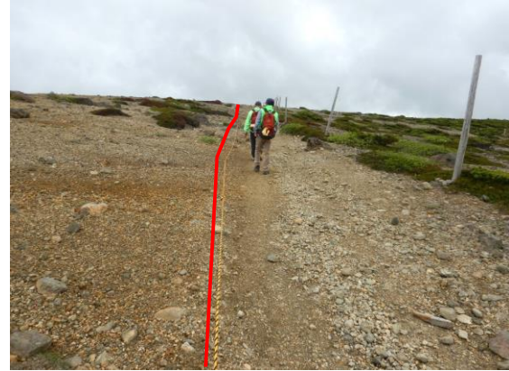
馬の背に登山ルートガイドロープが設置されていました。