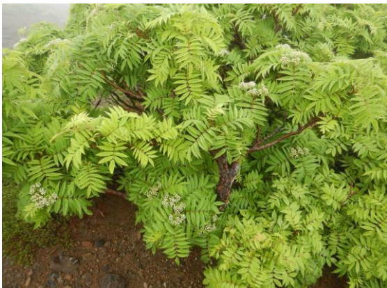
ナナカマドの若葉が綺麗です。