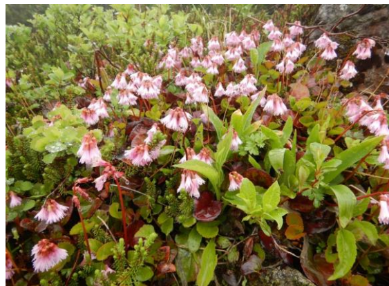
イワカガミが咲き誇っています。