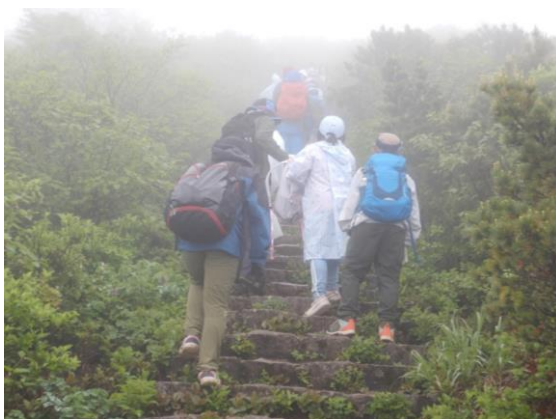
白石市内の小学生が登山体験学習に来ていました。