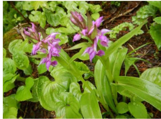
ハクサンチドリも咲きました。