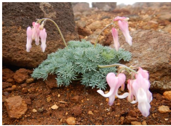
駒草平ではコマクサが咲いています。