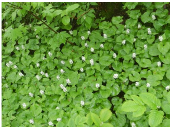
マイヅルソウの群生