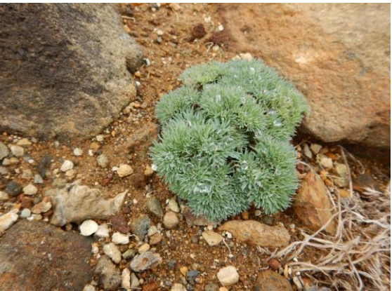
熊野岳山頂のコマクサの花はこれからです。