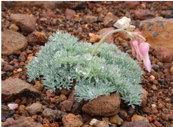
コマクサが大きくなりました。