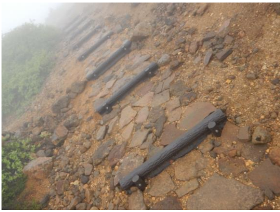
大黒天方面の道が整備されていました。