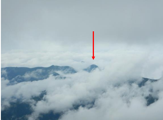
大東岳も見えました。