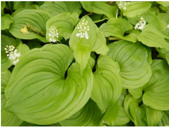
白く可愛いマイヅルソウ