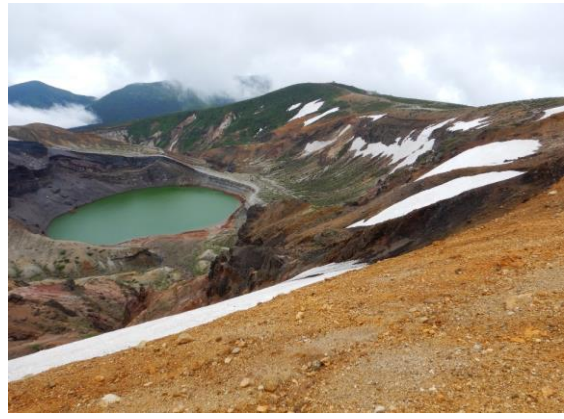
今年は残雪がほとんどありません。