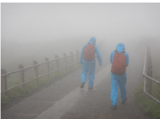
今日の刈田岳山頂は雨霧の中