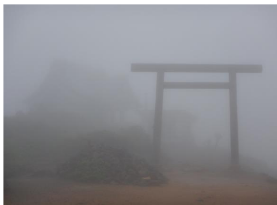
刈田嶺神社も霧の中