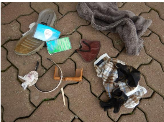
本日拾ったゴミ 落とし物も多いのでお気をつけ下さい。