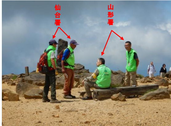
山形署のGSSと情報交換しました。