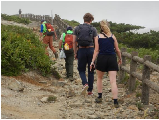
ドイツから訪れた観光客