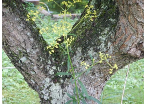
オミナエシと古木のコラボレーション