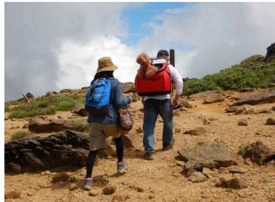
ブードルを背負って登山です。