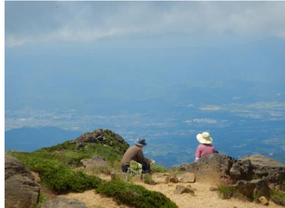
眺望を楽しみながらランチタイム！