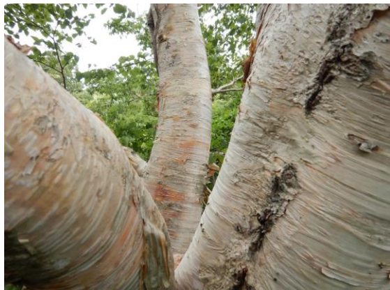
ダケカンバの美しい木肌