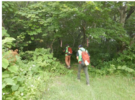
今日は蔵王古道を巡視しました。