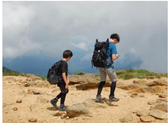
夏休みの親子連れも訪れています。