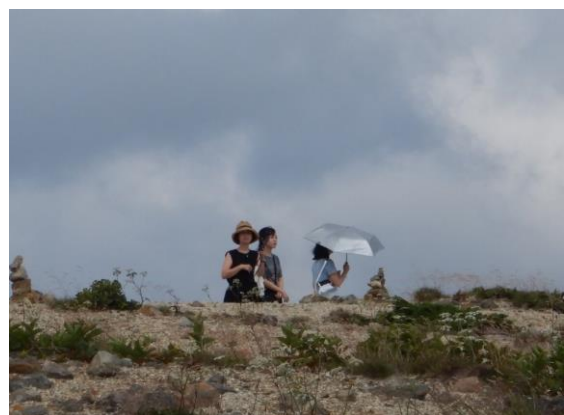
日傘に夏を感じます。