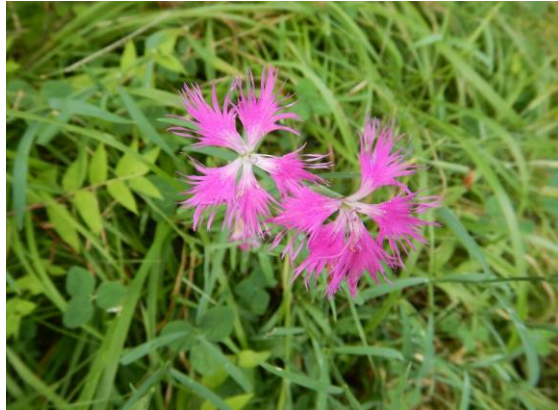
カワラナデシコが咲いています。