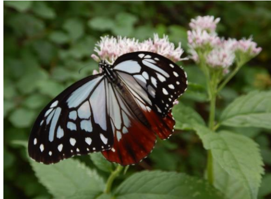
見つけました！ アサギマダラ！