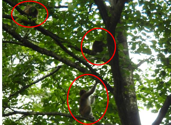
エコライン入口付近でニホンザルも見かけました。