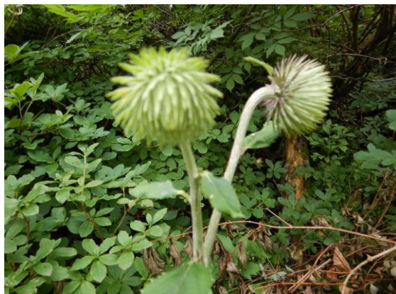
オヤマボクチはまだつぼみです。