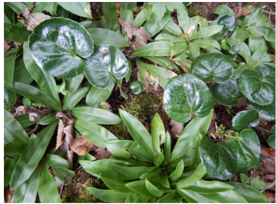
イワカガミの葉はツヤツヤ輝いています。