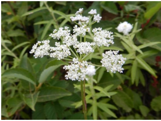
シラネニンジンも咲いています。