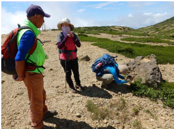
神奈川県から訪れたお二人