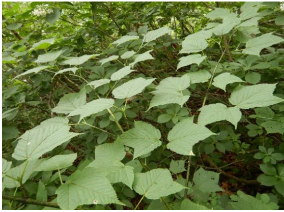
ウリハダカエデはひらひら風に揺れて