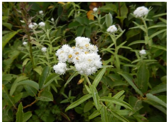
ヤマハヒキが咲いています。