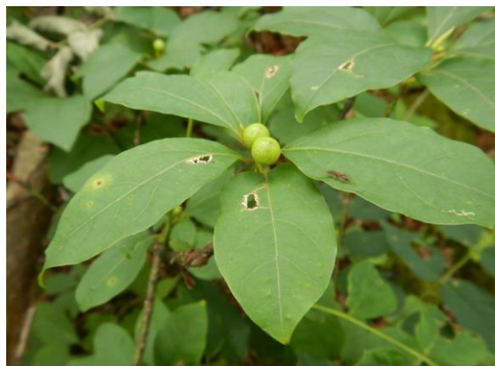
オオバクロモジは実を付けています。