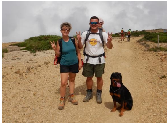
イタリアから子供とワンちゃんを連れて登山