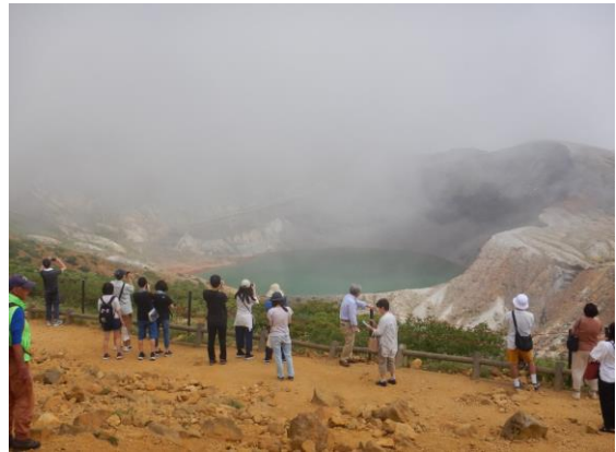
夏祭り見物に併せて訪れた観光客でにぎわっています。