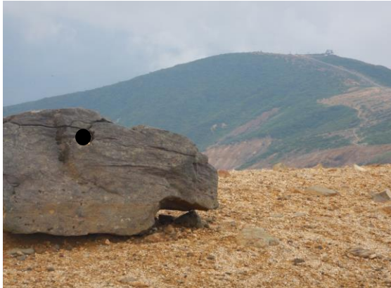
恐竜の頭に見えませんか？