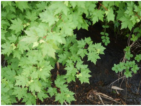
ミネカエデの葉は良い形！