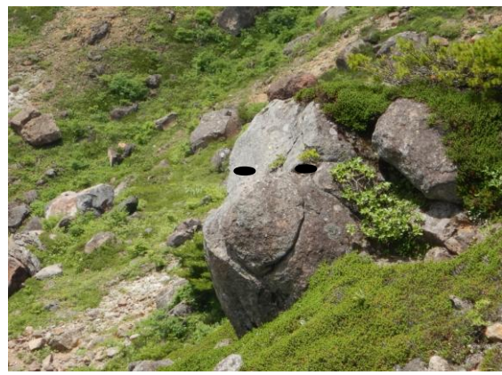
可愛い岩です。 顔に見えませんか？