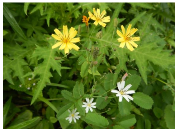
クモマニガナとシロバナクモマニガナ