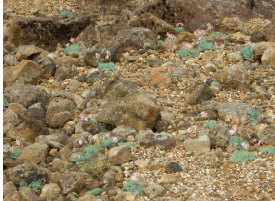
コマクサの花は終わりかけです。