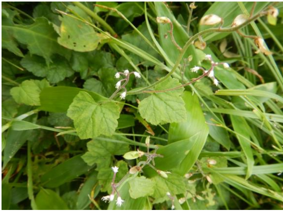
ズダヤクシュ(喘息薬種) 喘息の薬になるとか