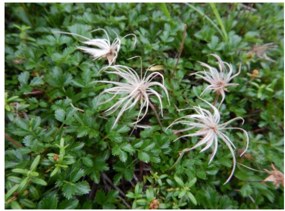
チングルマの綿毛も良い形です。