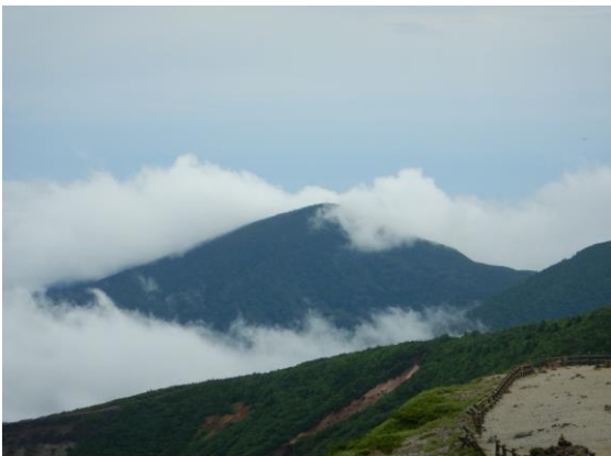
烏帽子岳と雲のコラボレーション