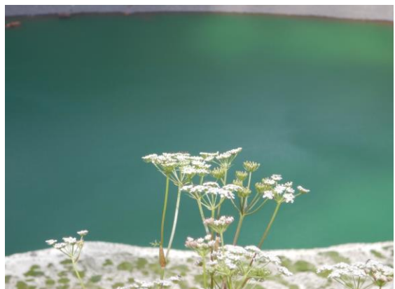
お釜の水色にシラネニンジン の爽やかな白