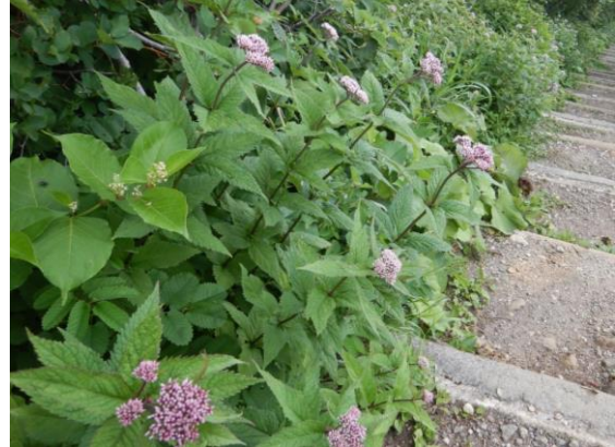
ヨツバヒヨドリ アサギマダラ(チョウ)の好む花ですが、まだ見られません。