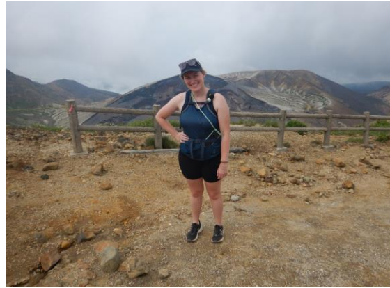
ベルギーから、東北を巡る旅の最中