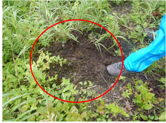
ツキノワグマがアリを食べた痕跡