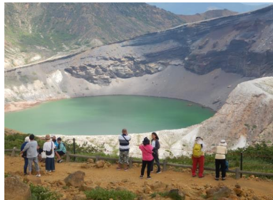
暑い中訪れた観光客