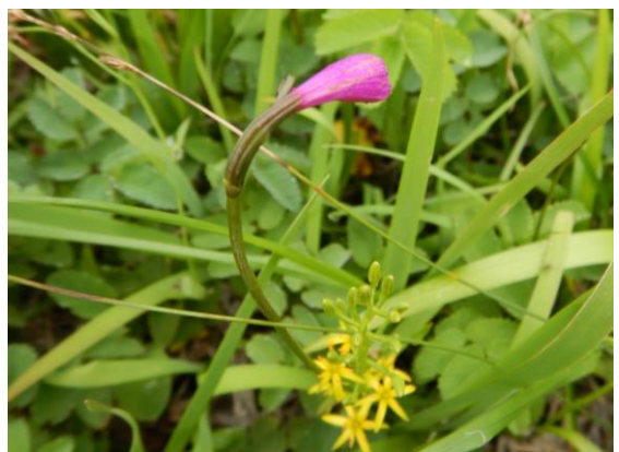
サワランが色づいています。