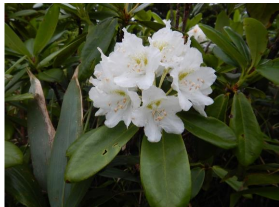
ハクサンシャクナゲが綺麗です。