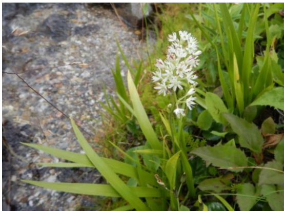
イワショウブが水辺で涼しそう。