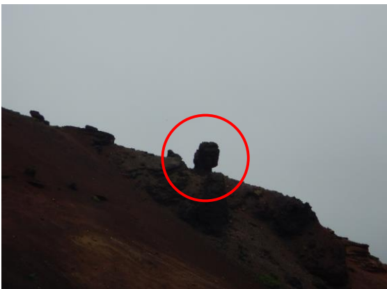
落ちそうで落ちない岩