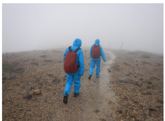
今日は雨の中の巡視でした。