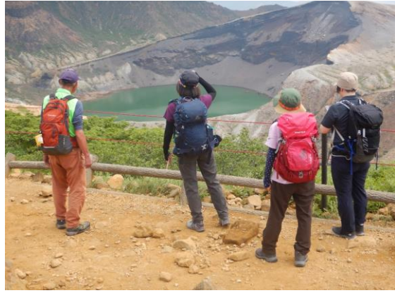
茨城県から訪れた三名を案内中