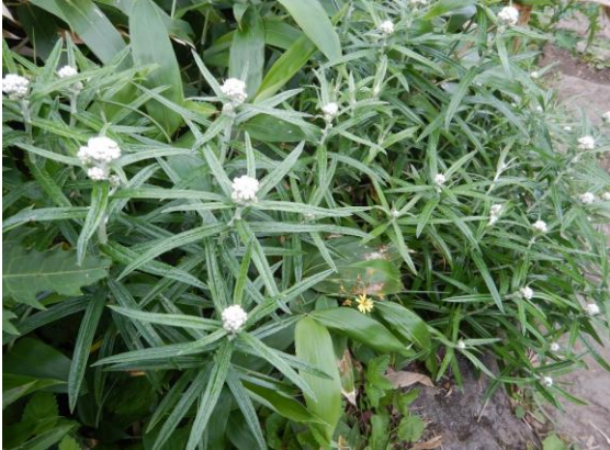
ヤマハハコの群生 ビューティフル！