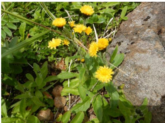
ミヤマコウゾリナの黄色い花