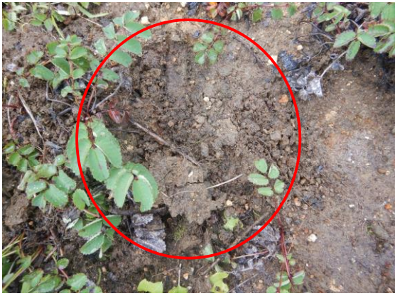
ツキノワグマの足跡です。