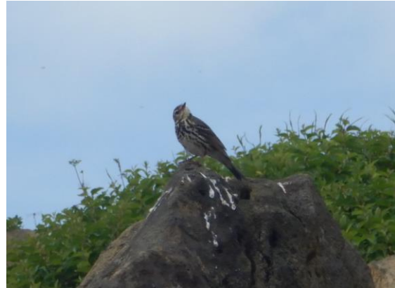
ビンズイを見つけました。