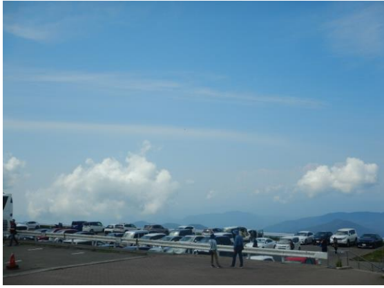
快晴につき山頂駐車場はほぼ満車です。