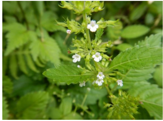
ミヤマトウバナの小さな花