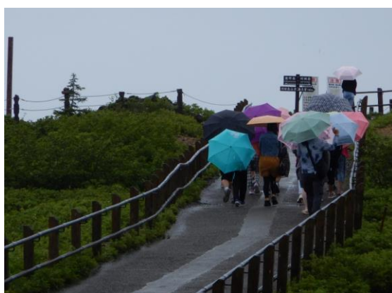
雨の中、お釜展望台へ向かう観光客