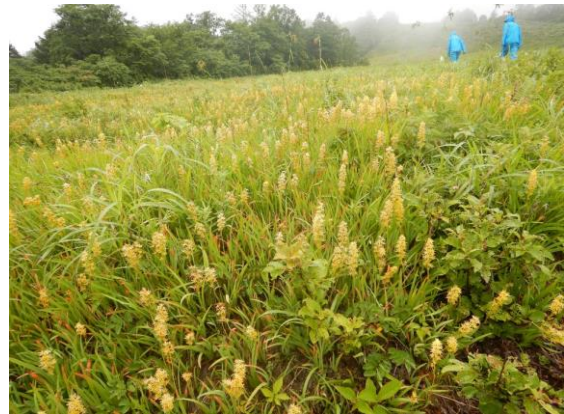
キンコウカの花畑