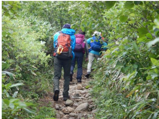
仙台市から訪れた70代のお二人を案内しました。