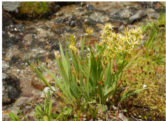
キンコウカも涼しそう。