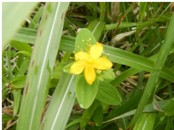
イワオトギリも咲いています。