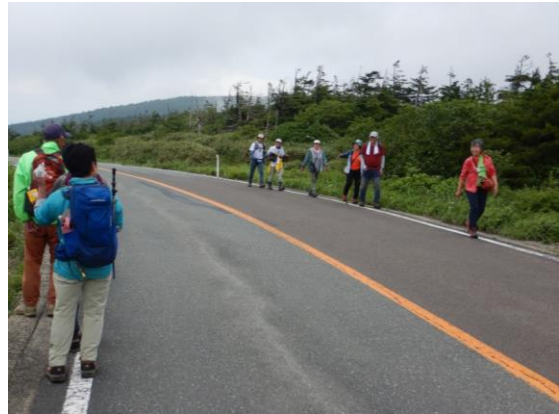
ガイドツアーの皆さんとすれ違いました。 ガイドはGSSの知人でした。