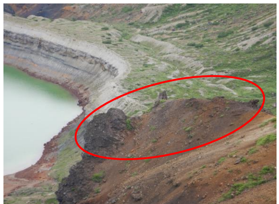
横たわるお地藏さんに見えませんか？