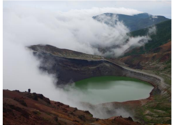
お釜と雲の素敵な関係