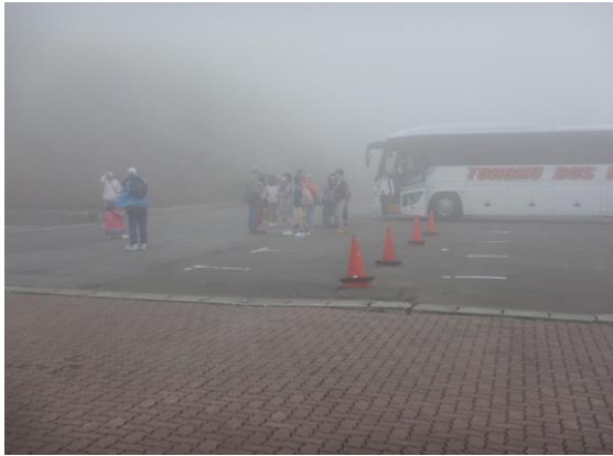
霧と強風の中、海外から観光客が訪れていました。