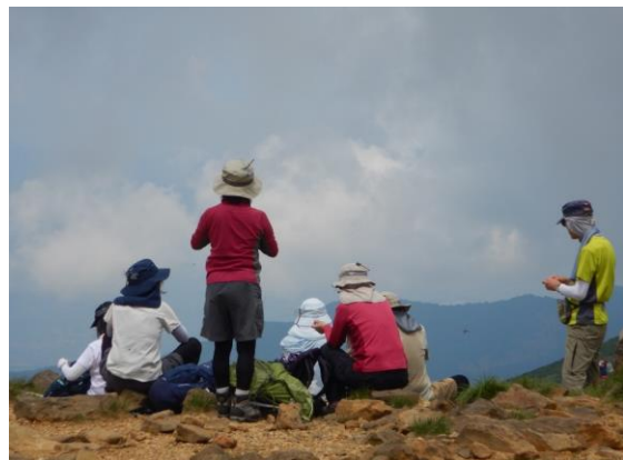
山頂でのひととき