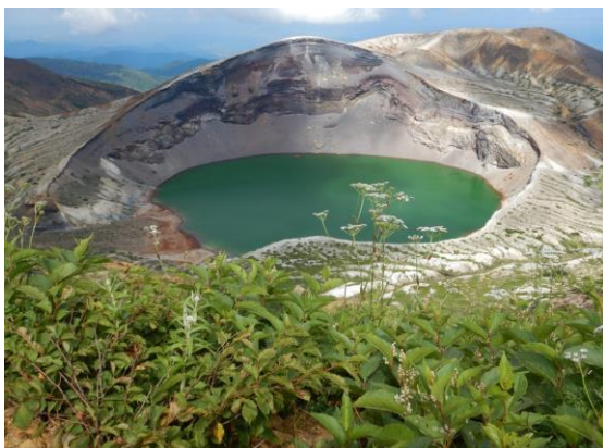
お釜とシラネニンジン