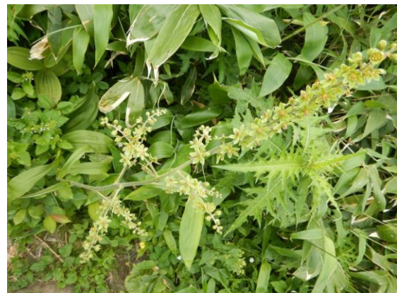
花も黄緑色のタカネアオヤギソウ