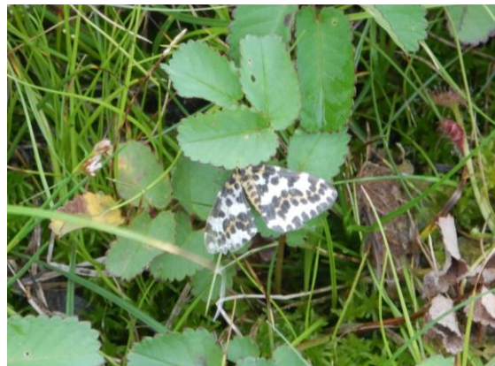
スグリシロエダシャクでしょうか？