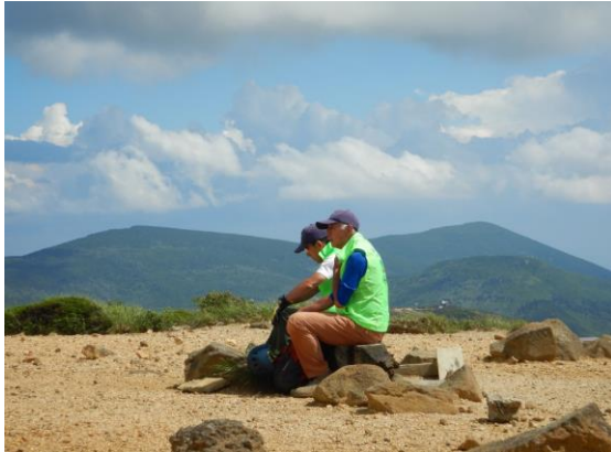
夏空の下、GSSは一休み。