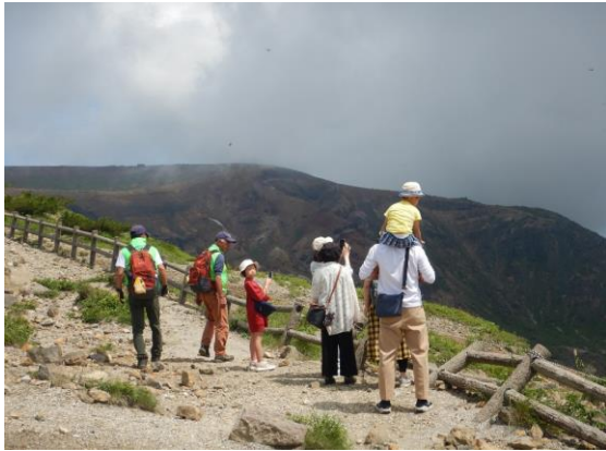
夏休みの親子連れが増えました。