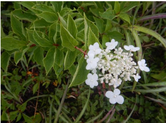
ノリウツギが咲いていました。