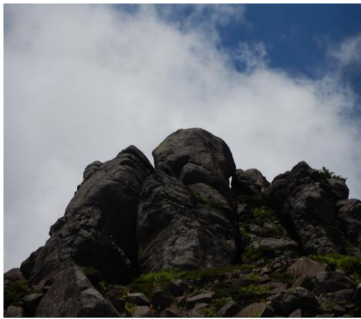
蔵王には岩場もあります。