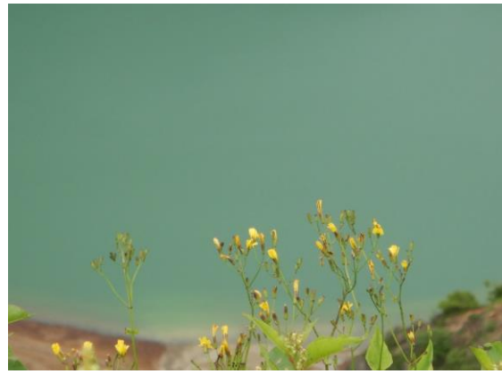
お釜の水色に映えるニガナの黄色