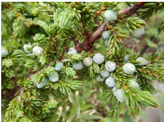
ミヤマネズが実を付けていました。