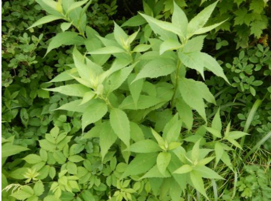
ゴマナの葉は良い香りがします。