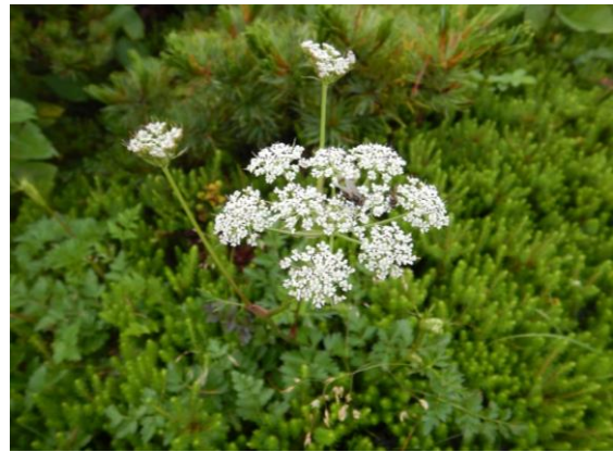
シラネニンジンも咲きました。