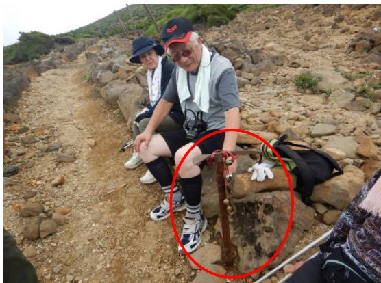
古いピッケルを持つ方