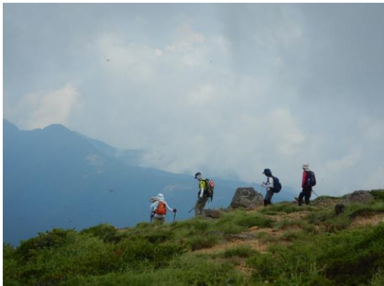
山元町の登山会の皆様