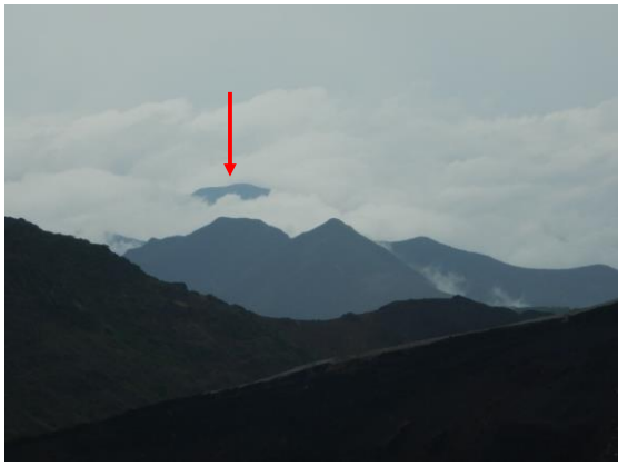
大東岳が見えました。