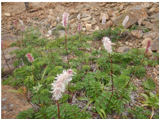
シロバナトウチソウの赤と白