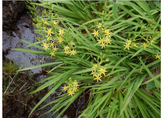
キンコウカが咲きました。