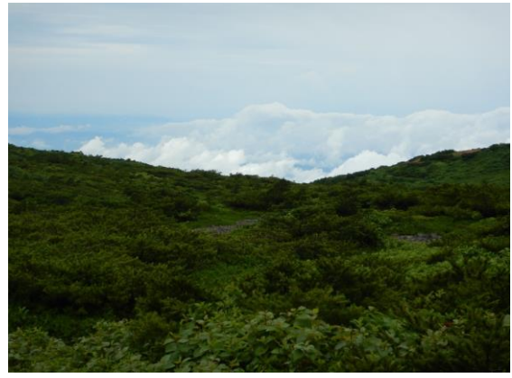
熊野岳山頂は曇り、下界は雨でした。