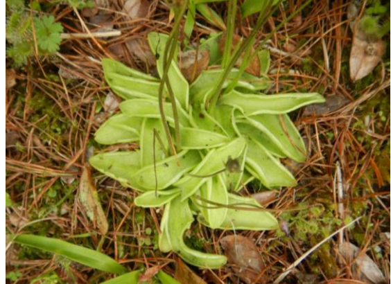
食虫植物のムシトリスミレ 花は咲き終わりました。 粘り気のある葉で虫を捕らえます。