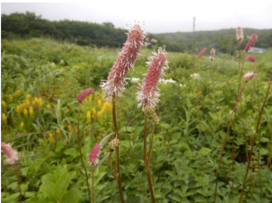
シロバナトウチソウが咲き始めました。