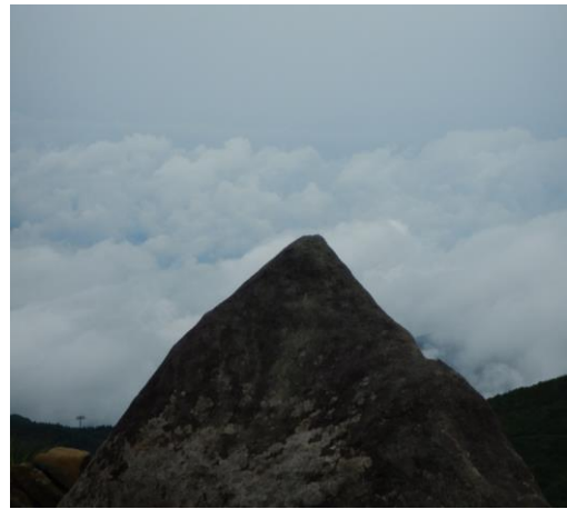
蔵王のピラミッドのような岩です。