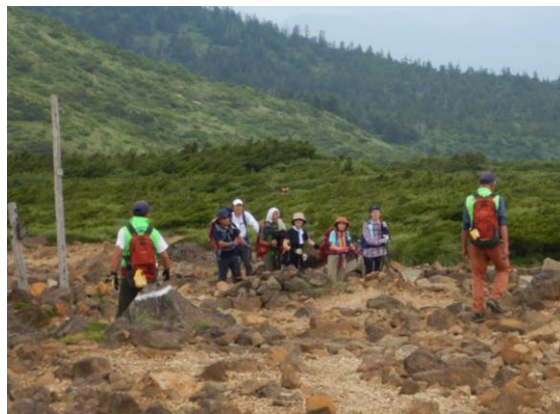
福島県から「テクテク会」の皆様