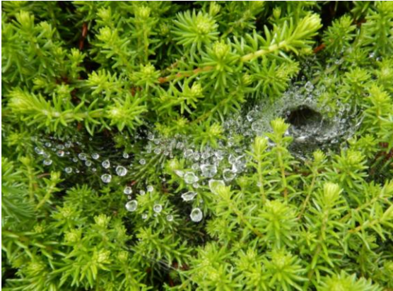
路上の宝石のようです。