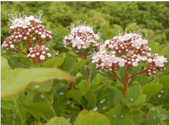
少し赤みの強いマルバシモツケ