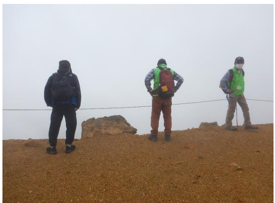
6日間の休暇で訪れた青年に会いました。