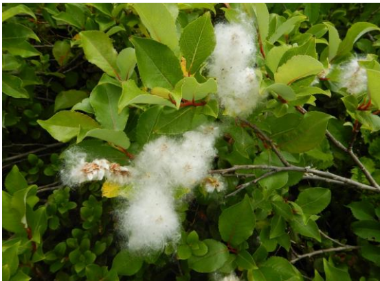
ミネヤナギの綿毛！