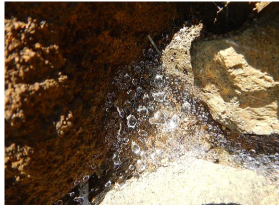
クモの糸に水滴が 美しいです。