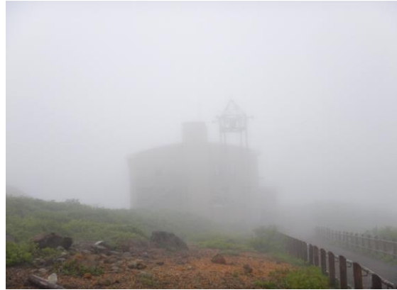
レストハウスも霧の中