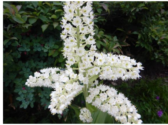
近づいてみると、自然の造形美に魅了されます。