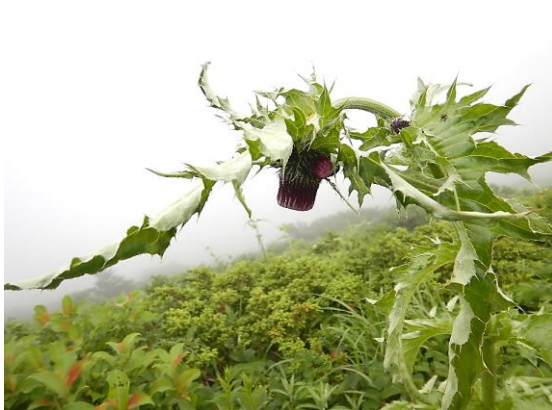
オニアザミは触れると痛いのです。