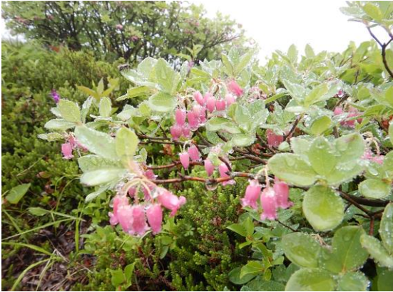
ウラジロヨウラクが雨に濡れ美しい色です。