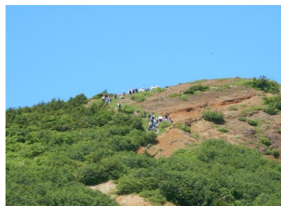
白石市の小学生が校外学習で大黒天を登っていました。