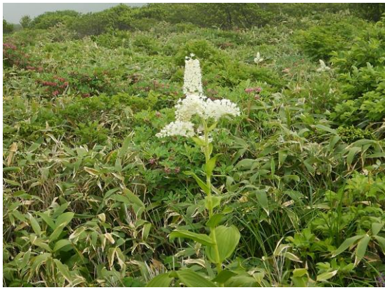
コバイケイソウの花