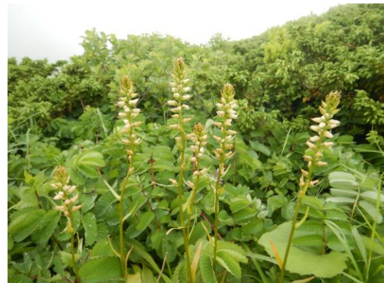
ネバリノギランも咲き始めました。