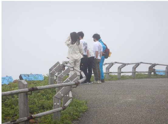
東京から来た若者たち