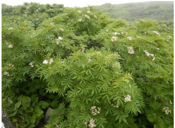
ナナカマドの白い花も咲きました。