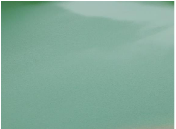
今日のお釜はこんな色