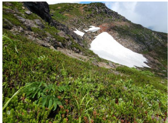
7月末まで残雪が残ります。