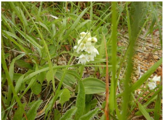
オノエランも咲きました。