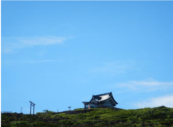
刈田嶺神社も青空に映えます。