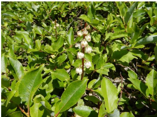
カラフトイチヤクソウの白い花