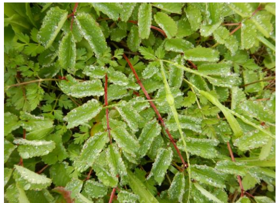
シロバナトウチソウの葉です。花はこれからです。