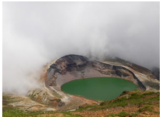
太平洋側から雲が湧き上がり、お釜を取り囲みます。