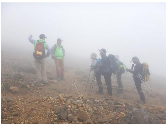
GSSの知り合いのご婦人方