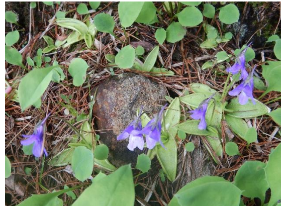
ムシトリスミレ 食虫植物です。