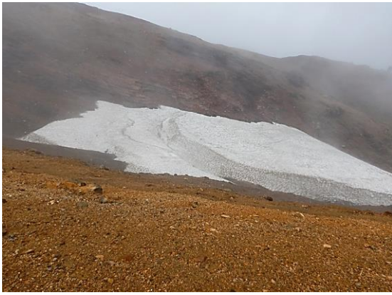
残雪、まだ見られます。