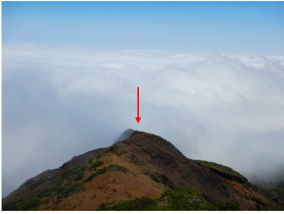
ロバの耳岩を望む