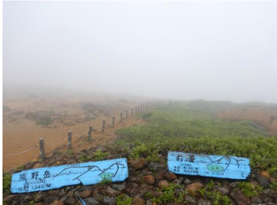
今日のお釜は霧の中でした。