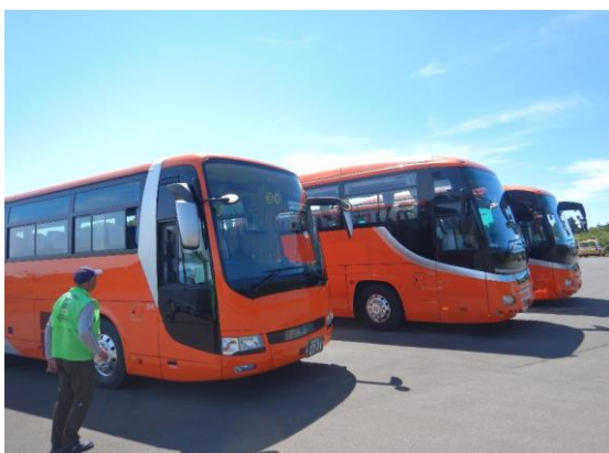
今年度初めて見る観光バスです。