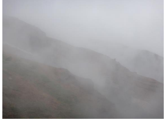
今日のお釜は霧の中