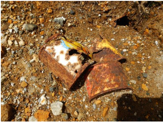
過去のゴミが地中から・・・ ゴミは持ち帰りましょう。