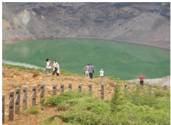
観光客も少しずつ増えてきました。