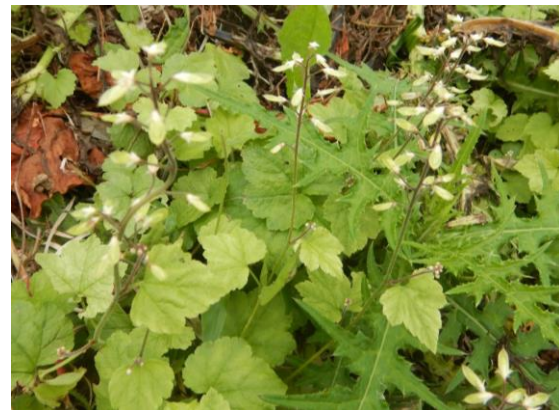
ズダヤクシュ(喘息薬種)も実を付けていました。 喘息の薬となることが名前の由来です。