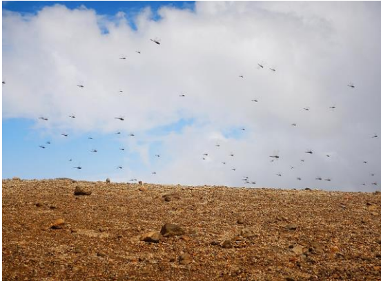
アキアカネがもう飛んでいます。