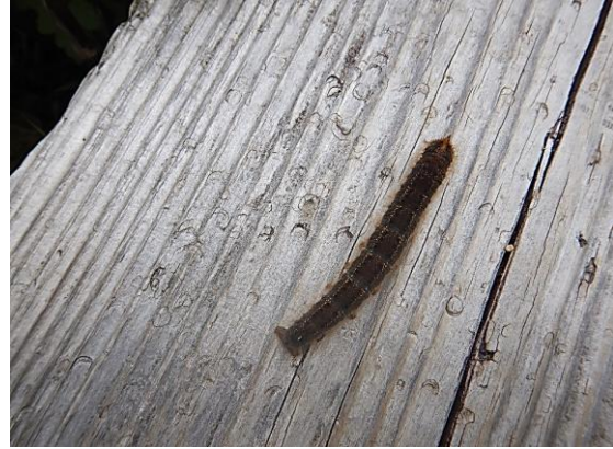
この幼虫はどのような姿に変身するのでしょうか？