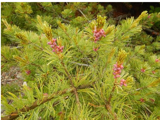
ハイマツの雄花の赤いつぼみ