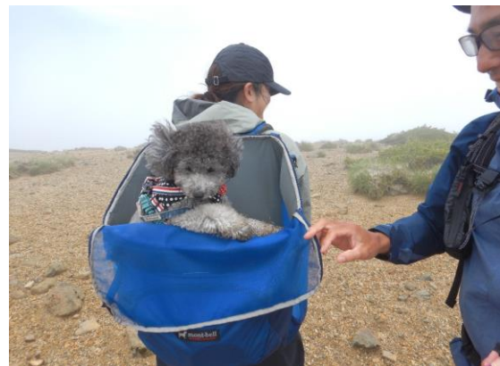
ワンちゃんは背負われてきました。