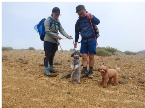
石川県からトイプードル2匹を連れて登山です。