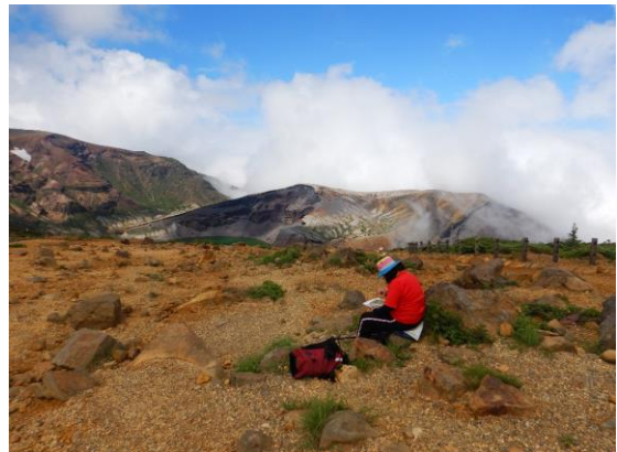
写生している方も