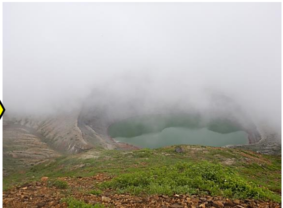
霧が風で流れた刹那、お釜が見えました。