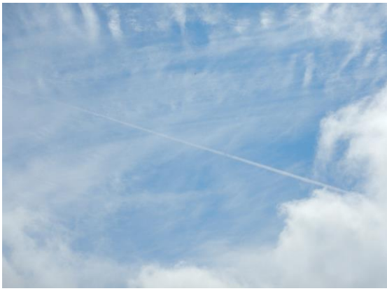
山頂では青空も垣間見えました。