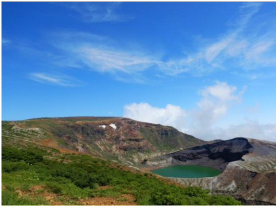
今日は快晴。もう夏ですね。