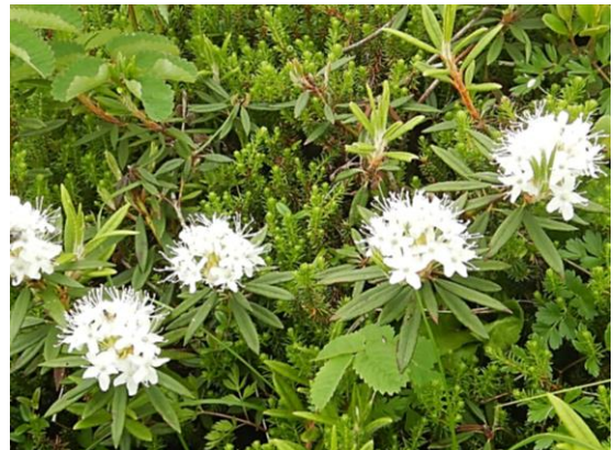
イソツツジも咲いています。