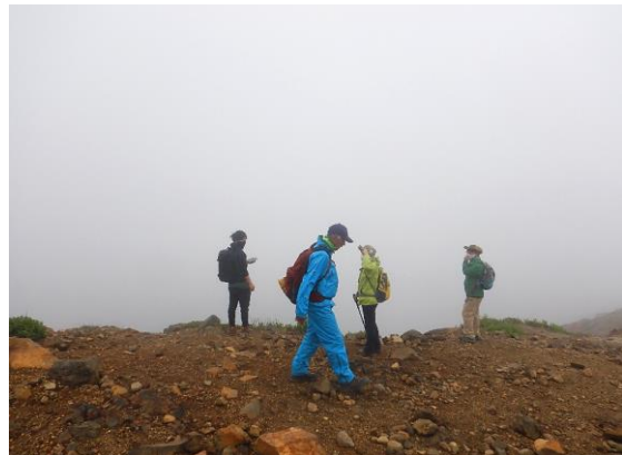
登山者も数名見られました。