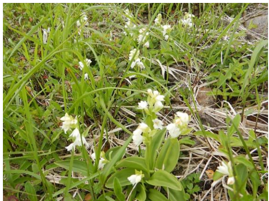
オノエランの美しい白