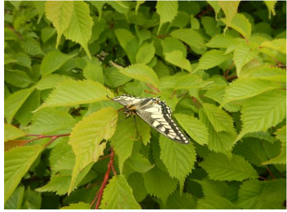
キアゲハがいました。