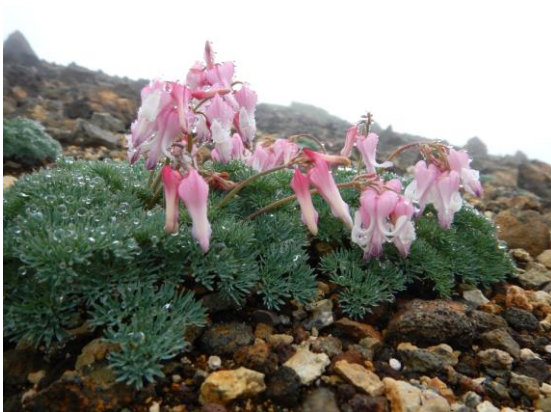
コマクサ、満開でした。