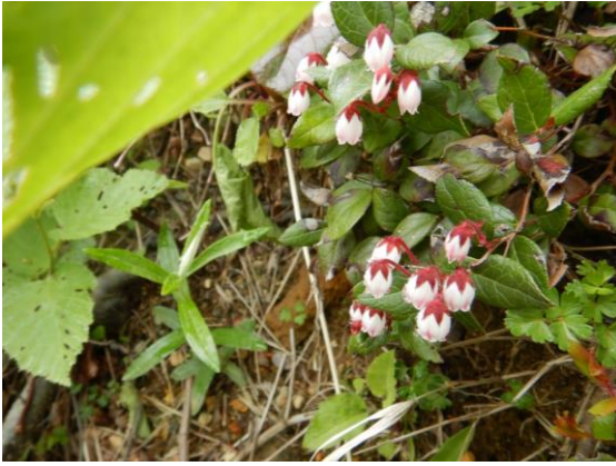
アカモノが咲き始めました。