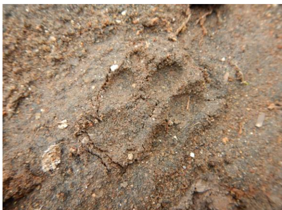
だれの足跡でしょう？