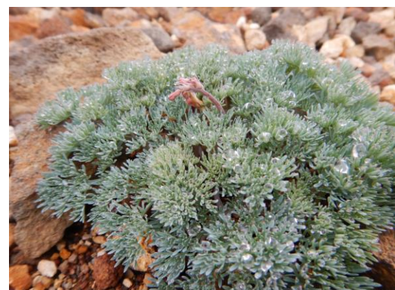
コマクサの開花はこれからです。