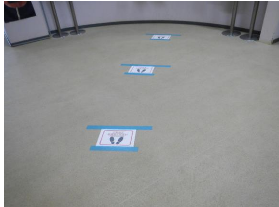
ソーシャルディスタンスを保って。