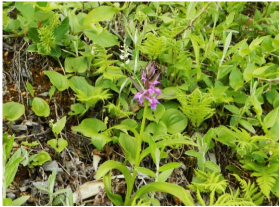
エコラインでもハクサンチドリが咲いていました。