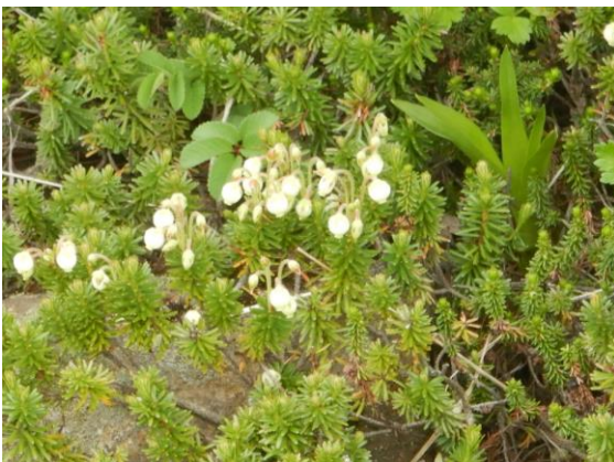
アオノツガザクラの咲きだし