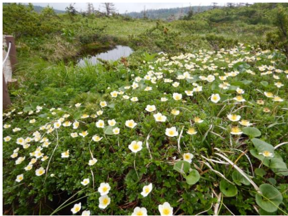
チングルマが見頃です。