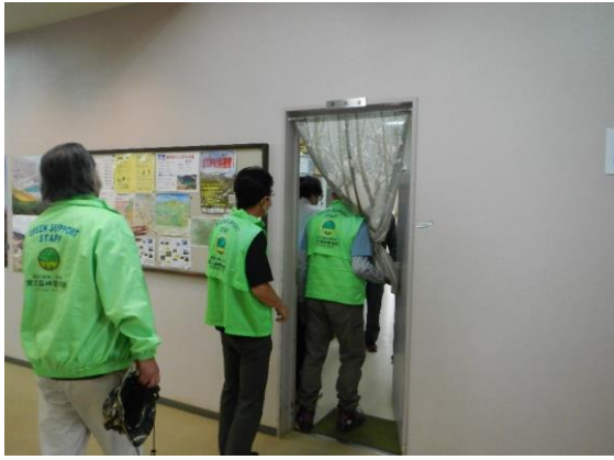
今年度もお世話になる方々にご挨拶をしました。

◆蔵王国定公園にて活動を開始します！レストハウスと馬の背で、巡視や観光客へ蔵王の自然の解説等を行いました。