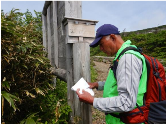
入山時には登山届を提出しましょう。