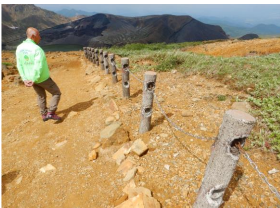
柵に新しいチェーンが付けられていました。