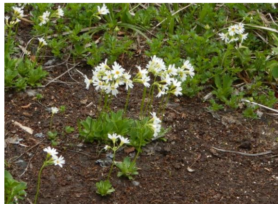
ヒナザクラ。ヒナ〇〇というのは小さく可愛らしいという意味。逆はクマ〇〇。