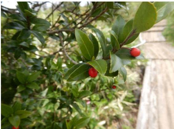
アカミノイヌツゲ