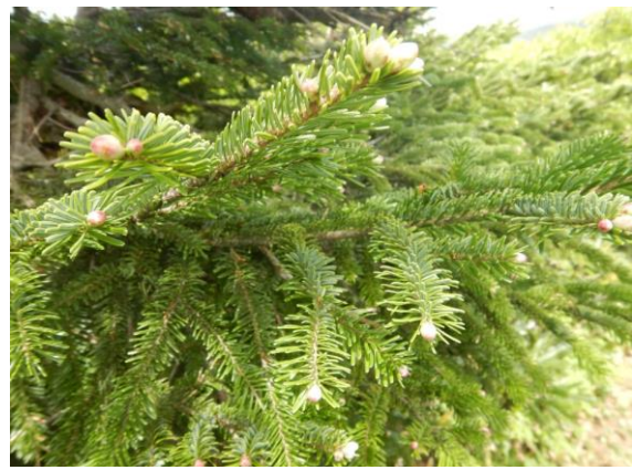
赤みがかった実のように見えるのは アオモリトマツの新芽です。