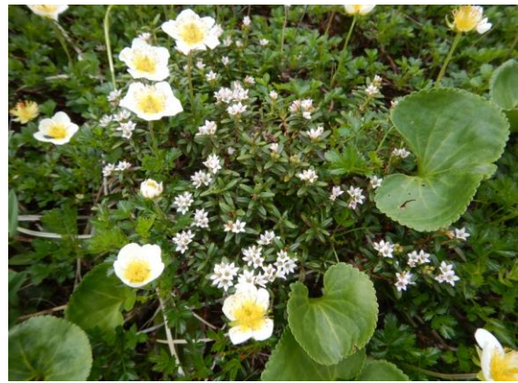
チングルマとミネズオウ