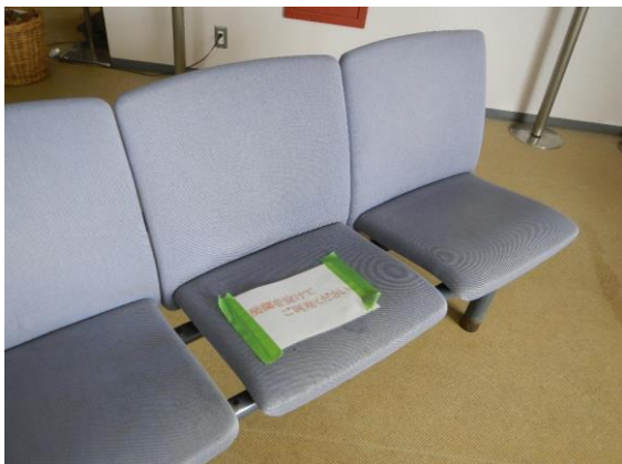
「新しい生活様式」に則って配慮されていました。