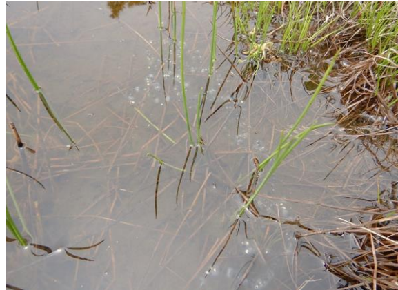
こちらも見づらいますが…水泡のように光っているのは卵です。