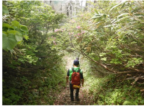
パトロールに出発！