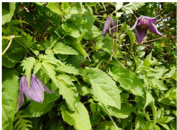
ミヤマハンショウヅルも咲いています。