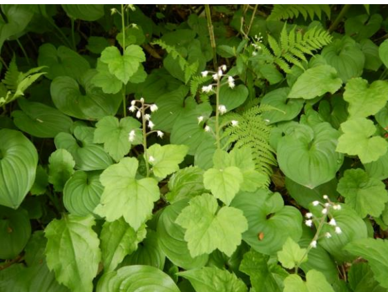
ズダヤクシュが咲き始めました。