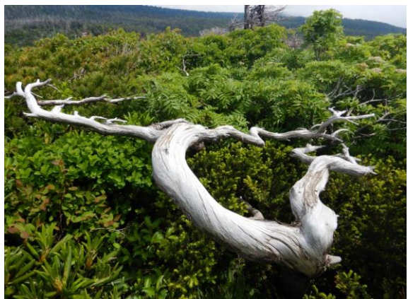
アートのような古木