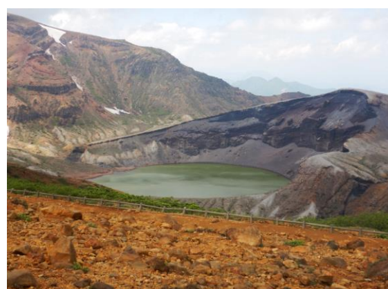
今日のお釜。少しくすんだ色に見えました。