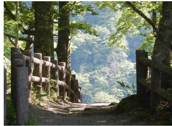
滝見台の木漏れ日