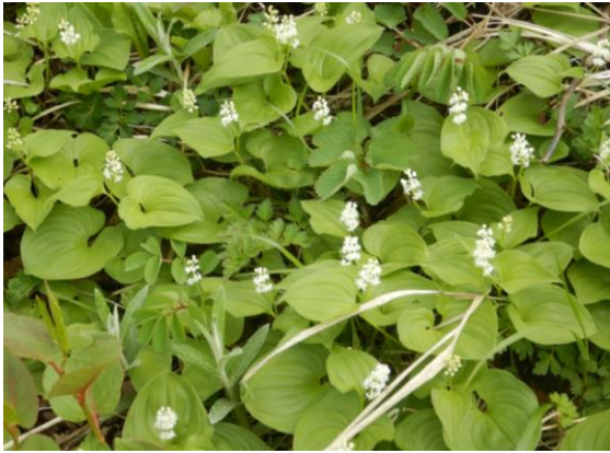
マイヅルソウは可憐な白