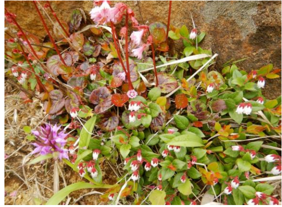
アカモノ、イワカガミ、ハクサンチドリのトリプルコラボ