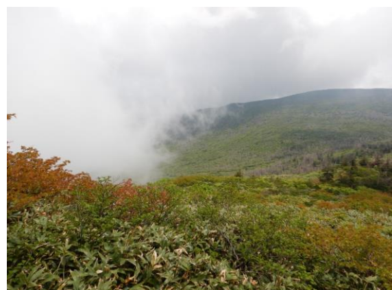
好天に恵まれましたが、時折、霧がかかりました。