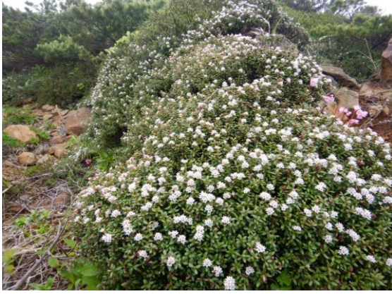
ミネズオウの群生！すばらしい!!