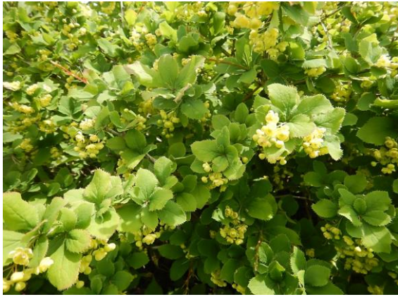
ヒロハヘビノボラズ