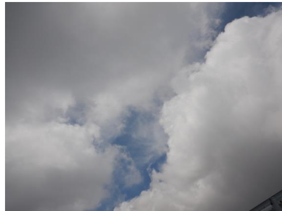
上空は晴れ！でも強風でした。