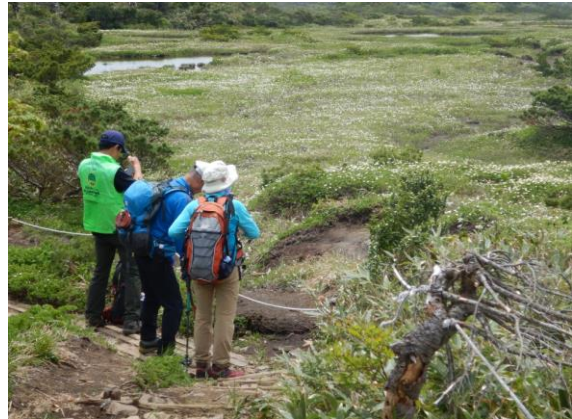
芝草平で出会った山形からのご夫婦