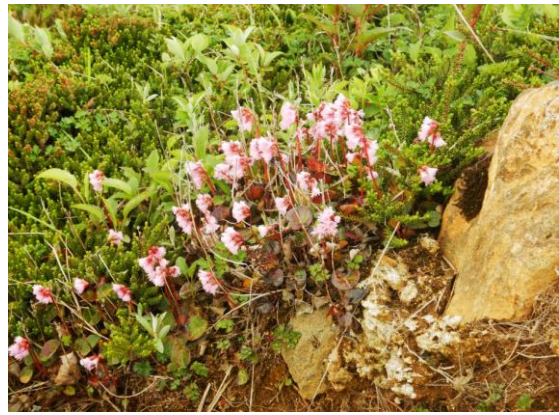
ピンクが鮮やかなイワカガミ