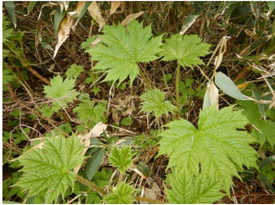
ハリブキ(針蓆)、葉裏に鋭いトゲがあります。