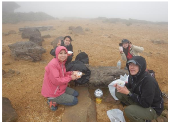
熊野山頂にてランチ(寒い!)。温かいものが嬉しい。