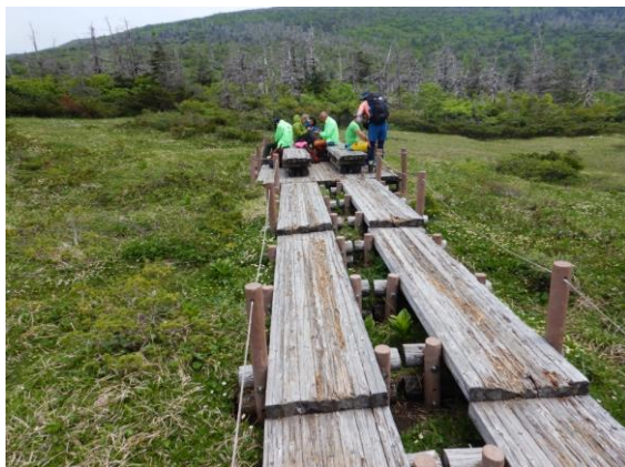
楽しいランチタイム♪