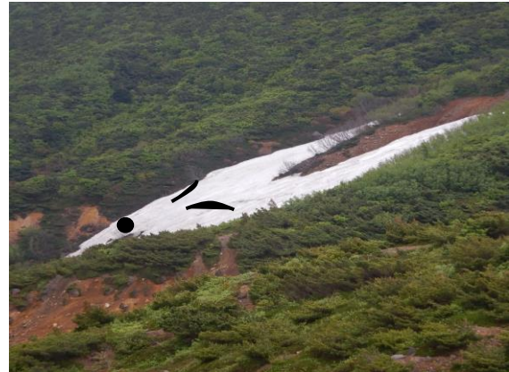
毎年みられる残雪キツネ