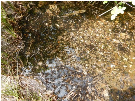
水が反射して見づらいますが、オタマジャクシがいっぱい。