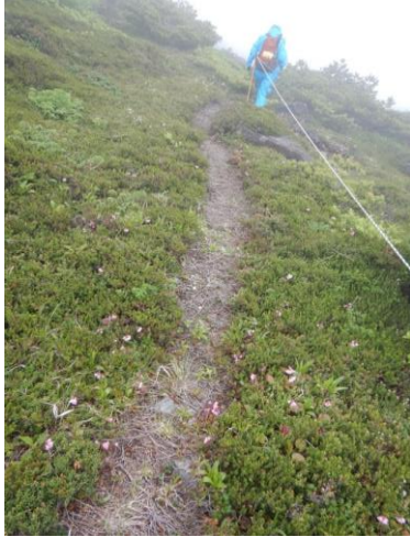
踏圧による植物の衰退。利用と保護のバランスは…。