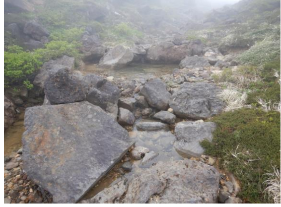
雪が融け、沢となる。