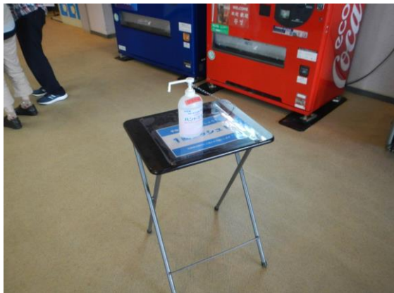
消毒液が設置されています。