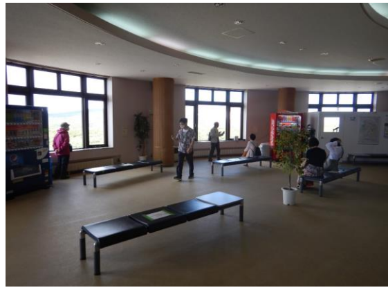
レストハウス内に人はいましたが、「密」ではありませんでした。