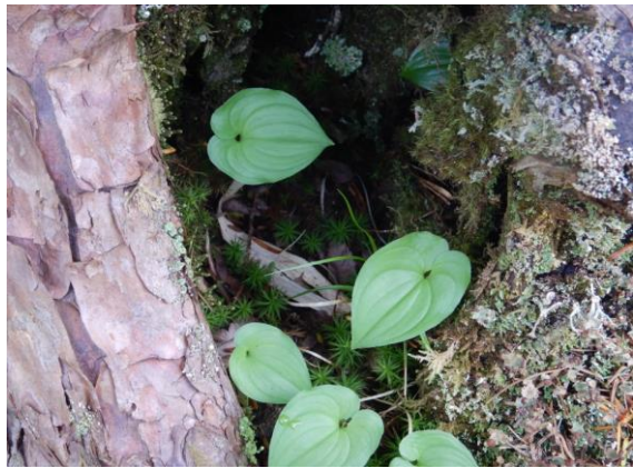
木の洞(うろ)にマイヅルソウ等の植物が見られます。