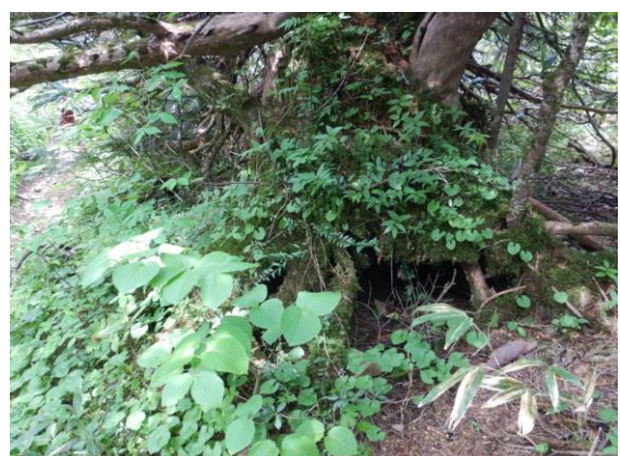
木の洞(うろ)。時には動物の住処になったり…。