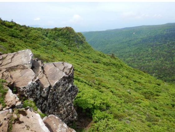
眺望も登山の楽しみの一つ