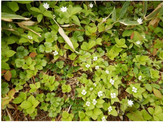
今年は南縦走路にゴゼンタチバナが多く咲いています。 花びらが鋭角なのはツマトリソウです。