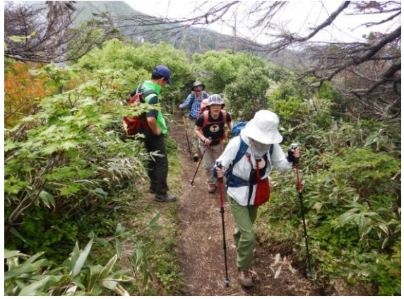
今日は女性グループが多いようでした。