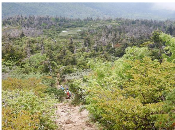
奥に見えるのは芝草平の湿原。芝草平までもうすぐです。