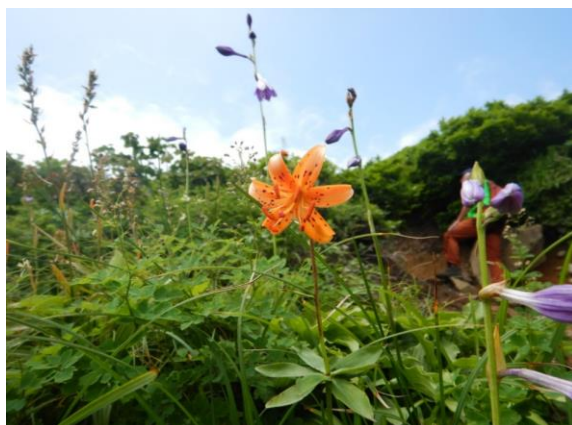
クルマユリが見頃です。