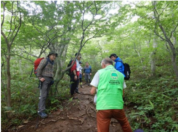
仙台の会社のグループとご一緒しました。