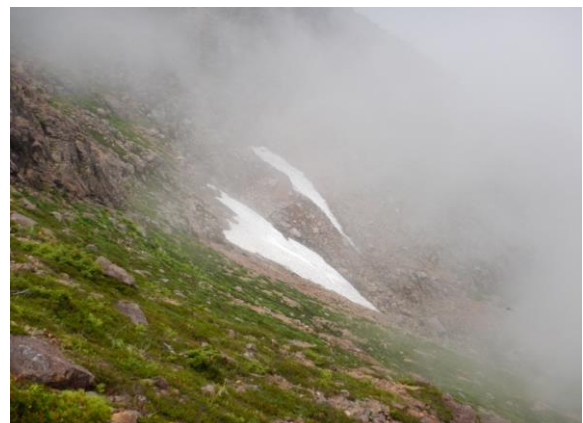
梅雨明け後、平地は連日の猛暑ですが、まだ残雪あります。