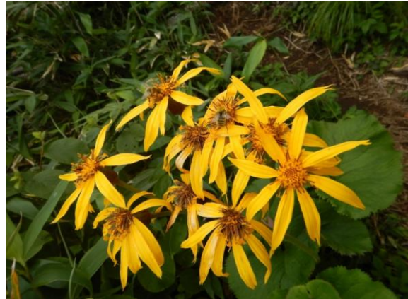
マルバダケブキ。蜂が花に訪れています。