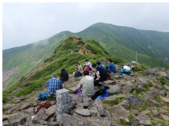
この日の不忘山頂は大勢の人で賑わっていました。