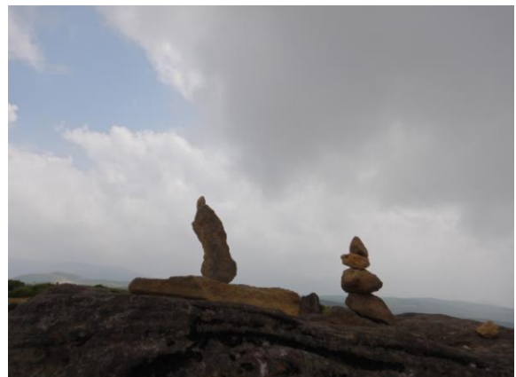
山頂美術館出現？絶妙なバランスです。