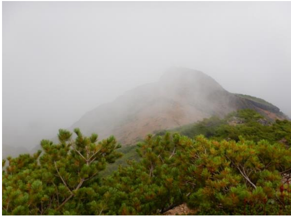
霧の中のロバの耳岩