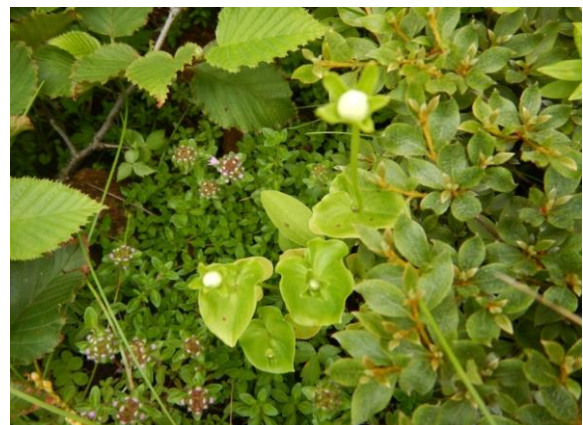
ウメバチソウの蕾。円心形の葉から花茎が伸びているのもおもしろい。