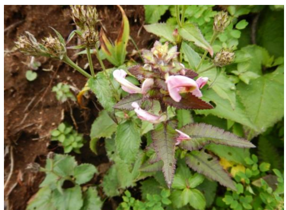
トモエシオガマ。少し分かりにくいですが、花が巴形のことから。