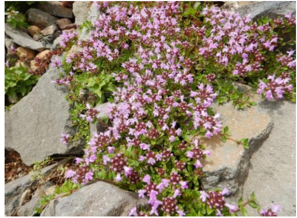
イブキジャコウソウの名前のとおり香りがありますが草ではなく低木です。