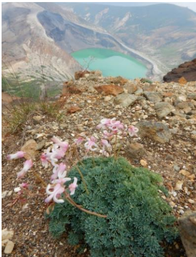
コマクサ、まだ咲いています。