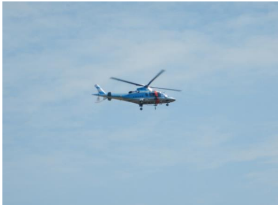
宮城県警が空と地上で遭難者の捜索を行っていました。身近な山であっても、装備や計画は万全に！