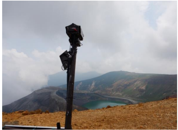
お釜の定点カメラ。厳しい気候の中でも常時観測中です。