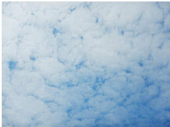
山頂はもう秋空です。