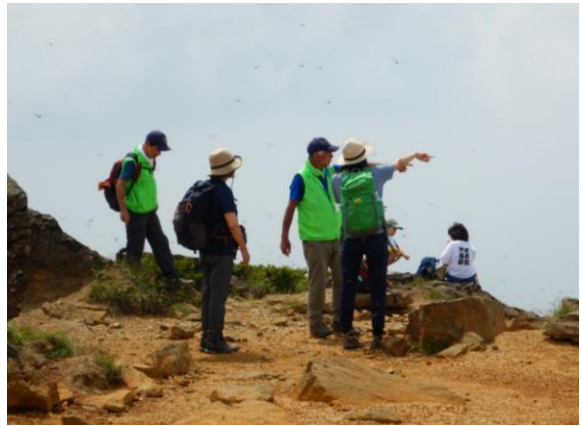
ガイド中。トンボがたくさん飛んでいます。