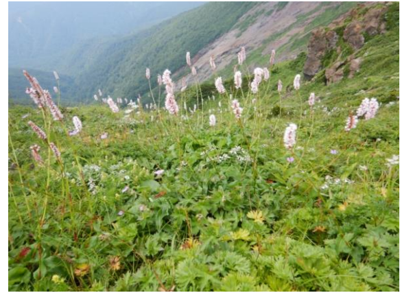
イブキトラノオ他のお花畑、何種類咲いているでしょう？