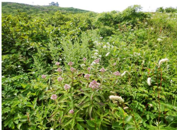
ヨツバヒヨドリ(ピンク)とシロバナトウチソウ(白)