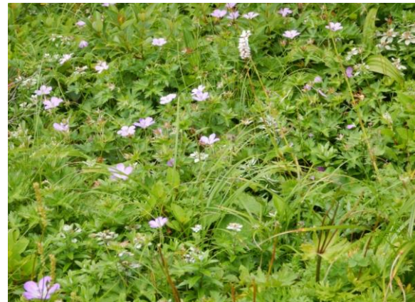
またお花畑です。6種類くらい咲いていると思います(分かりますか?)。