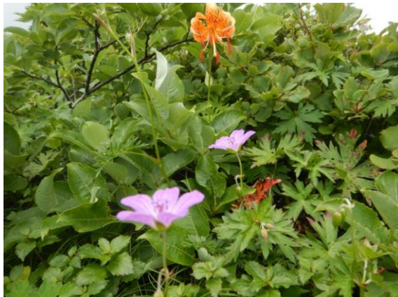
ハクサンフウロとクルマユリ