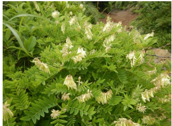
イワオウギ。マメ科の植物。岩場に生え、生薬にする黄耆(おうぎ)に似ていることから。