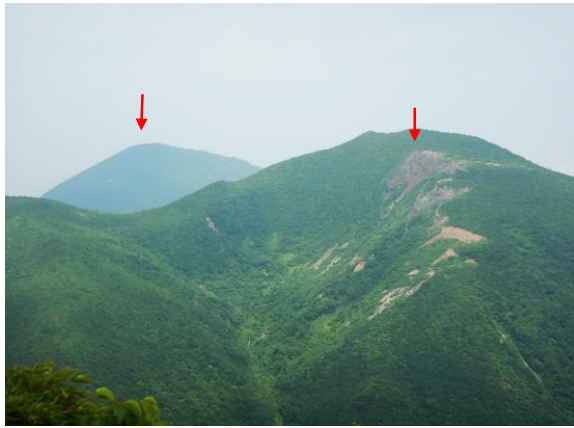
向かって左、後鳥帽子岳と、手前右側は水引入道です。