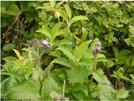
フボウトウヒレン、不忘の名を冠する。