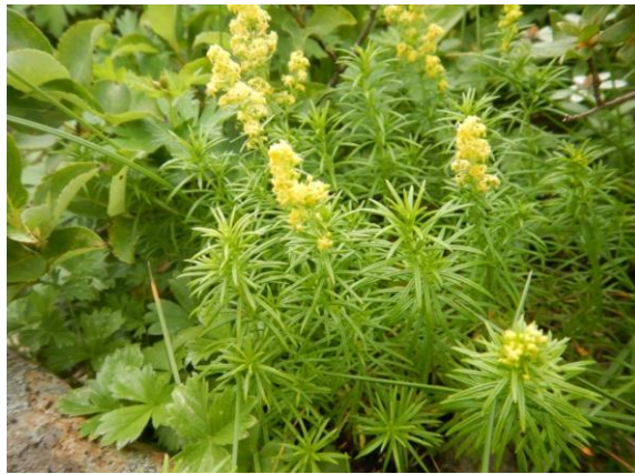
キバナノカワラマツバ