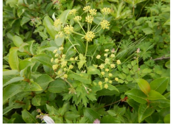
左ハクサンサイコ、右ホタルサイコ。並べると違いが分かりますが、とても似ています。 柴胡(さいこ)も生薬の名前に由来しますが、この2種は生薬にはならないそうです。