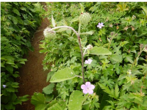
オヤマボクチとハクサンフウロ