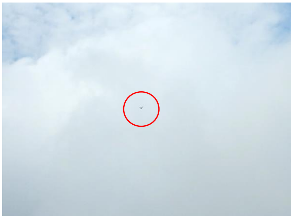
アサギマダラです！今年は出会いが少なくシャッターチャンスも少なかった…(泣)