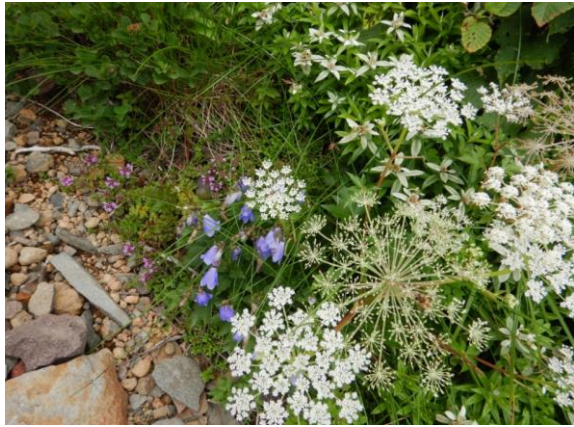
イブキジャコウソウ、ヒメシャジン、ミヤマトウキにウスユキソウ。いろいろな花が咲いています。