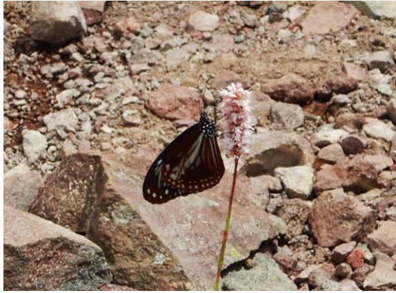
今年初のアサギマダラ。やっと会えました！