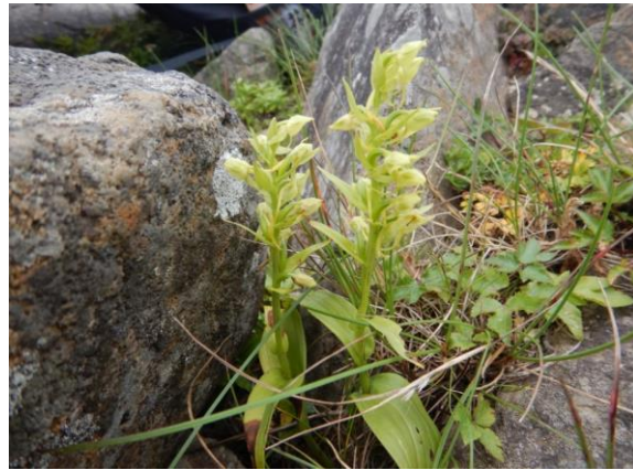
タカネサギソウ。ラン科はサギ、チドリ、トンボ等、花の形を色々なものに見立てた名前が多い。