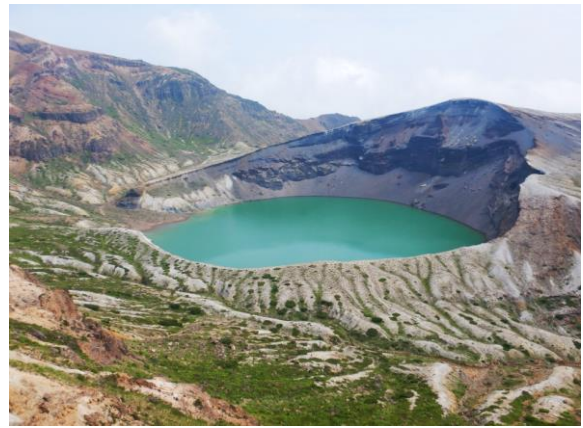
今日のお釜は淡いブルー