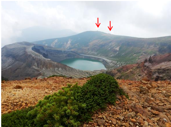
刈田嶺神社とレストハウスが見えます。