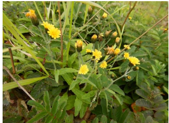
ミヤマコウゾリナ