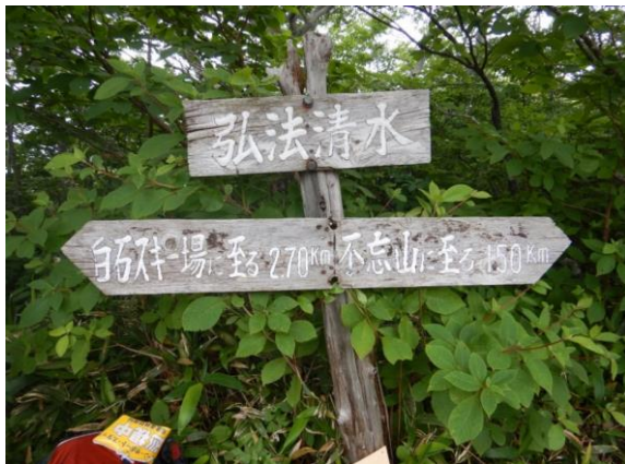
弘法清水で見られたカキツバタの群生