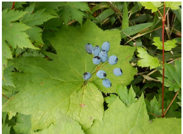
サンカヨウの実、おいしそうに見えます(^_^)