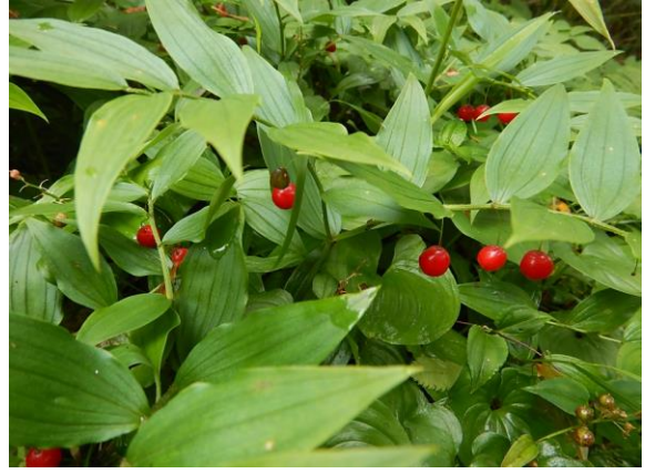
タケシマランの実、例年より大きいです。