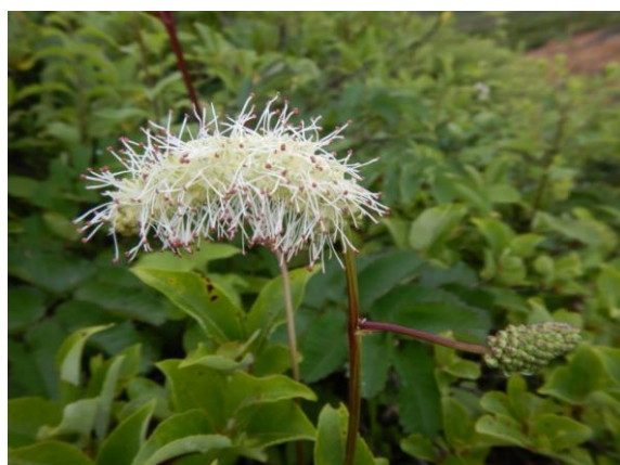
シロバナトウチソウも咲いています。