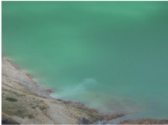
お釜、色が今年最高！でした。