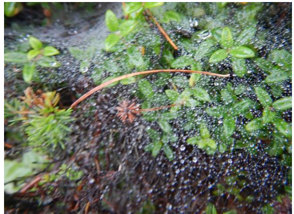
クモの巣に水滴が美しい。