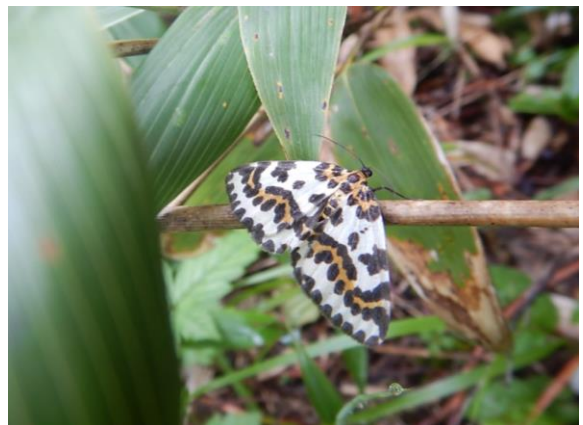
名前不明ですが可愛い蝶(蛾?)