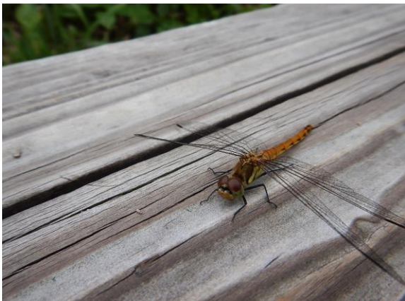
アキアカネも飛び始めました。