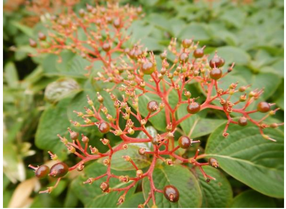
クマノミズキの実。珊瑚のよう。