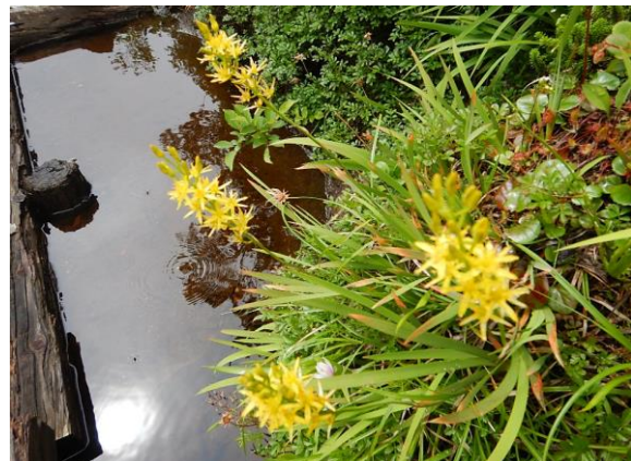
キンコウカも昨年よりまばらです。