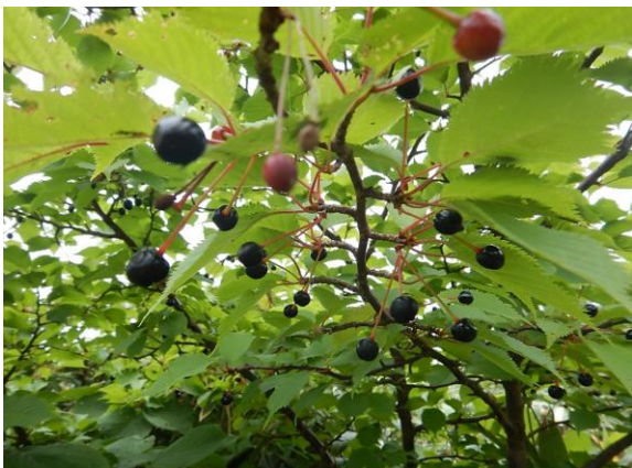
ミネザクラのさくらんぼ