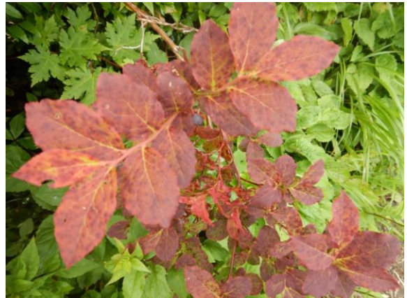
こちらのクロウスゴはすっかり紅葉しています。