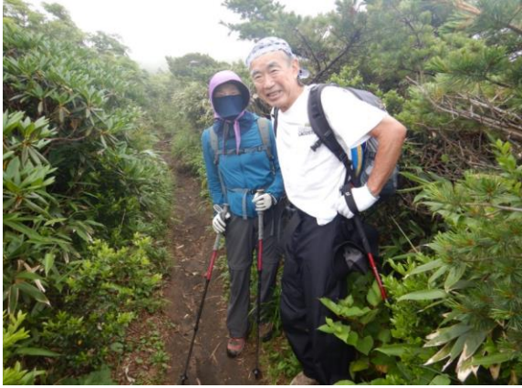
郡山市からのお二人は、今年27の山に登られたそうです。健脚！