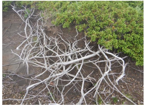
白い根が複雑な形を作り、とてもアーティスティック。