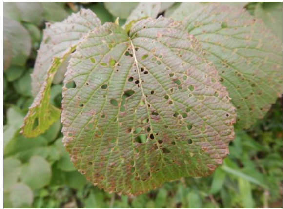
虫食いの痕も、よく見るとおもしろい。