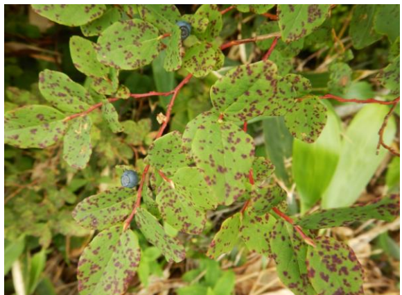
クロウスゴ。ブルーベリーの仲間です。