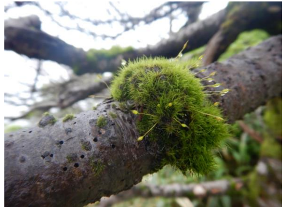
苔。飛び出ているのは孢子体と思われます。