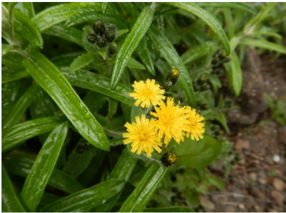
ミヤマコウゾリナ