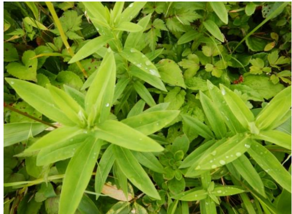
エゾオヤマリンドウの蕾