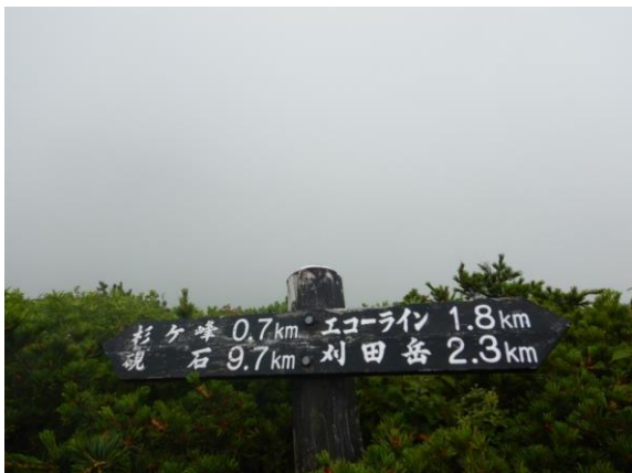
残念ながら、霧で何も見えません…。