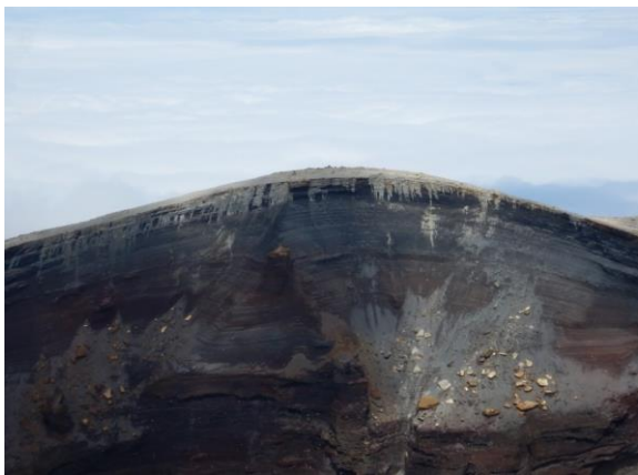
先日の大雨で流れた跡のようです。