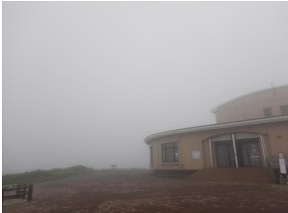
レストハウスは霧の中