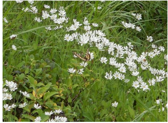
アゲハがやってきました。