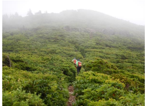
前山を目指して歩く。