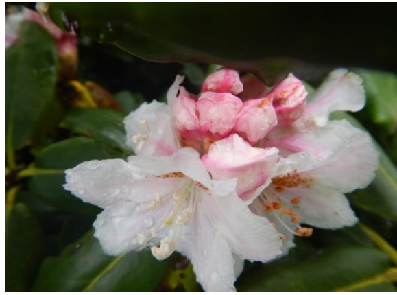
ハクサンシャクナゲ