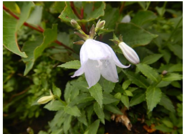
淡い色のミヤマシャジン