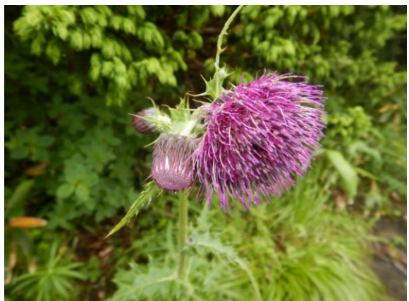
大きなオニアザミの花