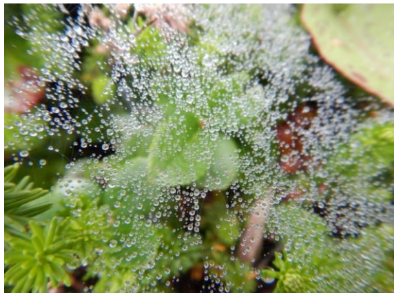
宝石のようなクモの巣の水滴