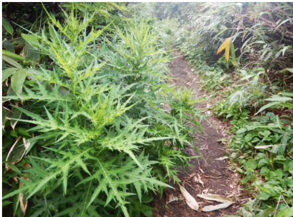
オニアザミは痛い！です、気を付けましょう。