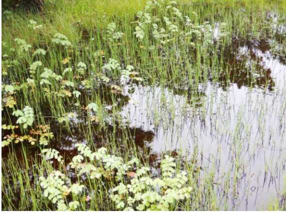
高層湿原は高山の冷涼な環境によって形作られます。