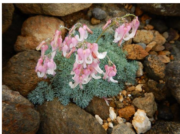
コマクサがまだ頑張って咲いていました。