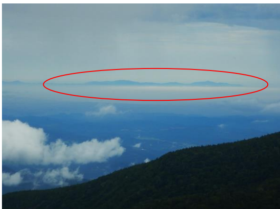
牡鹿半島が見えました。