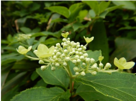
ナリウツギ、アジサイと同じユキノシタ科です。