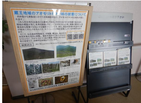
パンフレットを追加しました。日・英・中3カ国語揃っています。 アオモリドマツの枯損について記載されています。