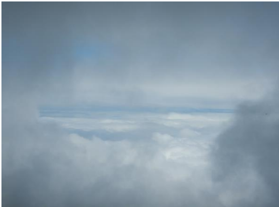
上空に一部青空が見えるも山頂は霧の中、まるで雲の中にいるよう。