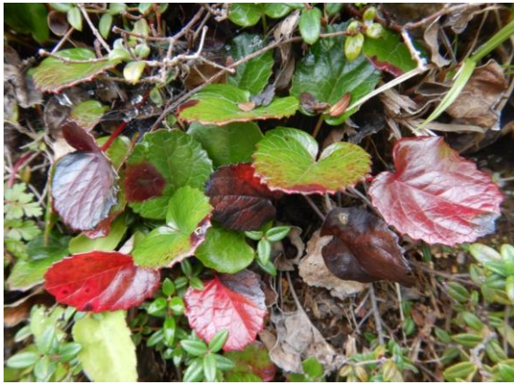
ツートンカラーのイワカガミ