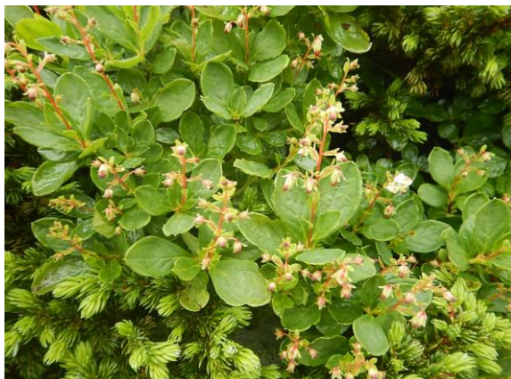
ミヤマホツツジ。ほとんどの花は開く直前です。