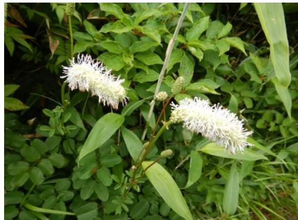
シロバナトウウチソウ