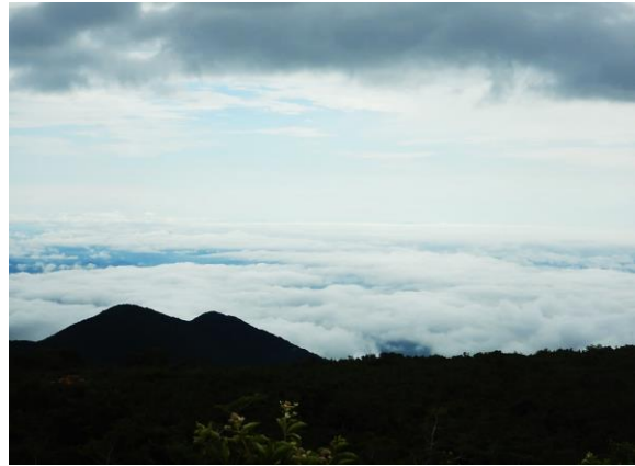
写真に収めきれない雄大な雲海！