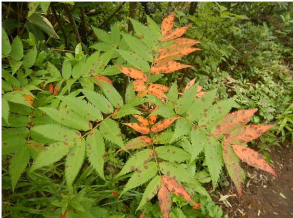
ツートンカラーのナナカマド、黄葉し始めています。