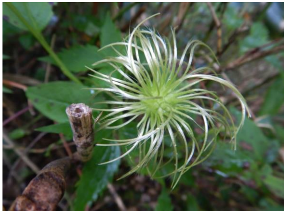
ミヤマハンショウヅルの花の後