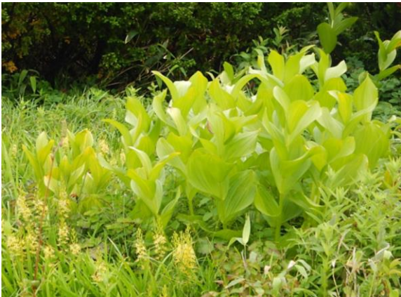
コバイケイソウ、今年は花芽が少なかったようです。