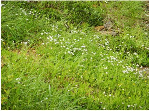
シロバナクモマニガナのお花畑