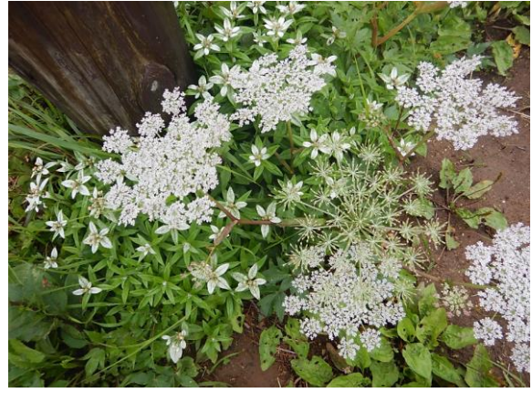
ミヤマトウキと、下にはウスユキソウが咲いています。