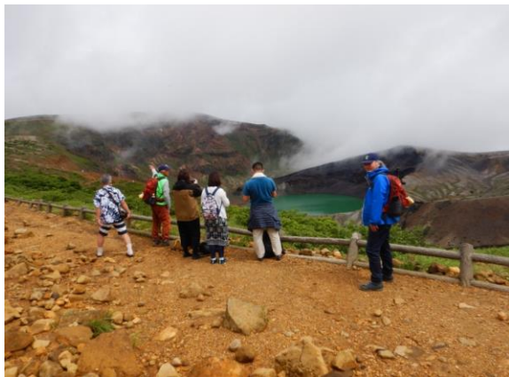
観光に来た方々へガイド中