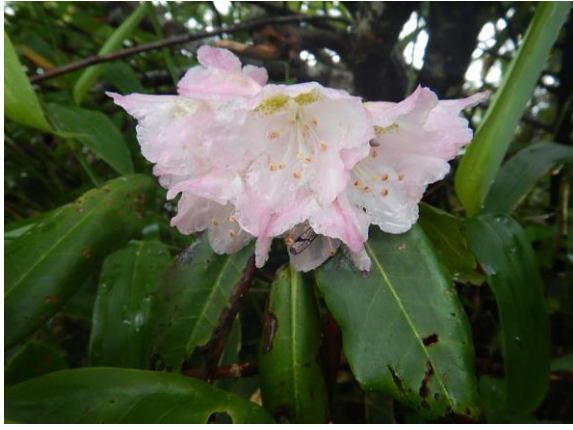
ハクサンシャクナゲ。今年はアズマシャクナゲより多く花が付きました。