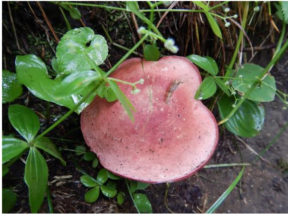
傘が平らで大きなキノコ