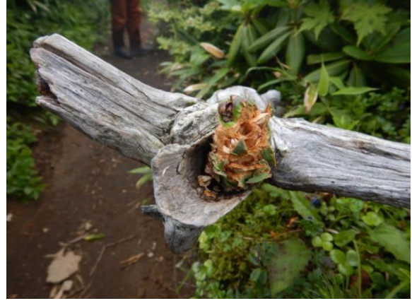
ホシガラスの食事の痕。松の実はおいしかったでしょうか？