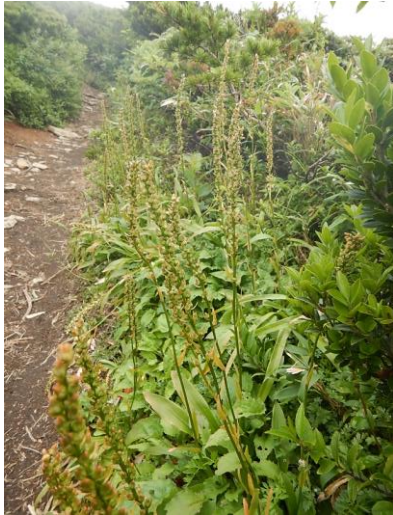
ネバリノギランの群生