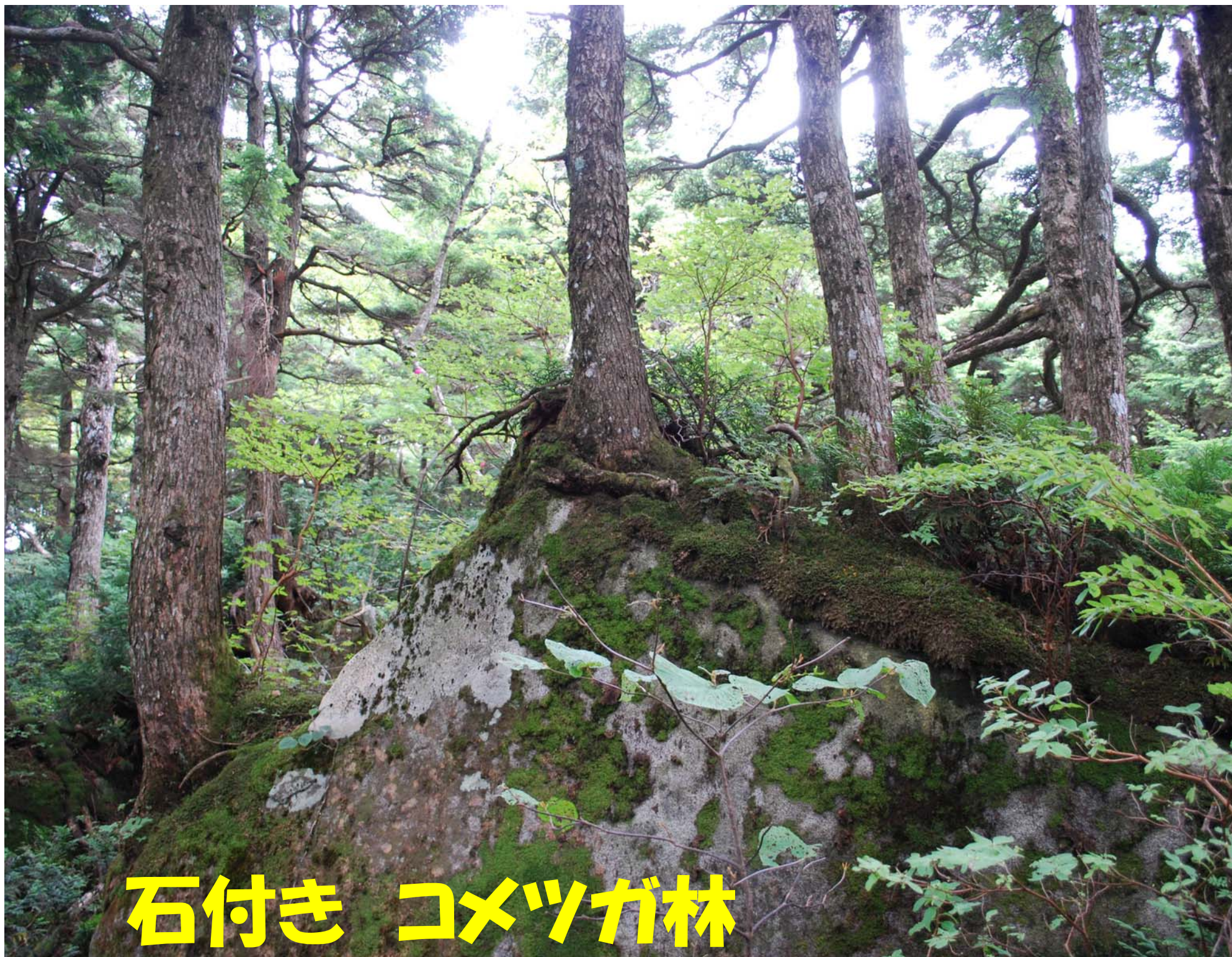
石付き コメツガ林