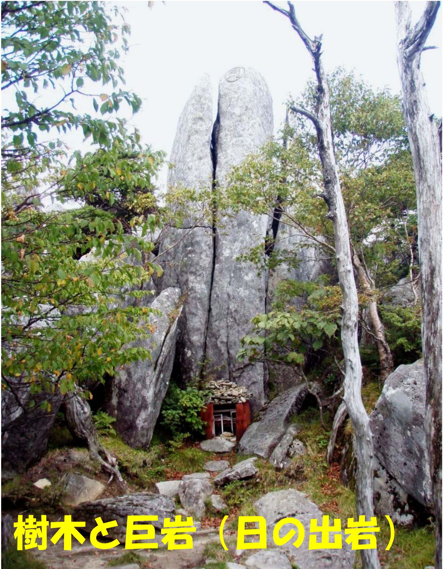
樹木と巨岩（日の出岩）