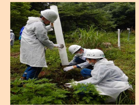
シカ食害防止のため苗木に保護管を設置する生徒

◎モデルプロジェクトの森 地域の森林の特色を活かした効果的な森林管理を目的とし、地域住民と協働・連携して森林整備を行います。