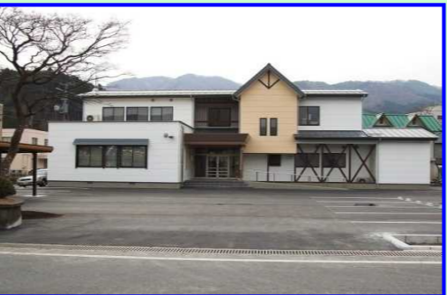
三陸中部森林管理署 庁舎全景(H20.2月完成)

○釜石森林事務所 〒026-0045 岩手県釜石市小川町1-2-8 TEL 0193-23-5140 (FAX兼用)