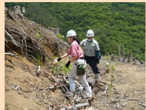
国有林野を利用した大船渡東高によるニホンジカ忌避剤効果試験地設定