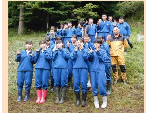
林業体験後の集合写真

◎モデルプロジェクトの森 地域の森林の特色を活かした効果的な森林管理を目的とし、地域住民と協働・連携して森林整備を行います。