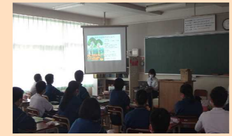
体験前の学習に講師を派遣

◎遊々の森 国有林を、様々な体験活動や学習の場として利用いただいています。 末崎中学校の林業体験活動を支援するため、森林づくりの事前学習や林業体験の講師派遣を行っています。