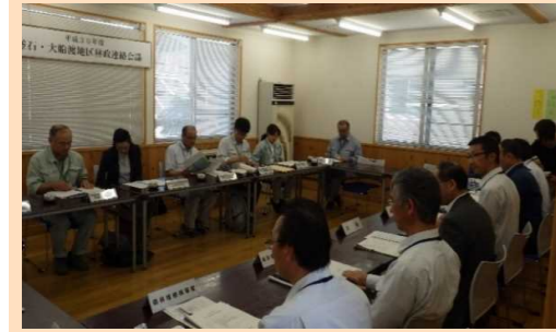
民有林行政との連絡会議

民有林と連携した森林整備を進めるため、各種会議、現地検討会を共同で開催しています。