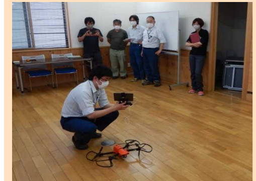
民有林行政とのドローン講習会