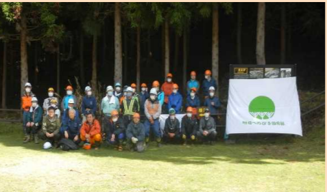
橋野鉄鉱山稼働時代の森づくり育樹