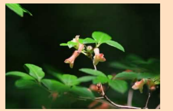
ゴウザンヨウラク