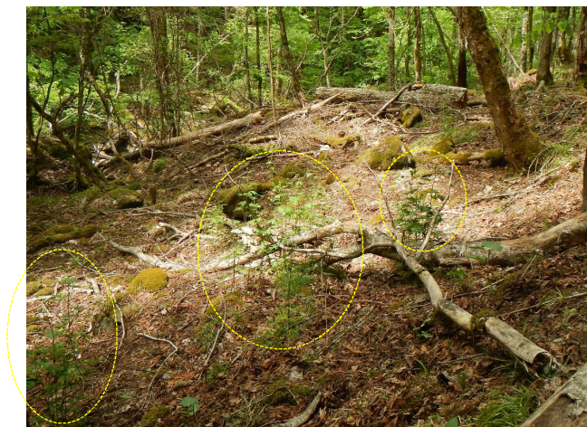
登山道沿いに生育するトリカブト (他の植物は消失または成長できず小さいまま)

このような状態で希少植物を保護するには、植生保護柵の設置が必要不可欠であることから、今後も貴重な植物を獣害から守るため、地域の皆様や関係機関等と連携を図りながら取り組んでいきます。