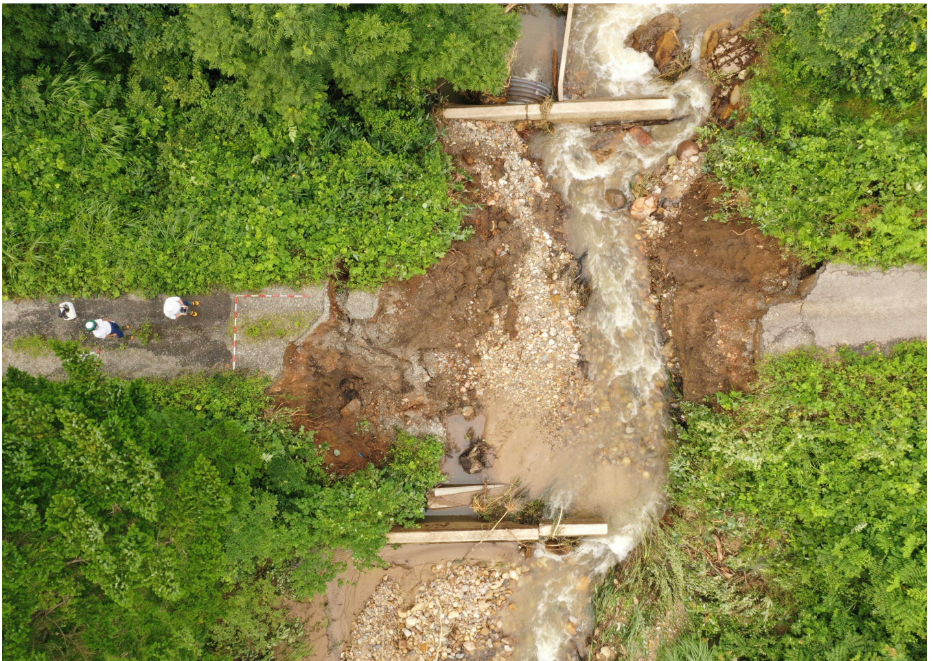
7-1 起点 路体流出 L=16m