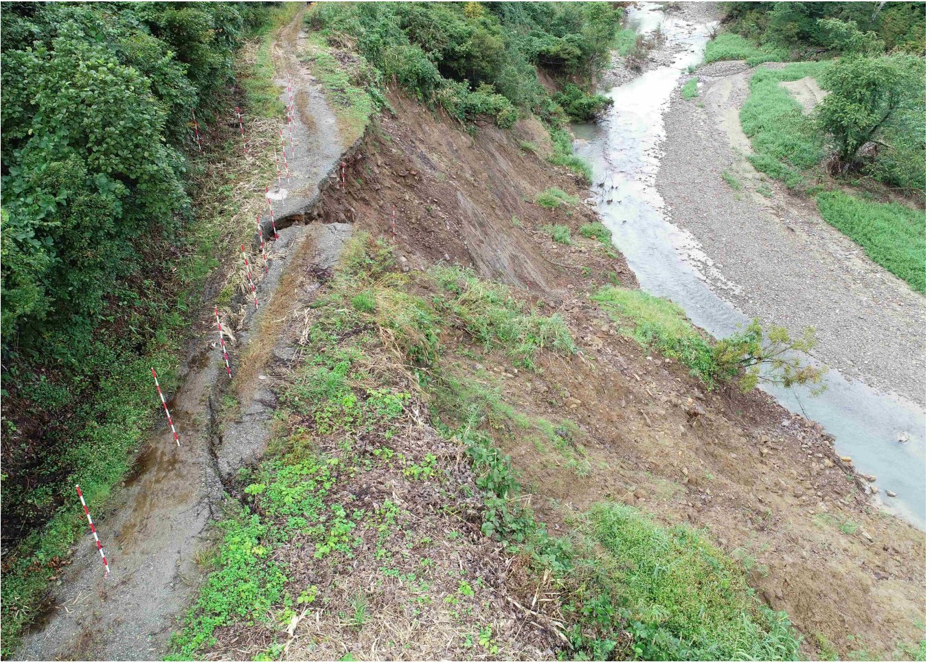
10-2 0.3km 路肩崩落 L=40m