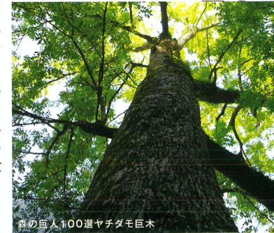
樹の巨人100歳ヤチダモ巨木

一帯は、典型的な日本海型気候区に属する全国屈指の豪雪地帯で、豊富な水をもたらし、ブナやミズナラを中心とする原生的な森や、ツキノワグマ、さらにはイヌワシ、クマタカなどの希少動物を含む、豊かな生態系を育てています。白いブナの幹と雪のイメージから「白い森」とも呼ばれています。