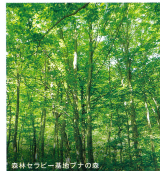
森林セラピー基地ブナの森

日本語の「森林浴」は、海外の人にも理解されるようになってきましたが、温泉に入浴して癒やされるかのように、森の中に入ることには癒やしの効果があると言われてきました。この温身平についても、様々な専門家による検証の結果、極めて優れた癒やしの森林としての特性を有することが確認されました。この結果、平成18年、全国初の森林セラピー基地に認定されました。 【森林セラピー®】 特定非営利活動法人森林セラピーソサエティが行う民間の活動です。詳しくは、同法人のHPをご覧ください。 http://www.fo-society.jp/index.html