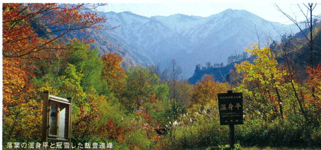
落葉の温身平と冠雪した飯豊連峰

磐梯朝日(ばんだいあさひ)国立公園内、飯豊(いいで)連峰の麓、標高450mに位置