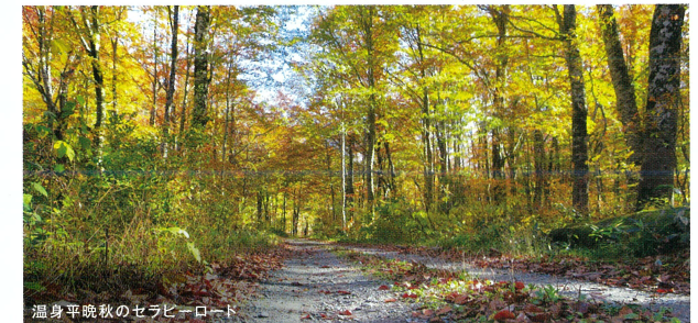
温身平晩秋のセラピーロード

このレクリエーションの森の名称「温身平」が表すとおり、園内は全般的になだらかで、散策がしやすくなっています。初心者でも楽しめる森林トレッキングの場として、秀峰飯豊連峰を間近に望み、心と体を癒やしてくれる森林セラピーの効果を感じながら、ブナ林の中を約5.5km、2時間程度、気軽に散策できるのが魅力です。