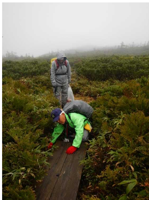
冬期を前にゴミ拾いをするスタッフ