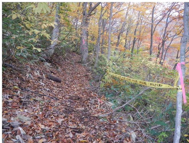
危険箇所に立入禁止のテープを付けるスタッフ