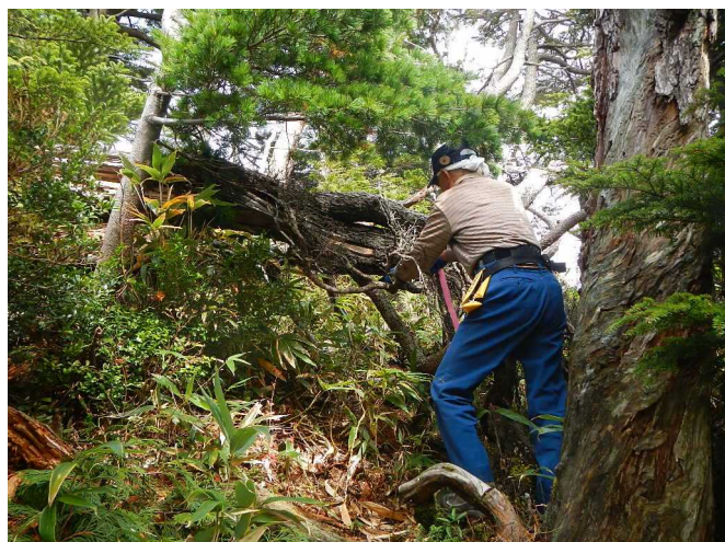
危険木に赤テープを付けるスタッフ