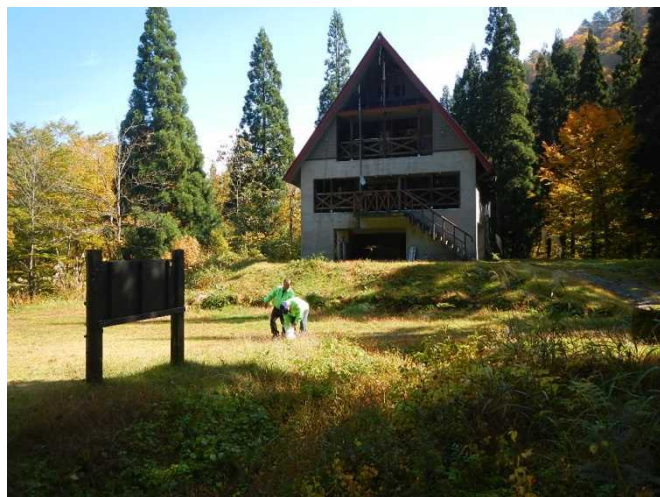
冬期を前にゴミ拾いをするスタッフ