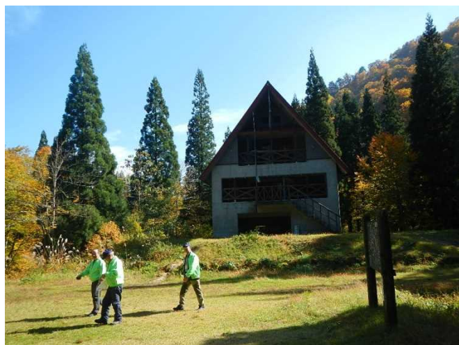
冬期を前にゴミ拾いをするスタッフ