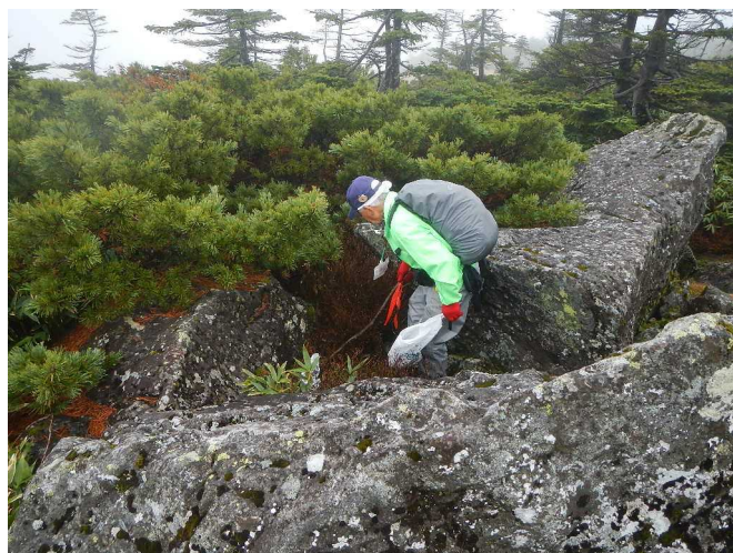
冬期を前にゴミ拾いをするスタッフ