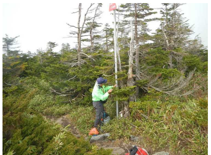
冬期に備え標識版等の補強をするスタッフ