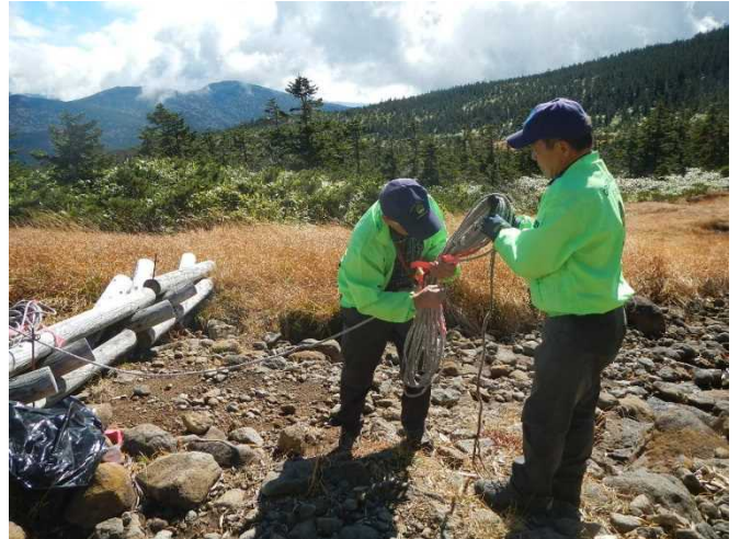
冬期に備え誘導ロープ等の撤去作業をするスタッフ