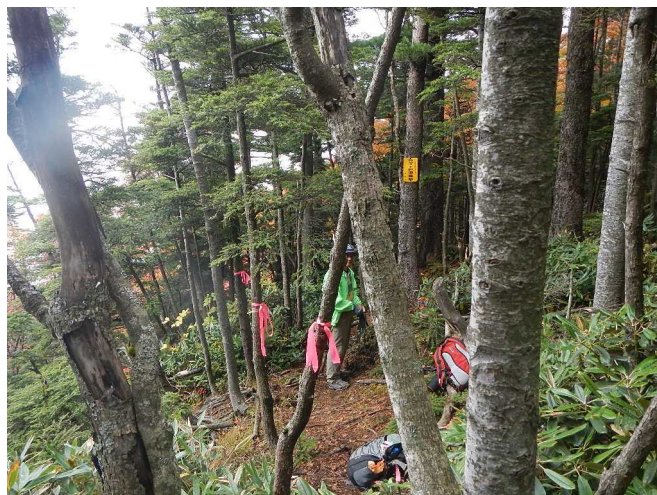
道標の赤テープを付けるスタッフ