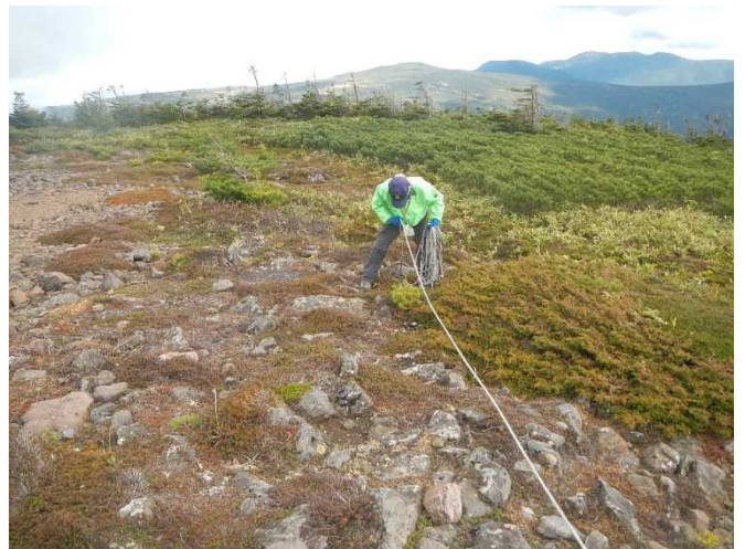
冬期に備え誘導ロープ等の撤去作業をするスタッフ