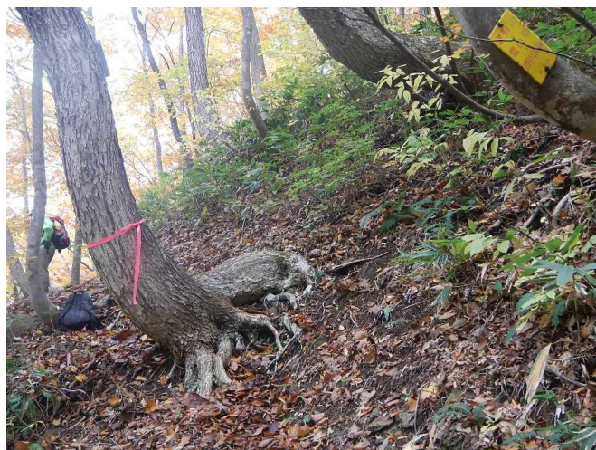
道標の赤テープを付けるスタッフ