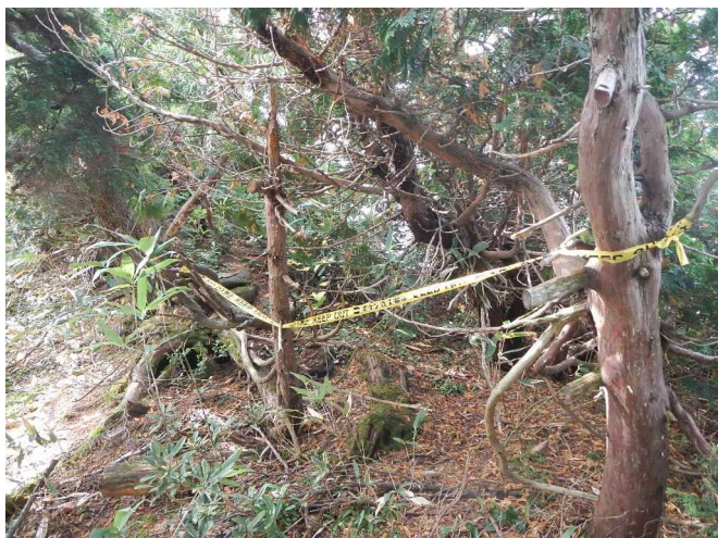
危険立ち入りテープを設置するスタッフ