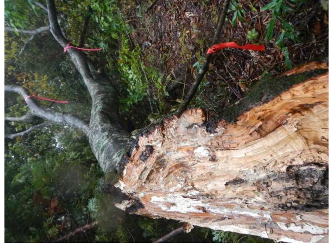
倒木等に危険表示のテープを付けるスタッフ