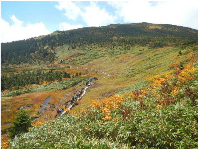
天候に恵まれ多くの登山者が訪れた