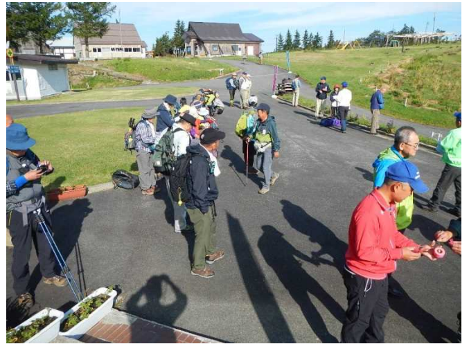
登山者にパンフを配布しながら説明するスタッフ