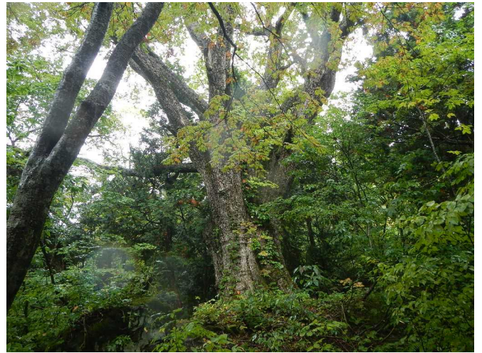
巨木 100 選「吾妻のミズナラ」