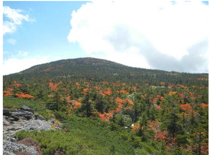
赤や黄色に色付いてきた吾妻周辺の山