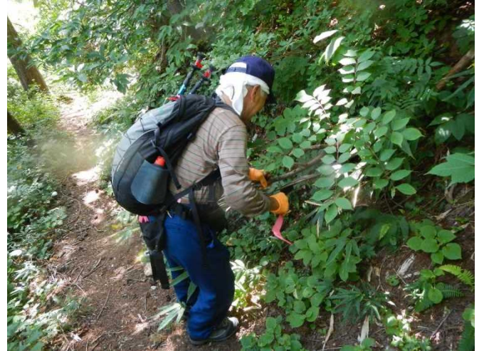
危険木に赤テープを付けるスタッフ