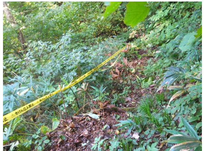
立入禁止テープを設置するスタッフ