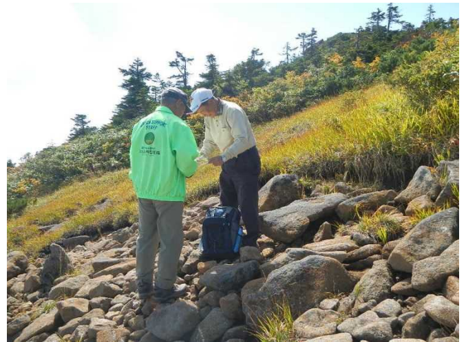
登山者にパンフを配布して説明するスタッフ