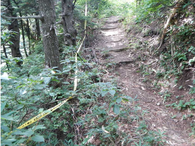
危険立ち入りテープを設置するスタッフ