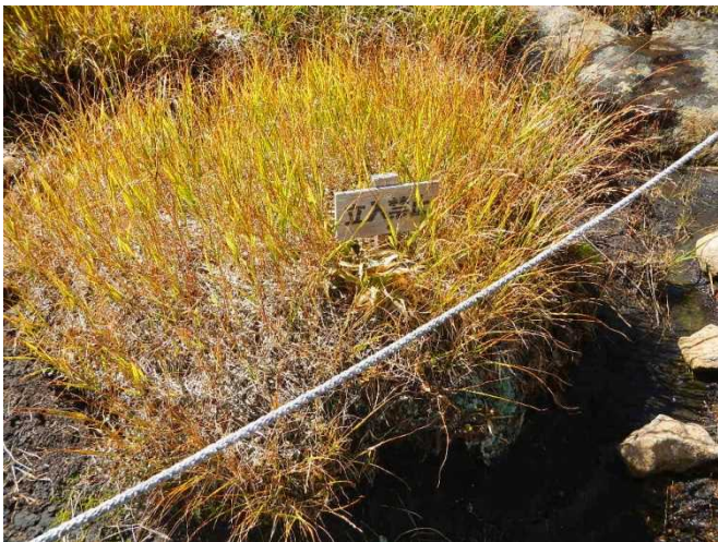
立入禁止の表示板を設置するスタッフ