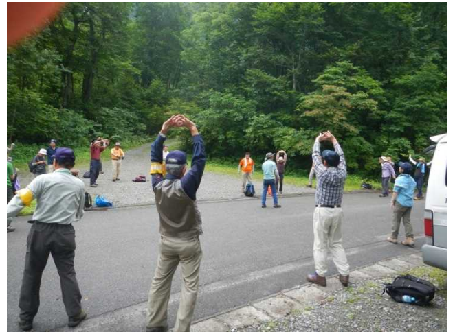
登山者グループと準備運動するスタッフ