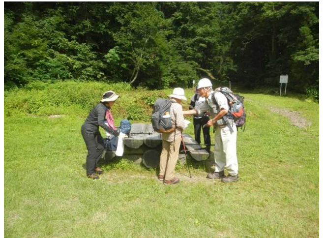
登山道入口でパンフを配布しながら説明するスタッフ