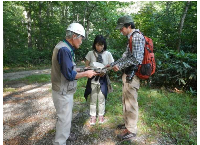
登山者にパンフを配布しながら説明するスタッフ