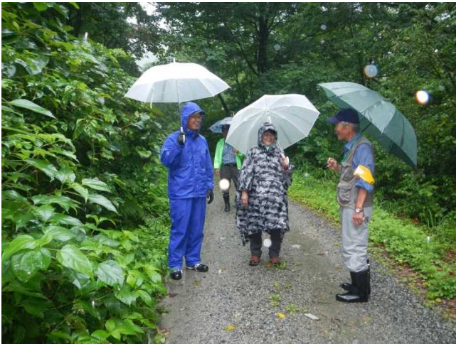
登山者に注意喚起するスタッフ