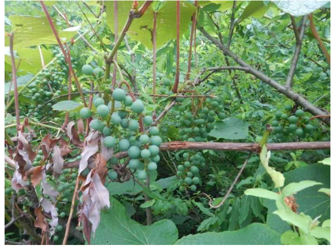
豊作の予感があるヤマブドウ