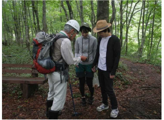
登山者にパンフを配布しながら説明するスタッフ