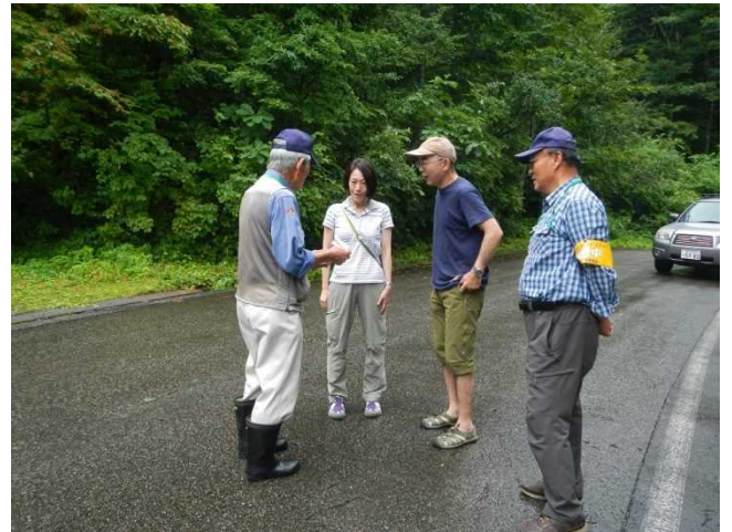
登山者にパンフを配布しながら説明するスタッフ