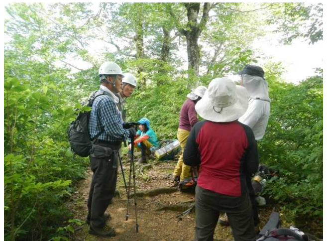
登山道途中でパンフを配布しながら説明するスタッフ