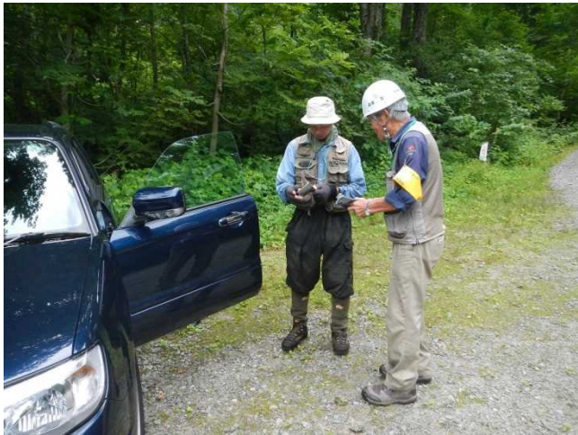
登山者にパンフを配布しながら説明するスタッフ