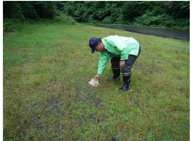
ゴミ拾いをするスタッフ