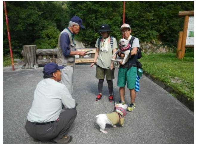
登山者にパンフを配布しながら説明するスタッフ