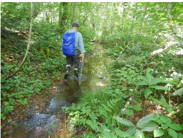
大雨の影響を調査するスタッフ