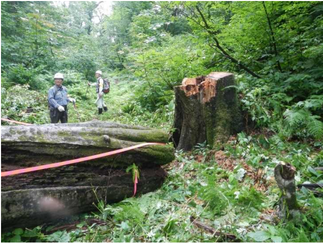
伐倒危険木に注意表示をするスタッフ