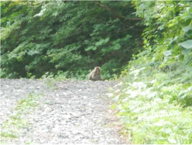
林道上でくつろぐニホンザル