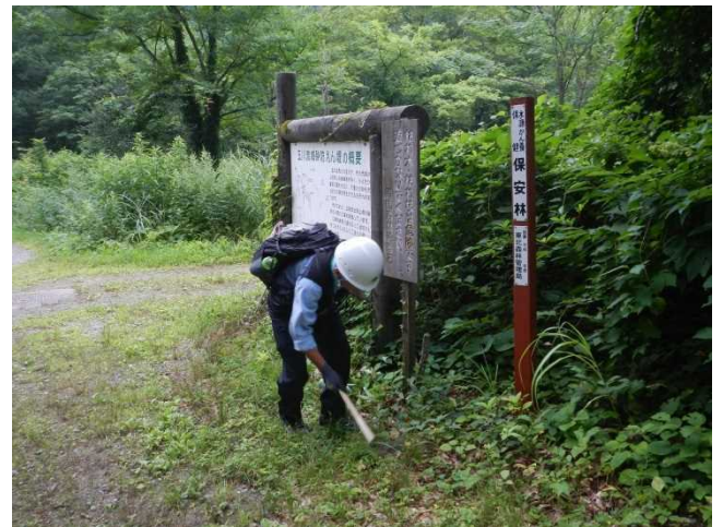
標識・看板等周辺の刈払いをするスタッフ