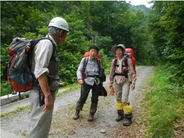
登山者にパンフを配布しながら説明するスタッフ