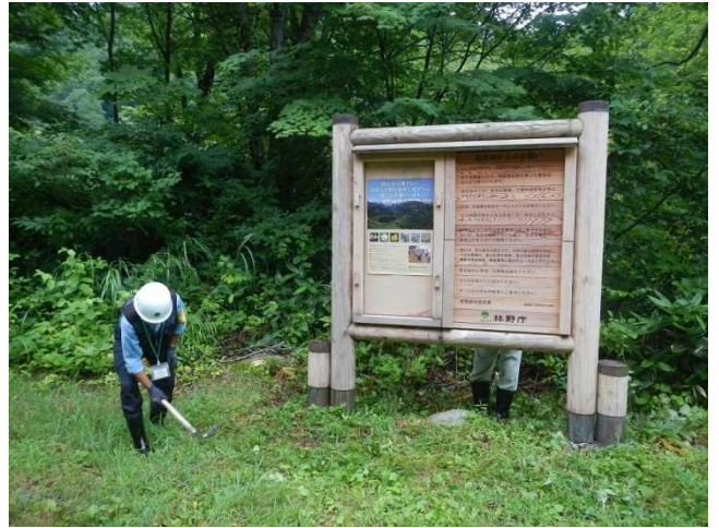
森林生態系保護地域看板周辺の刈払いをするスタッフ