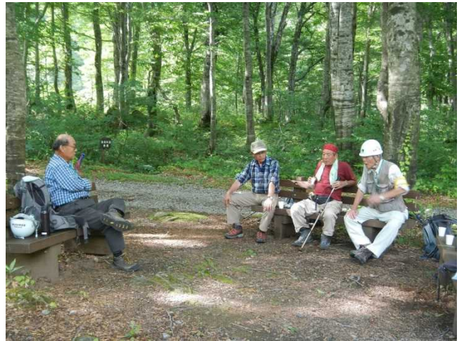
登山者に山の状況を説明するスタッフ