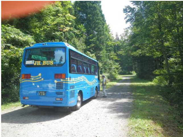
登山者を乗せたバスに林道状況説明するスタッフ