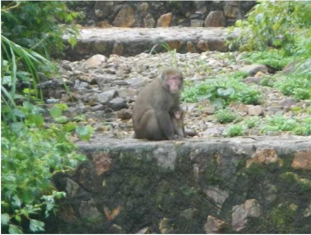
小ザルを抱いた親ザル