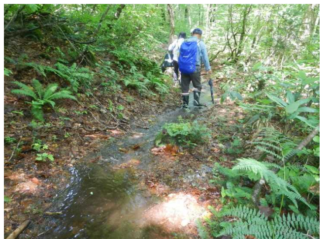
登山者に大雨の影響を注意喚起するスタッフ