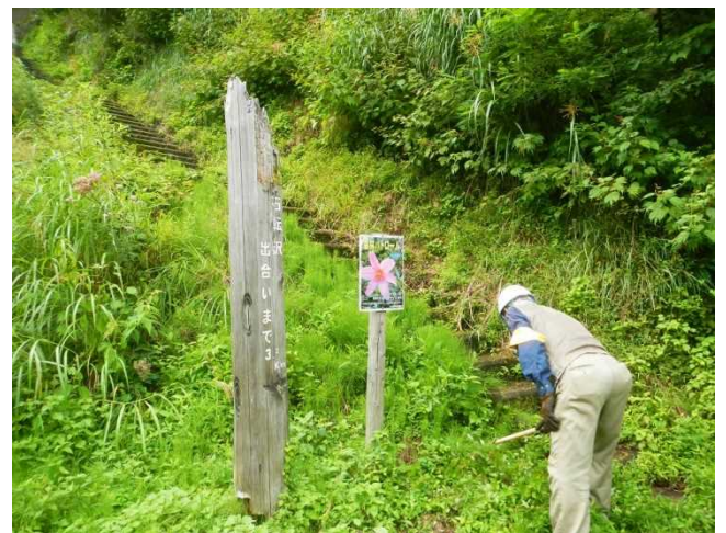
標識・看板等周辺の刈払いをするスタッフ