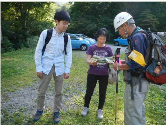
登山者にパンフを配布しながら説明するスタッフ