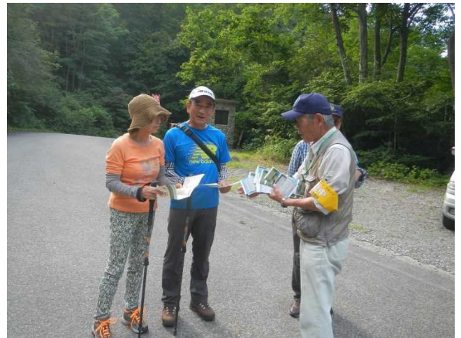
登山者にパンフを配布しながら説明するスタッフ