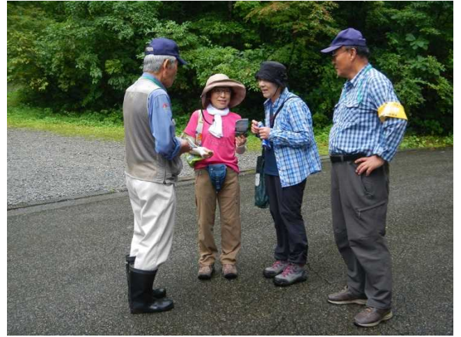
関係者や登山者にパンフを配布しながら説明するスタッフ