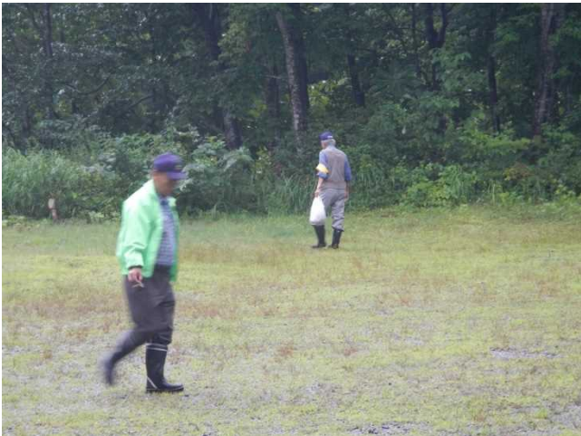
ゴミ拾いをするスタッフ