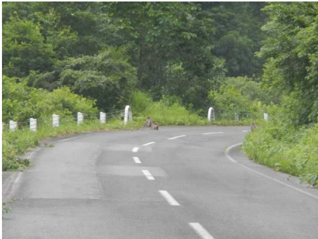
ニホンザルの群れ