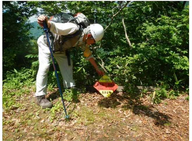
案内板を設置し直すスタッフ