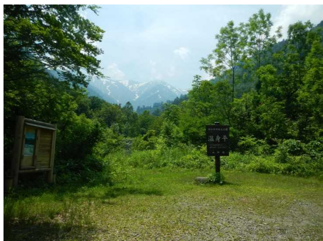
温身平より梅花皮岳