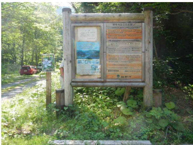
張り替え前の劣化した看板のポスター