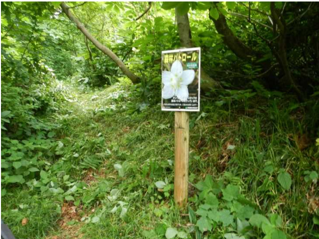
パンフ設置看板周辺を刈り払い