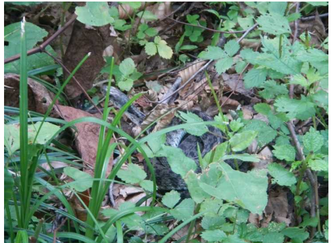
ヤマカガシが生息しており入山者に注意喚起した