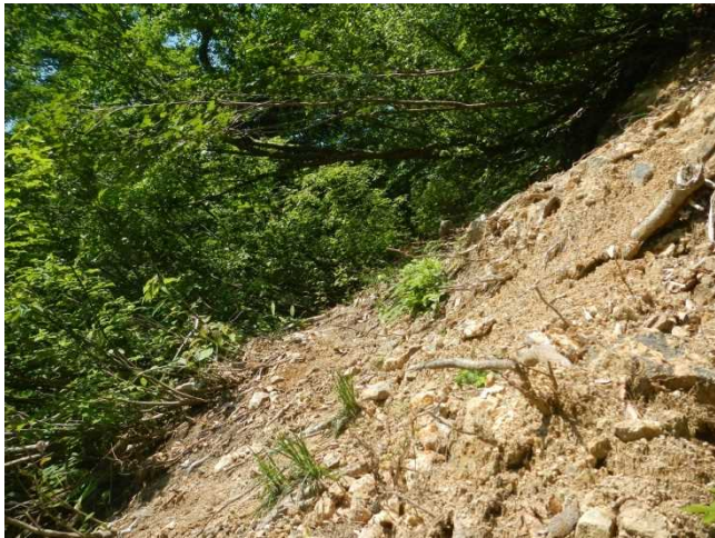
先の大雨で歩道の一部が崩壊