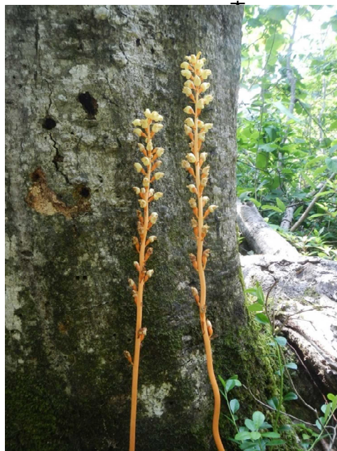
オニノヤガラ開花