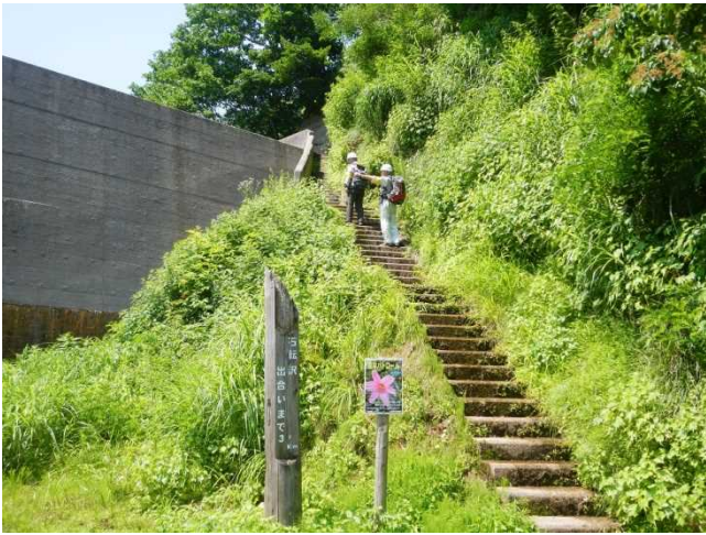
カイラギ沢登山道の安全確認