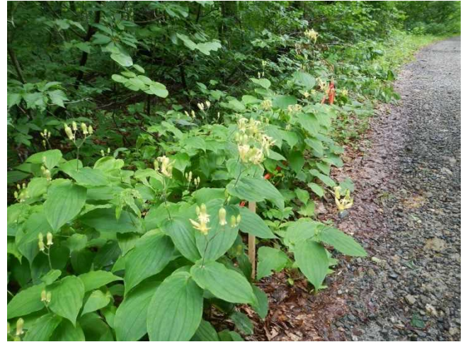
満開のタマガワホトトギス