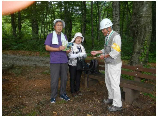
登山者にパンフレットを配布するスタッフ