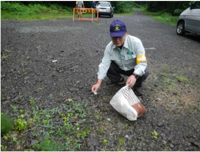
大日杉周辺のゴミ拾いをするスタッフ