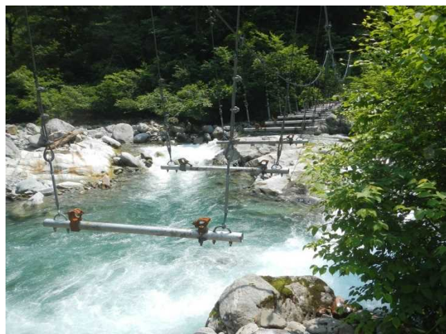
雪解けと雨の影響で増水が続く