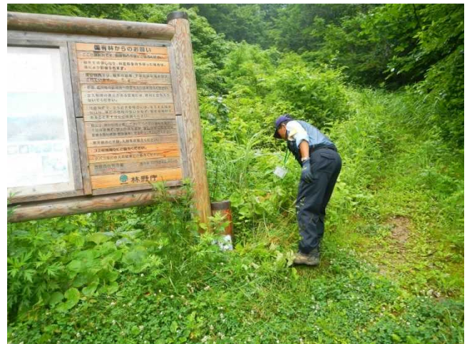
森林生態系保護地域看板の補修と周辺を刈払うスタッフ