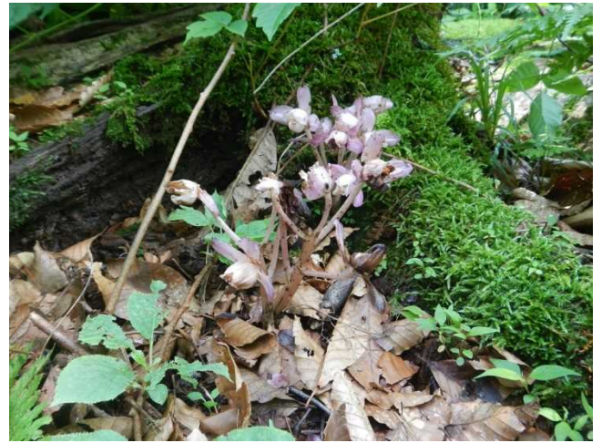
開花したショウキラン