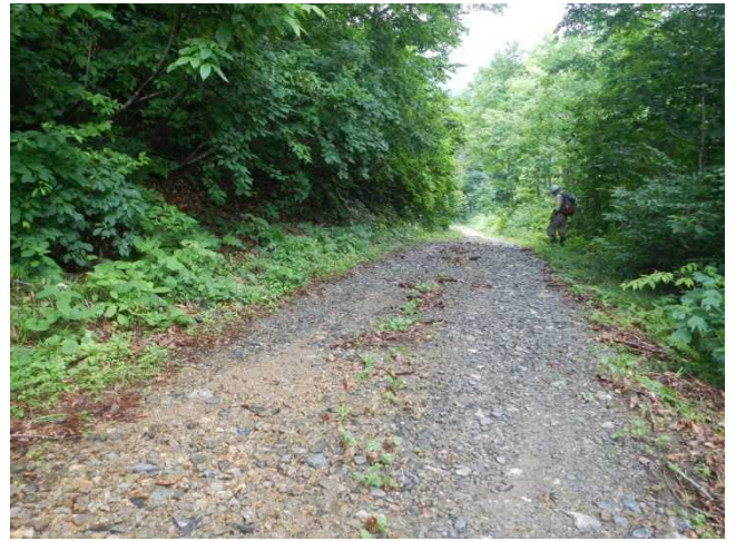
大雨の影響で林道にも洪水の後が見られる