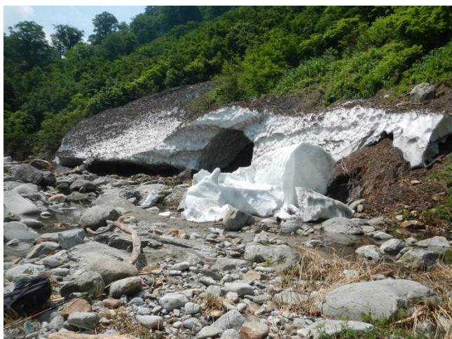
まだまだ残雪の多い桧山沢付近