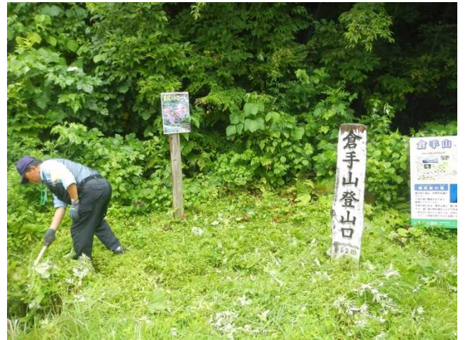
森林生態系保護地域のパンフ周辺を刈払うスタッフ