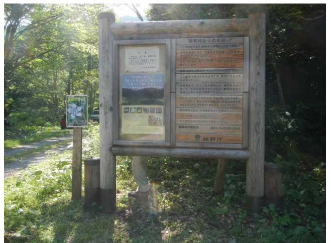
張り替え後の看板ポスター