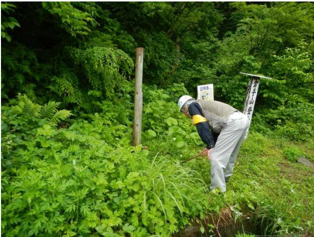
標識設置周辺の草刈をするスタッフ