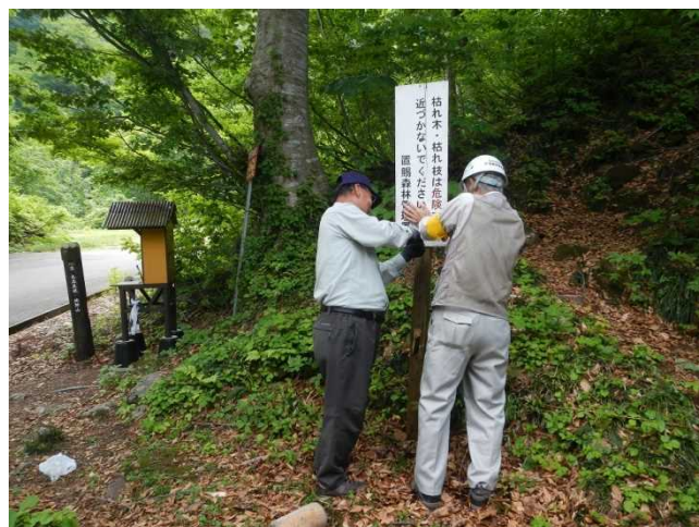
冬期間に一時撤去した標識・看板を設置するスタッフ