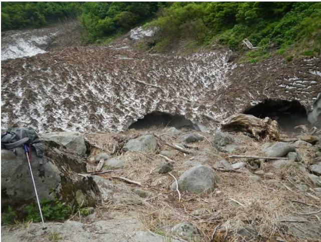
桧山沢吊り橋付近の残雪（今年は多い）