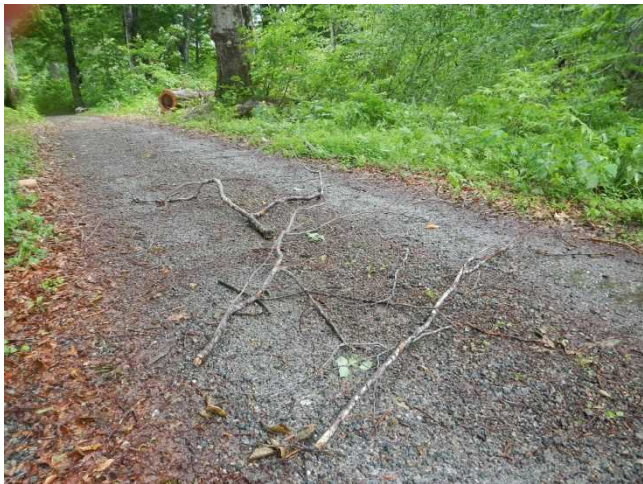
暴風雨により散乱した多くの枯枝を撤去しました