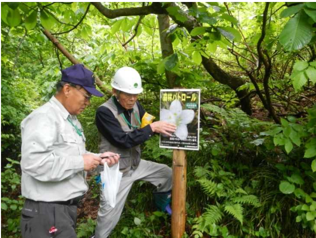
森林パトロールのチラシを設置するスタッフ