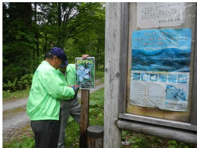
森林パトロールのチラシを設置するスタッフ