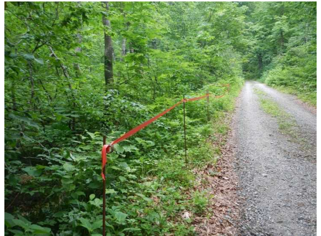
タマガワホトトギス自生地の保全テープ設置