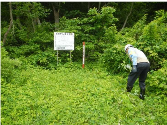
標識設置周辺の草刈をするスタッフ