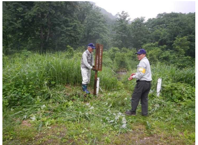
看板設置と草刈をするスタッフ