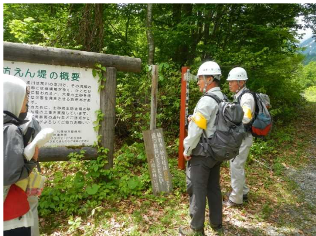
入山者に説明するスタッフ