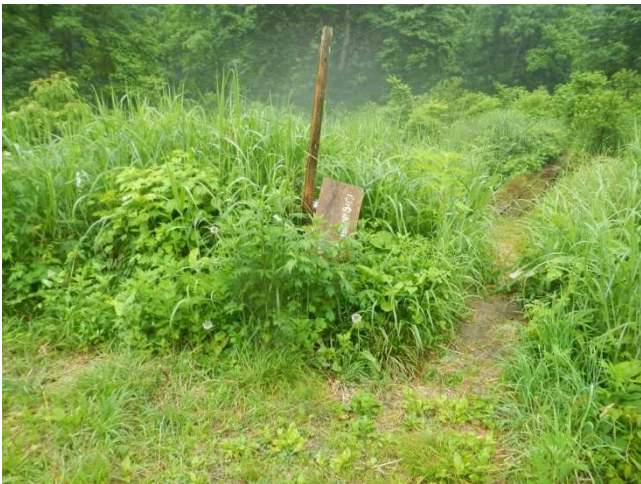
看板設置前の状況