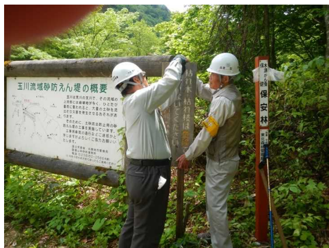
冬期間に一時撤去した標識・看板を設置するスタッフ