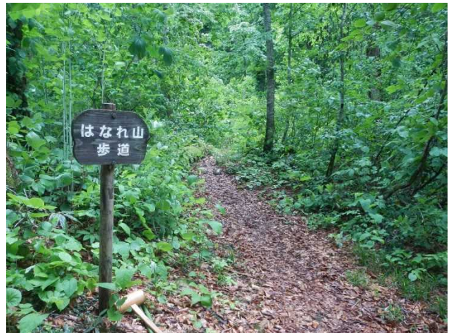
はなれ山歩道の草刈をしました