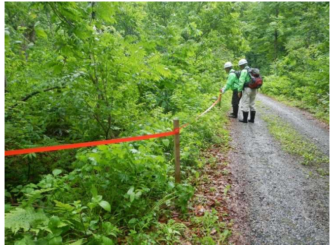
タマガワホトトギス自生地を踏込みから保全するためテープ設置するスタッフ