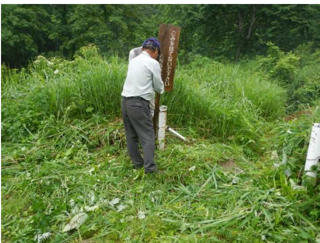
看板設置と草刈をするスタッフ