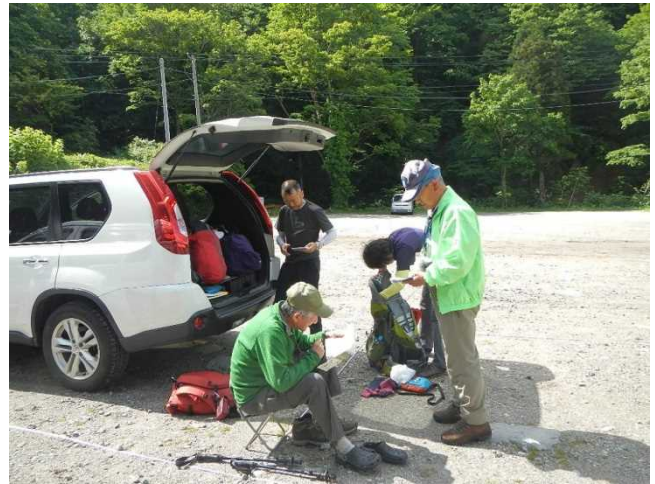
登山者にパンフで説明するスタッフ