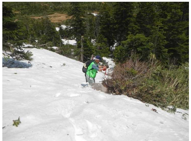
残雪の登山道脇に赤布を設置するスタッフ