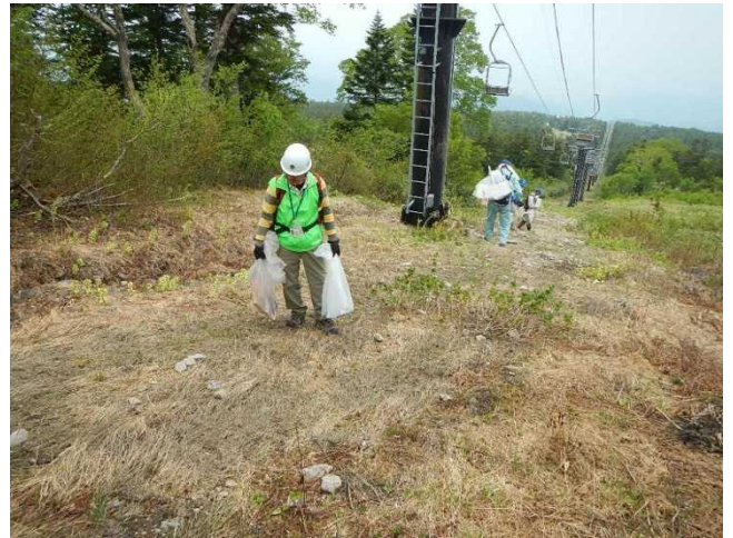
天元台高原周辺のゴミや吸い殻を拾うスタッフ