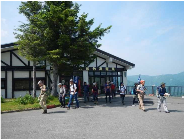
入山者へ吾妻山の保全活動の協力を呼びかけ