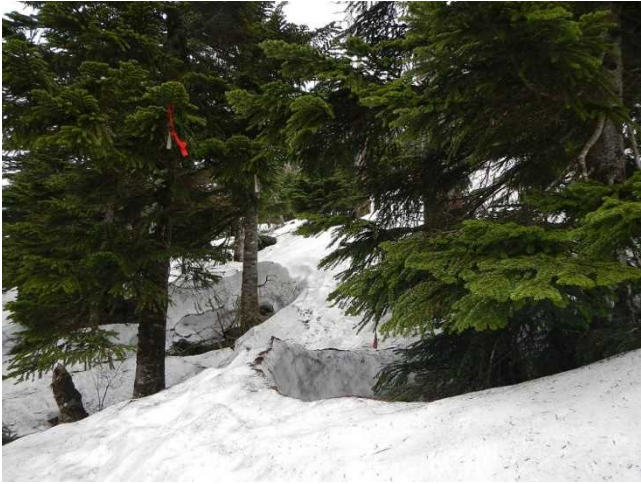
残雪に覆われる登山道（スタッフの設置した赤布）