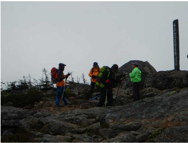
登山者に生態系保護地域を説明するスタッフ