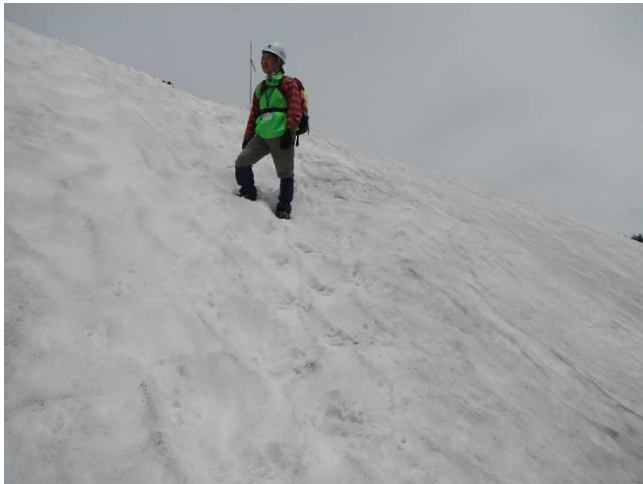
雪渓をカットして安全を確保するスタッフ