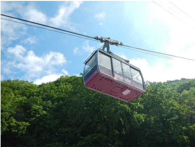
リニューアルしたロープウェイ