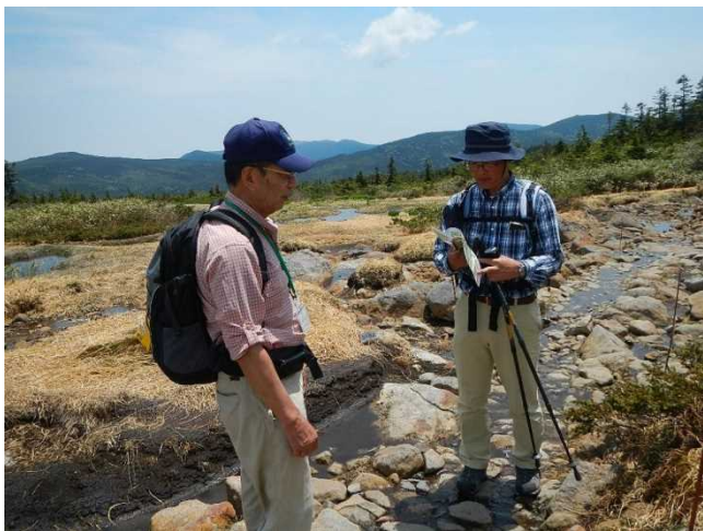
登山者に生態系保護地域を説明するスタッフ