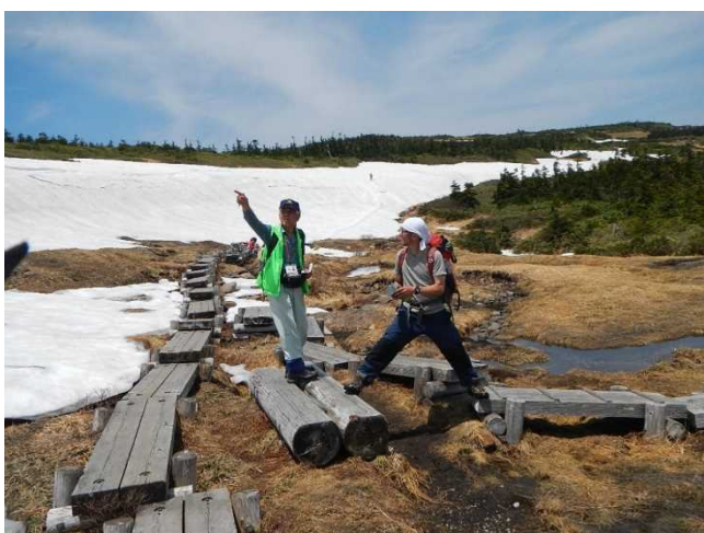
登山者に生態系保護地域を説明するスタッフ