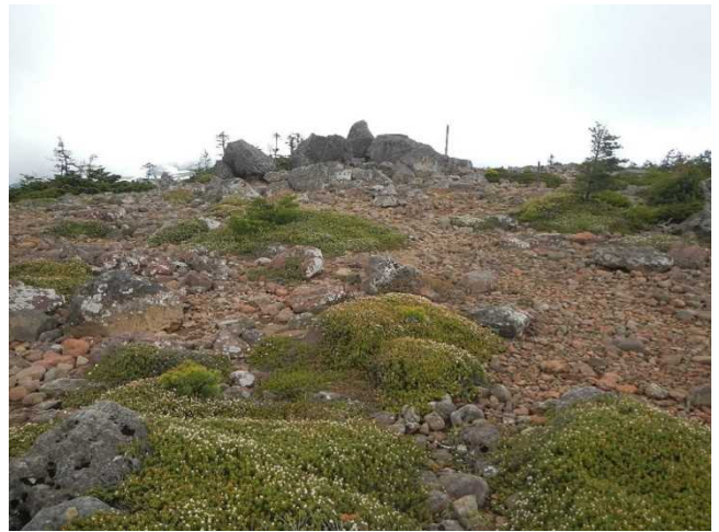
ミネズオウの群落