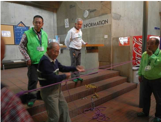
天元台で主催した山岳レスキューの講習会に参加したスタッフ