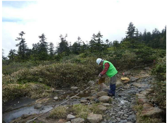
誘導ロープと立入禁止標識を設置するスタッフ