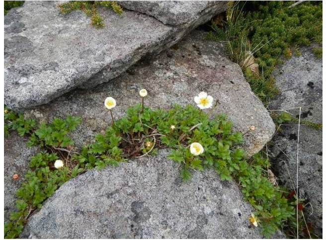
岩の間に咲くチングルマ