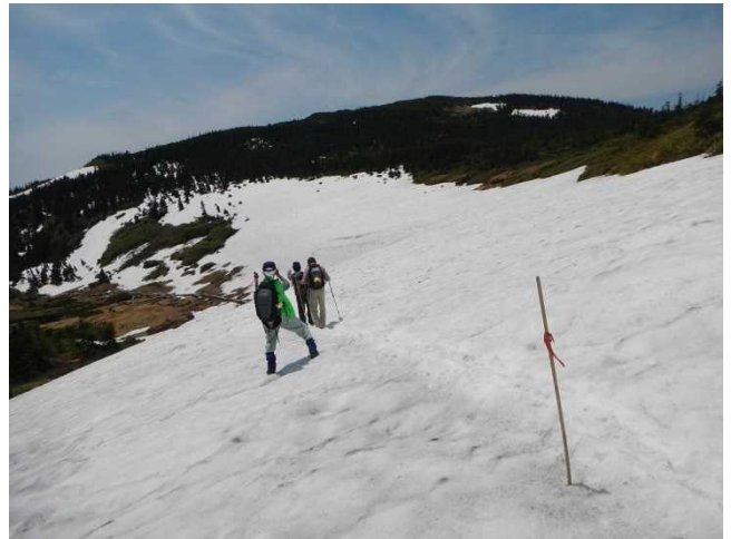
残雪の登山道にシノ竹を設置するスタッフ