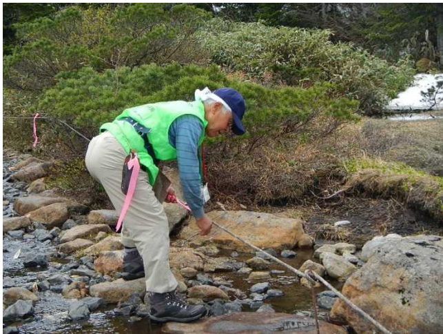
誘導ロープと立入禁止標識を設置するスタッフ