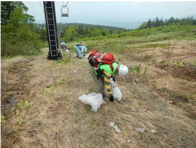
天元台高原周辺のゴミや吸い殻を拾うスタッフ