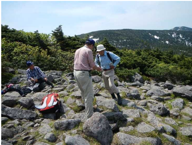
登山者に生態系保護地域を説明するスタッフ