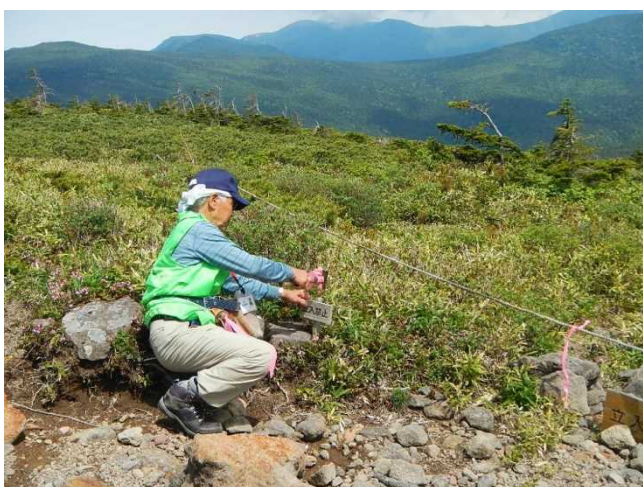
誘導ロープと立入禁止標識を設置するスタッフ