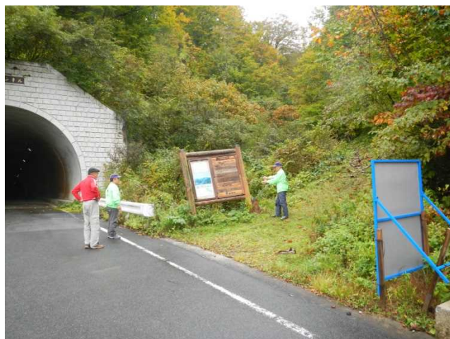
冬季に入る前に飯豊トンネル前の傾いた看板を確認する