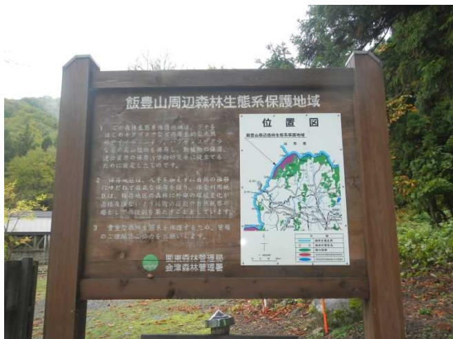
御沢野営場にある林野庁看板を確認