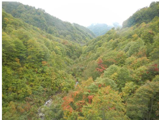
小白布沢大橋からの紅葉は時期的に少々早いようだ