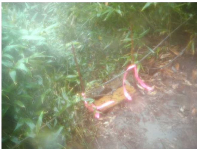
ロープ回収せず外すのみとする