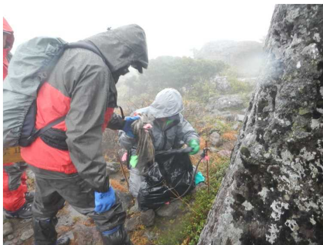
冬季に入る前に立入禁止看板及びロープの取り外し作業をする