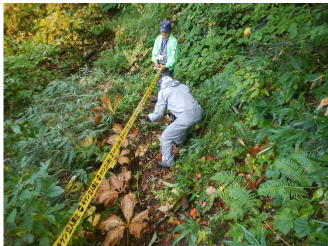
通路の下が沢で危険なため立入禁止のテープを張る