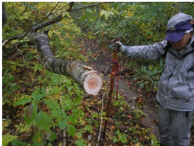
数箇所の倒木の撤去作業を行う