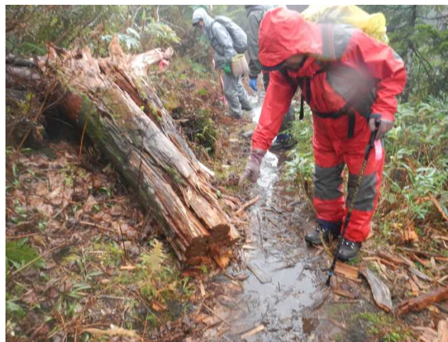
倒木はチェーンソーにて処理済