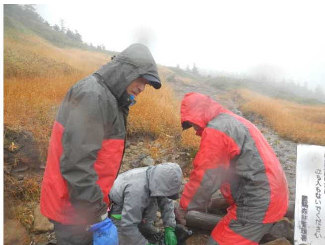
冬季に入る前に立入禁止看板及びロープの取り外し作業をする