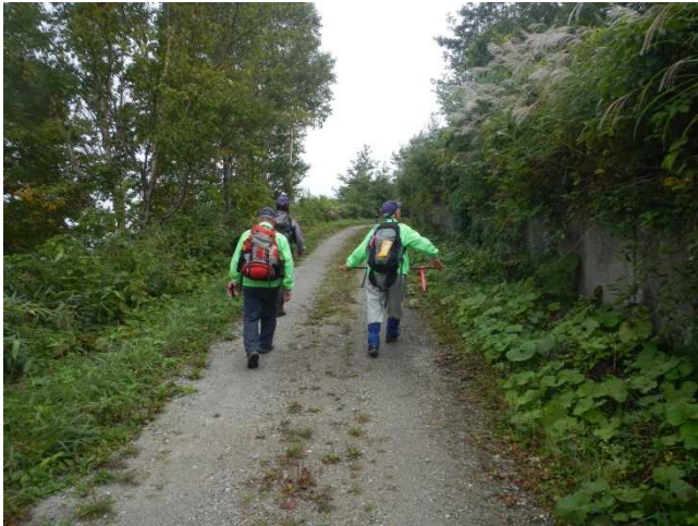
大平登山口の状況把握と安全確認