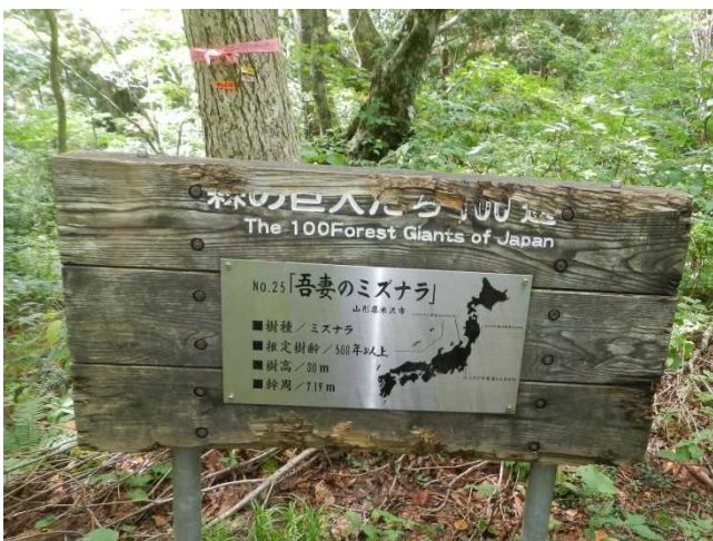
林野庁の「森の巨人たち百選」に選ばれているミズナラ巨木のナラ枯れ状況を確認