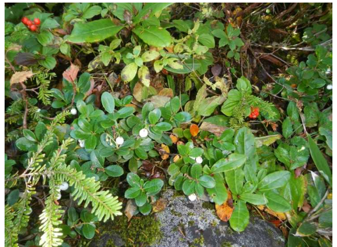
シラタマノキとゴゼンタチバナ