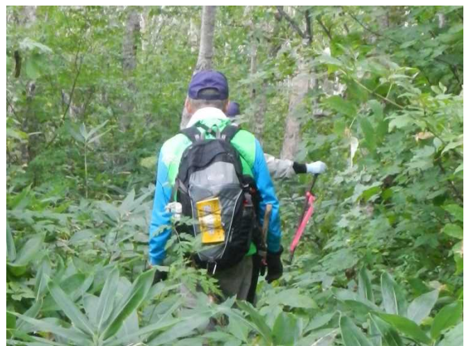
ママ河原兩岸に道標の赤布を付す（昨年10月に遭難事故が発生した箇所であるため）