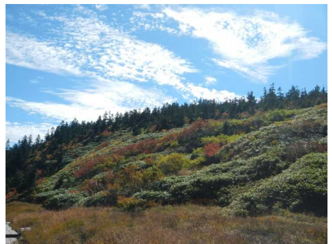
初秋を感じさせる鱗雲