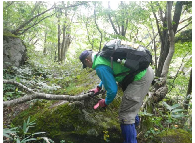
通行の支障になる多くの倒木を鋸にて処理する