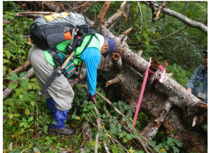
巨木倒壊箇所（コメツガ・ナラ）周囲を処理し注意喚起の赤布を付す