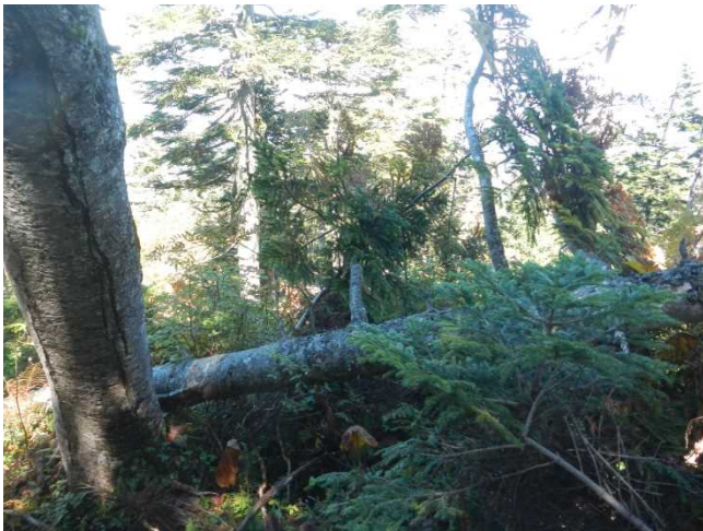
通称「ユキザサ曲がり」付近 近年倒木が目立つ