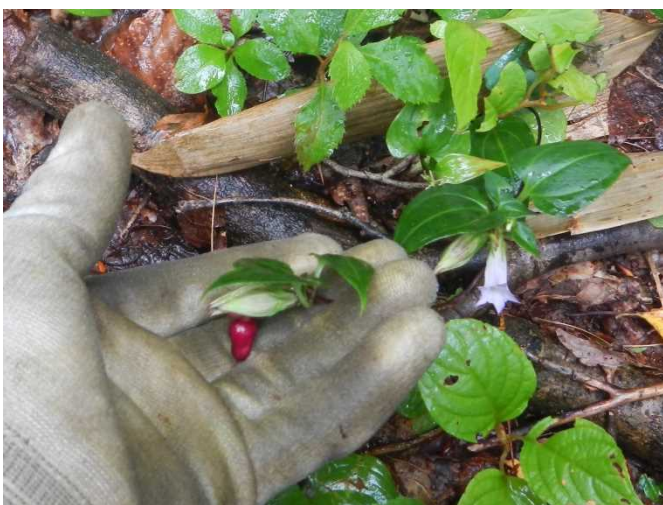
ツルリンドウの花と実