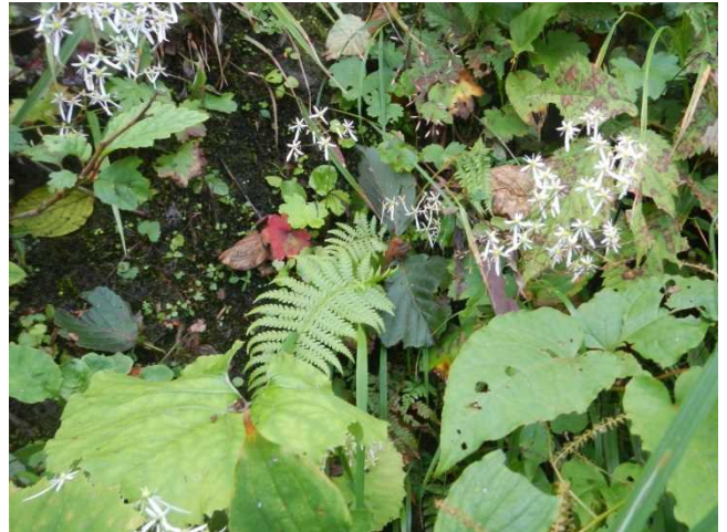
ダイヤモンドソウ