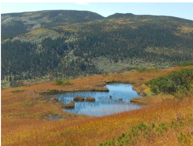
草黄葉に映える池塘と西吾妻山