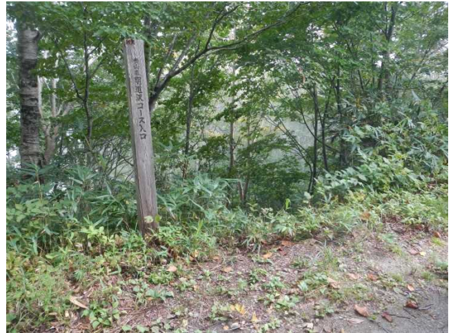
明道沢コースの状況把握と安全確認