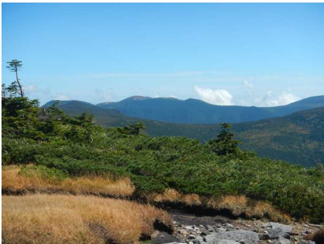
火口周辺規制となった一切経山