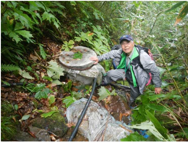
導水管と集水タンクを確認する