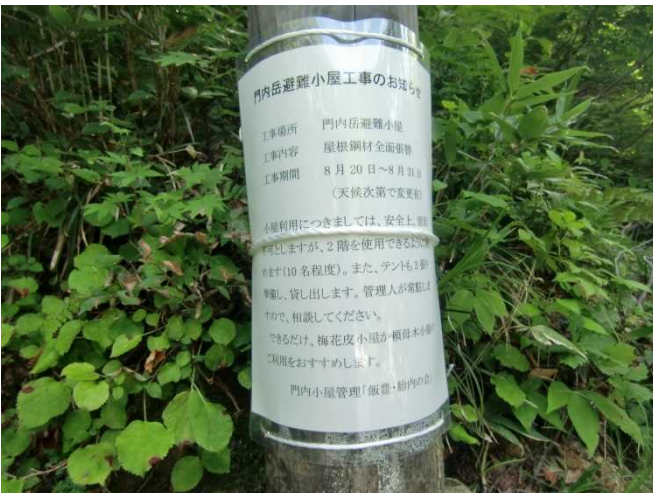
門内小屋修理のお知らせ