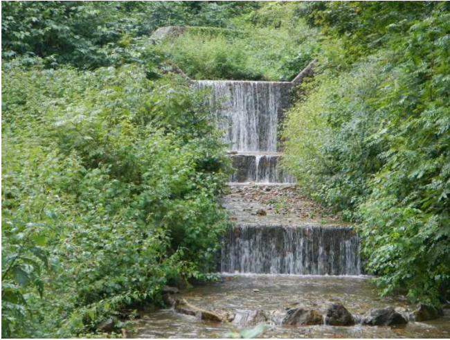
いつもは水の無い曲沢が大雨のため流水あり