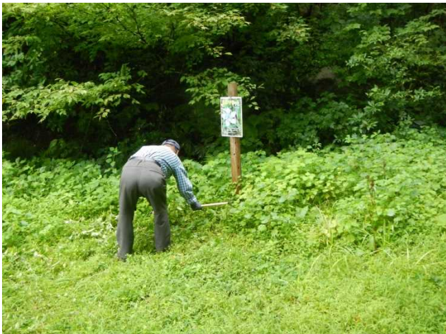
大日杉駐車場林野庁看板付近の草刈をするスタッフ