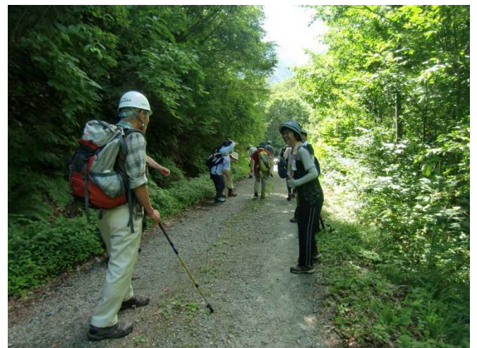
パンフレットを配布し案内するスタッフ