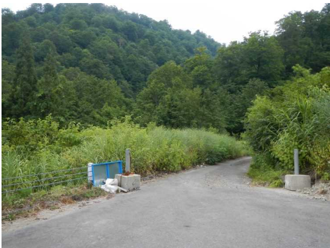
解放されている谷地平林道(去年は閉鎖)