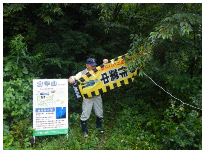
倉手山に作業中の幟(のぼり)を掲げるスタッフ