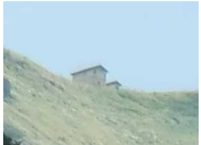
温身平から梅花皮岳・梅花皮小屋方面を望む