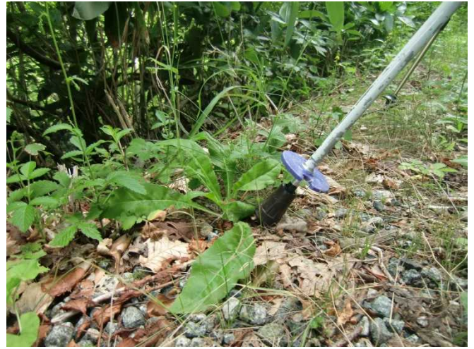
コウゾリナのロゼット葉があったので駆除した (もともと温身平には無かった植物)