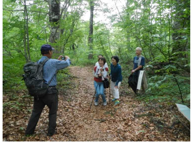
登山グループにパンフレットを配布し現地案内するスタッフ