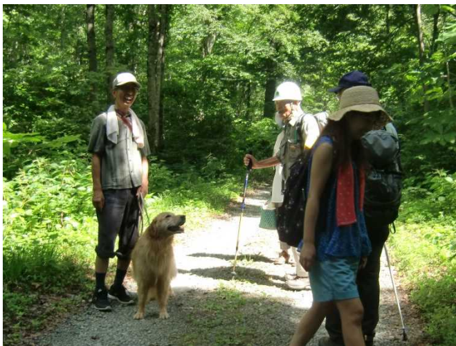
犬を連れての登山者にパンフレットを配布し国立公園 でのマナーと生態系保護への協力を促すスタッフ