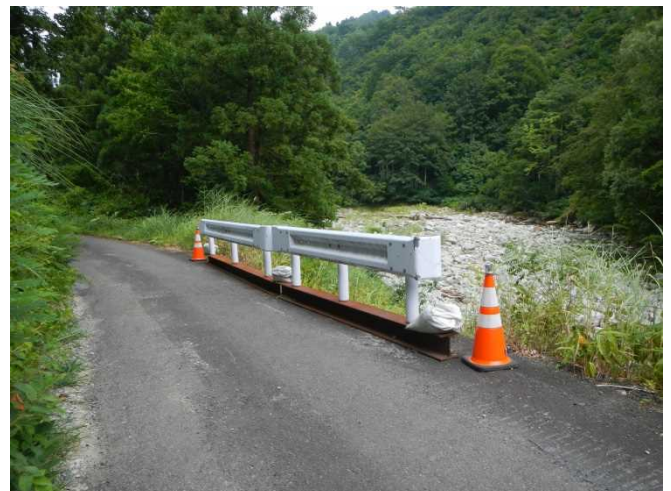
大日杉林道危険箇所の確認