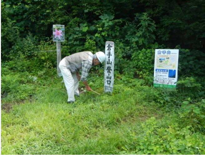
倉手山コース登山口の草刈をするスタッフ