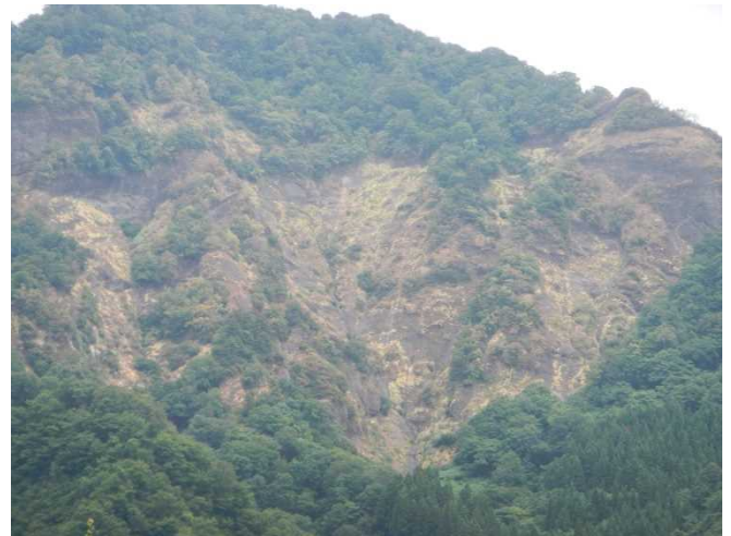
水不足で赤茶けてきたカザクラ山(小玉川小中学校の裏山)