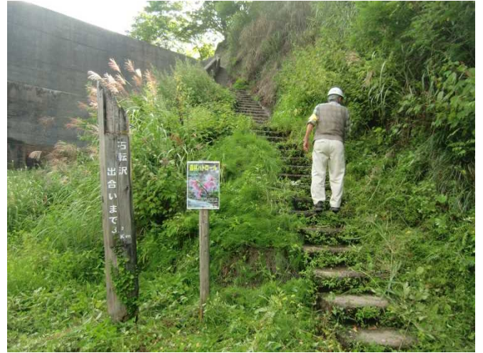
梅花皮沢第4砂防堰堤付近草刈