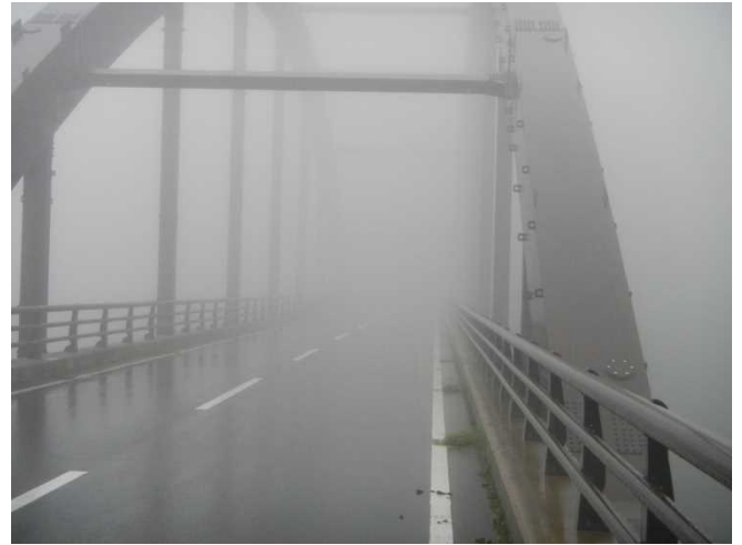
小白布沢大橋は強雨と濃霧