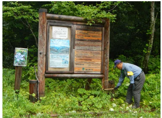
大日杉駐車場林野庁看板付近の草刈をするスタッフ