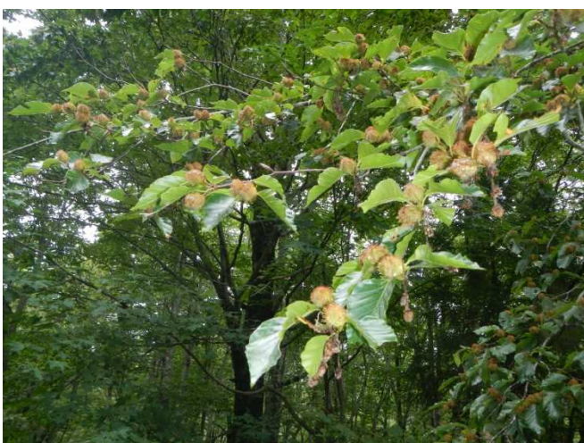
ブナの実今年は豊作