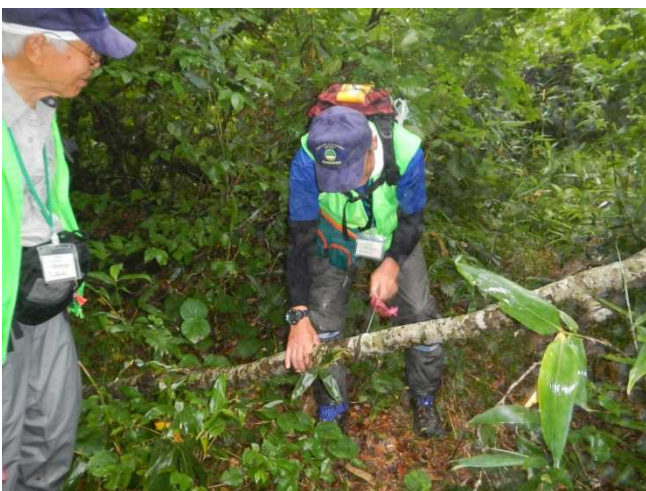
倒木を鋸で処理するスタッフ