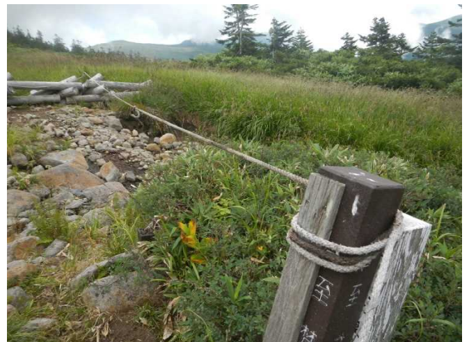
立入禁止のロープが切れていたため、補修作業を実施