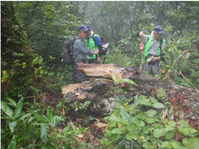
人力処理できない倒木に危険防止のため赤布を添付し注意を促す