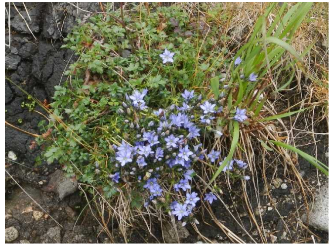
ミヤマリンドウが大きな株になって咲いている 異常気象の影響か