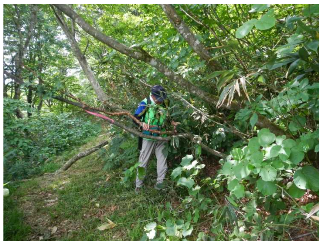
通行の支障となる倒木を処理するスタッフ