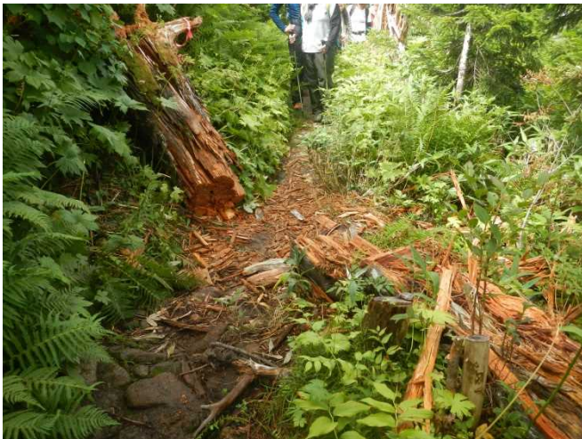
登山道を塞いでいた倒木の処理を確認