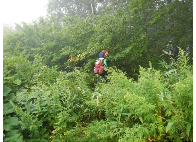
西大巔への登山口が藪状で分かりにくいいため 枝を払い赤布の目印を添付するスタッフ