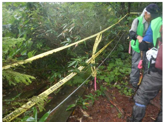
立入禁止区域の確認