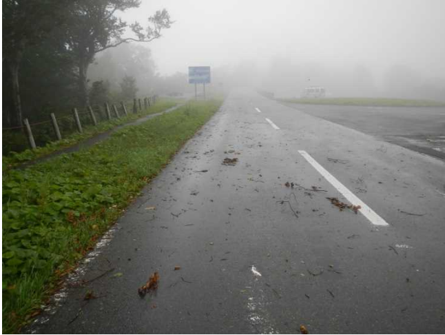
台風の影響により枯枝や枯葉が道路に散乱