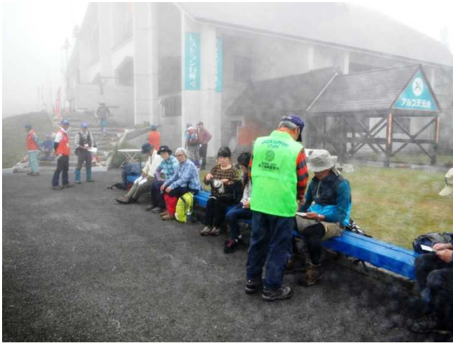
入山者へパンフレットを配布するスタッフ 山の日になんだイベントで多くの登山者が訪れた