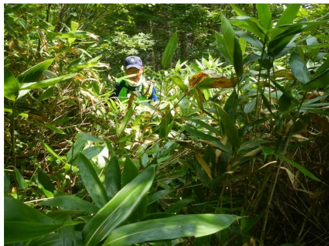
高倉山方面の登山道 笹藪で通行が困難