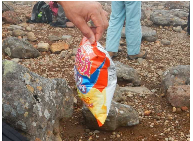
標高が高く気圧が低い膨んだ菓子袋