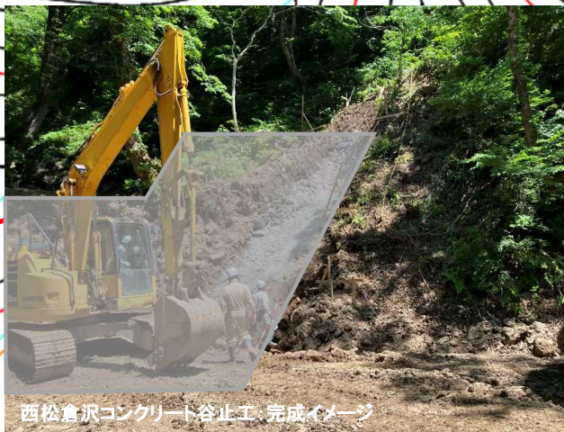
西松倉沢コンクリート谷止工：完成イメージ