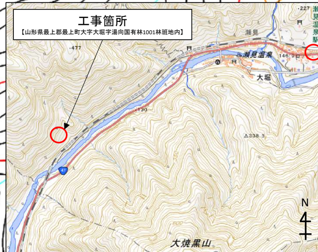
工事箇所 【山形県最上郡最上町大字大堀字涌向国有林1001林班地内】