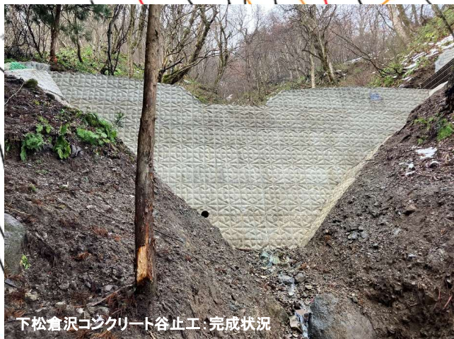
下松倉沢コンクリート谷止工：完成状況