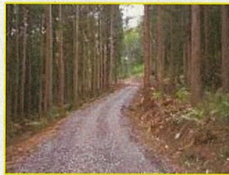
林業専用道イメージ