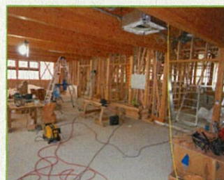
内部もだいぶ完成してきました