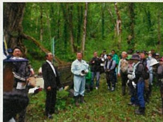
新田町長のあいさつ