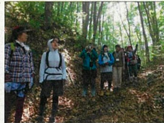
ガイドさんの説明に耳を

ツアーの最後には、大鍋で作られたミズ汁が振る舞われ、鮭川村の自然と山の恵みに癒やされました。