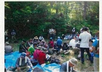
業務総括による森林クイズ