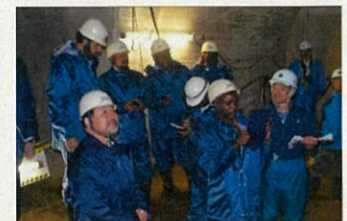
なにを撮ってるの？