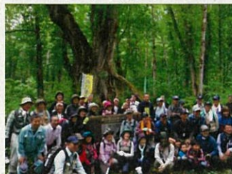
「大カツラ」前で記念写真