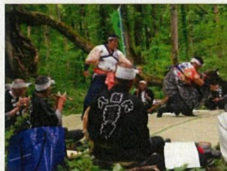
「八敷代番楽」の奉納