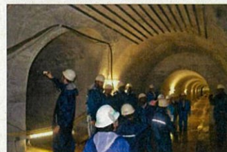
説明に耳を傾けます