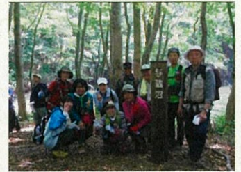
「与蔵沼」をバックに