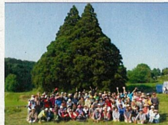
「小杉の大杉」で記念写真