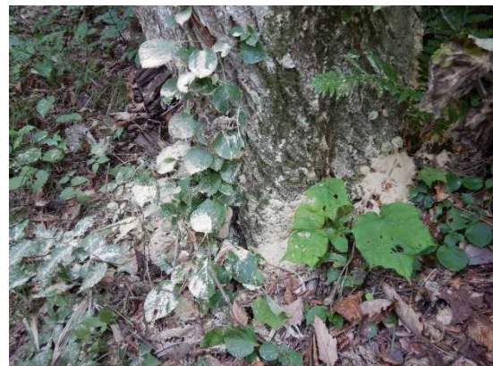
【写真】被害を受けた立枯木の状況

問い合わせ先：林 野 庁 東北森林管理局 三陸北部森林管理署久慈支署 総括森林整備官 古川 Tel : 0194-53-3391 Fax : 0194-52-2653