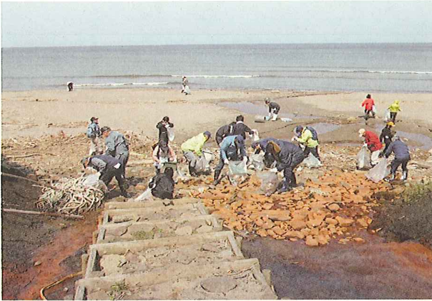
《 ゴミ拾い風景 》