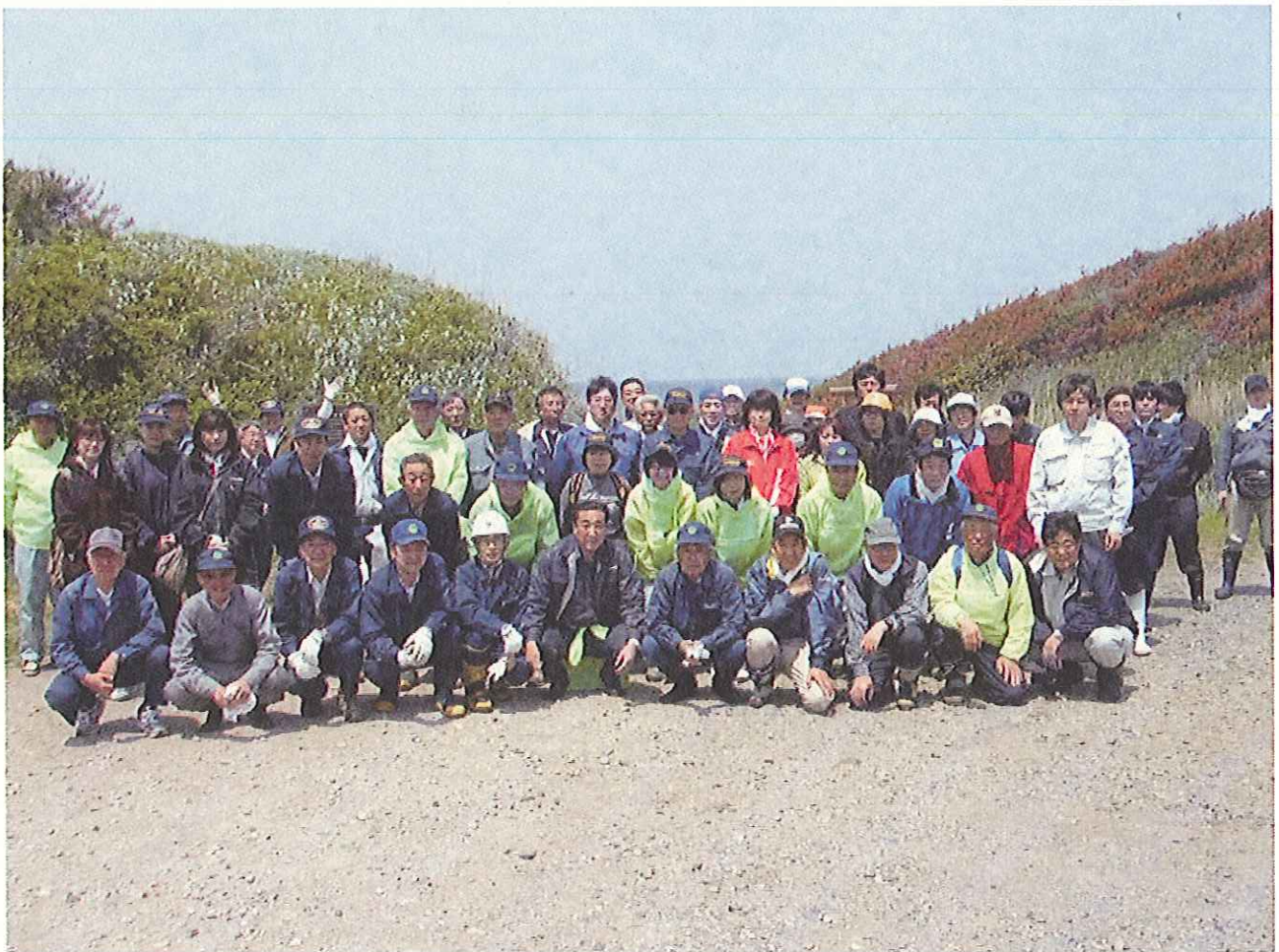
《 作戦を成功した参加者全員の集合写真 》

特に現地は深い砂地がほとんどであり、作業するにあたり歩きにくい場所と、日頃の運動不足にメタボも重なり、時間がたつにつれてペースダウンを余儀なくされましたが、みんなが一丸となり作業は無事終了となりました。当日撤去したゴミの量は、粗大ゴミや燃えないゴミを中心にして4トトラックで2台分と、2トトラック1台分、軽トラック2台分となりましたが、この日撤去したゴミはすべてつがる市の廃棄物処理場で処分していただきました。参加者一同は、今後も地元自治体、森林ボランティア巡視員等と連携を図りながら、美しい森づくり、美しい海岸林に蘇えさせる活動により不法投棄防止のPR活動及び保安林の公益機能の保全に努めて行きます。