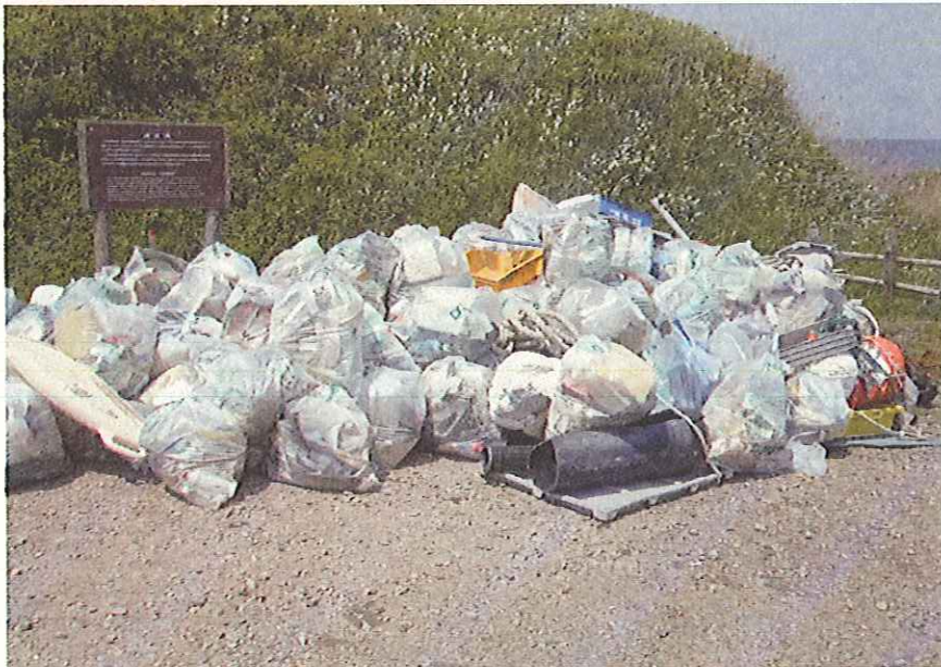
《 拾われたゴミ 》