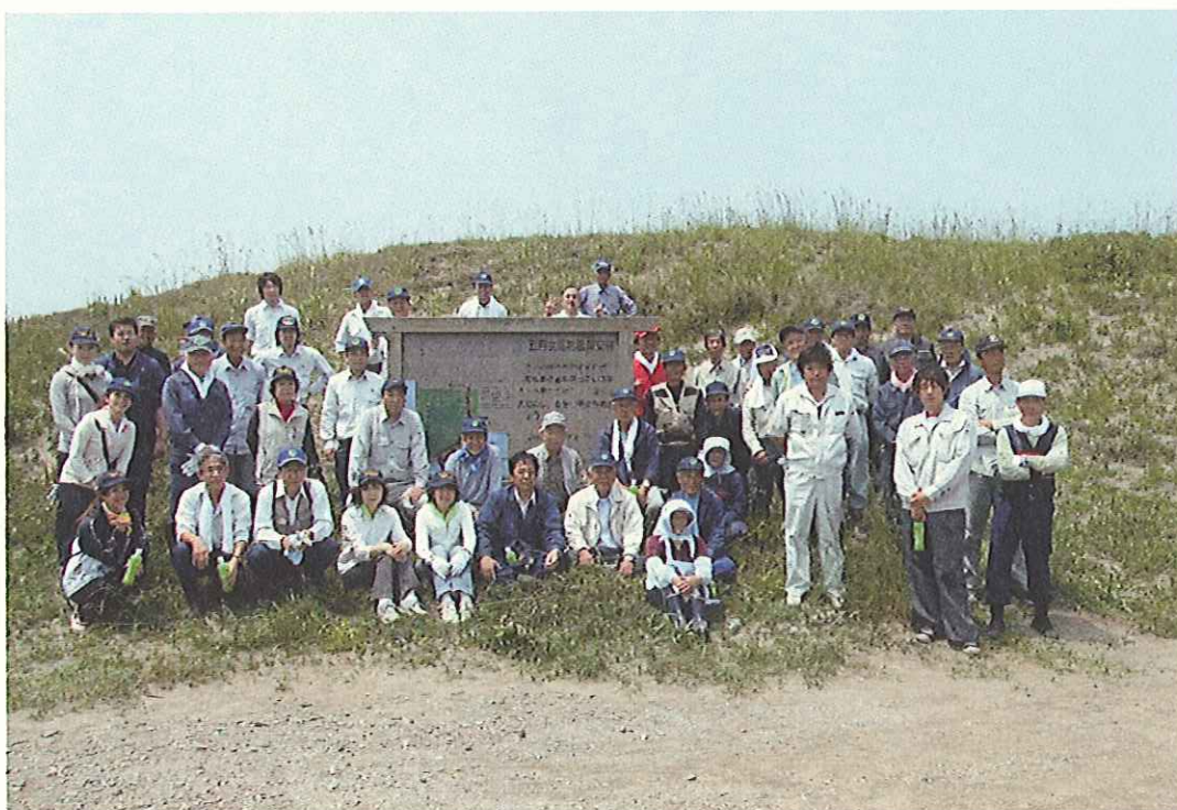
(クリーンアップ終了後の全体写真)

去る6月9日(水曜日) 昨年に引き続き、五所川原市十三五月女范国有林内において、クリーンアップ作戦を実施しました。