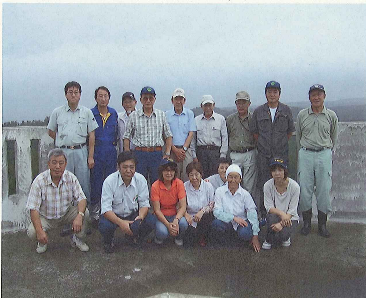
(高山小公園展望台での集合写真)

去る8月4日(水曜日) 金木支署及びつがる市屏風山周辺を会場として研修会を実施しました。最初に金木支署において、海岸林の成り立ちについて業務課長よりパワーポイントによる説明会を実施しました。マイクロバスに分乗し現地に到着した頃は朝の土砂降りも止み、前日までの暑さも若干和らぎ、コンクリートブロック根固工及びクロマツ植栽工事等の治山工事の現場もじっくりと見学することが出来ました。当日の参加者は森林ボランティアの皆様など17名、当支署職員8名の総勢25名でした。